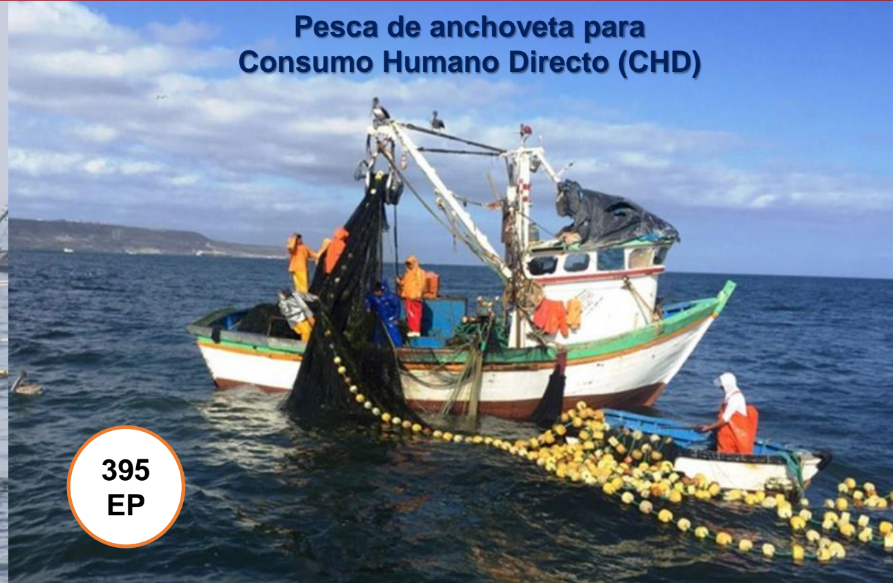
Pesca de anchoveta para Consumo Humano Directo (CHD)