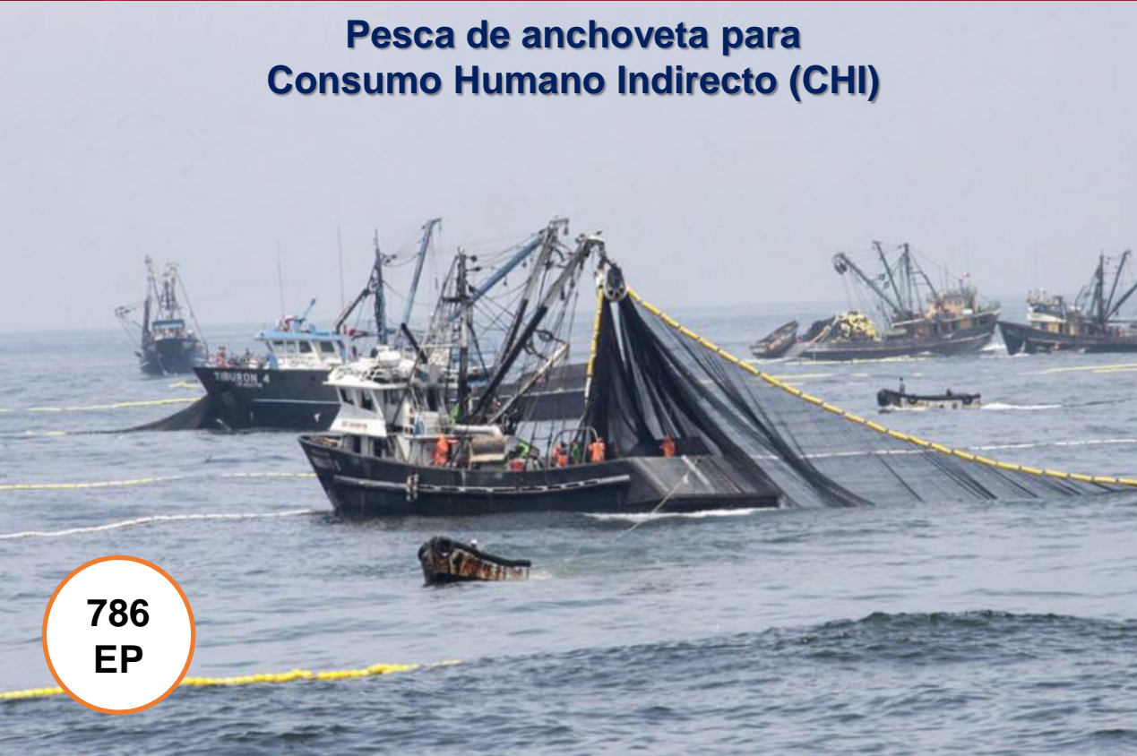
Pesca de anchoveta para Consumo Humano Indirecto (CHI)