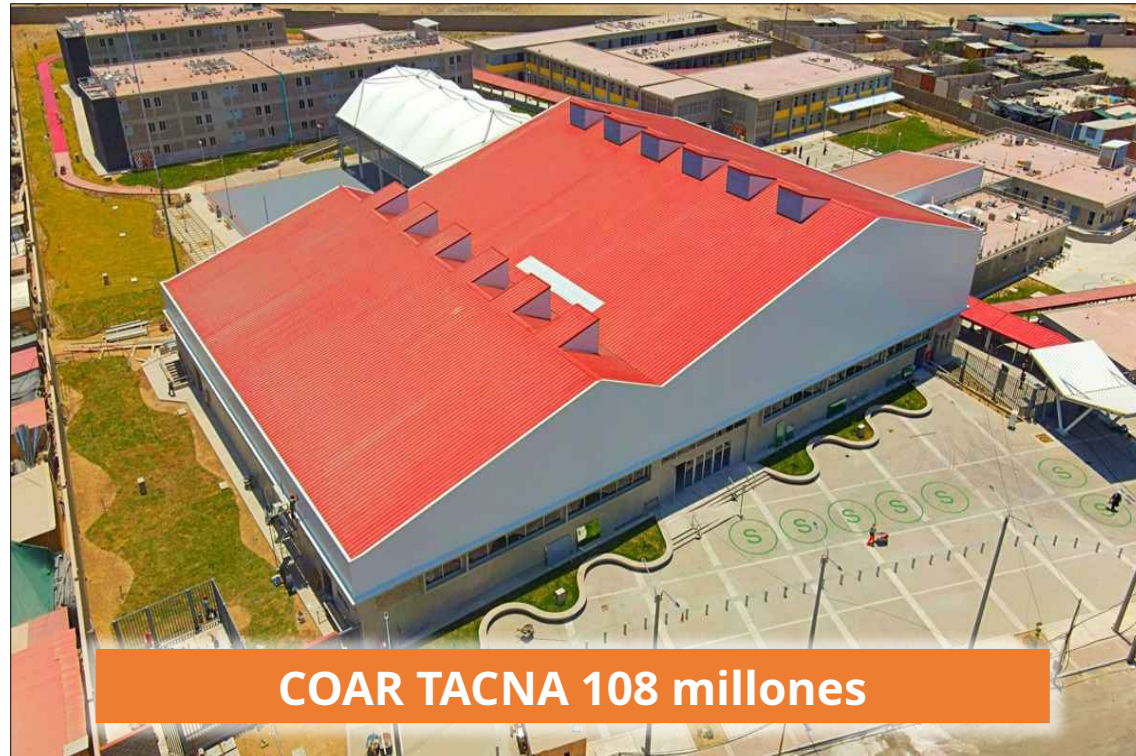
COAR TACNA 108 millones