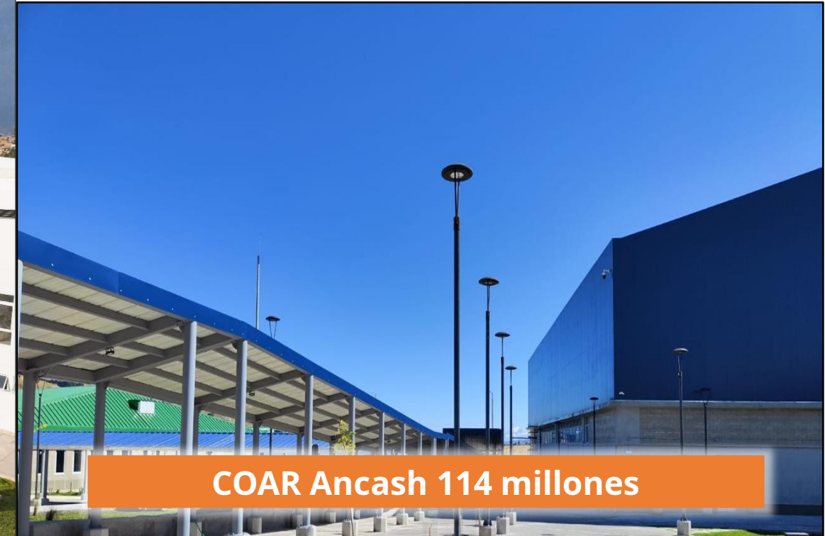
COAR Ancash 114 millones