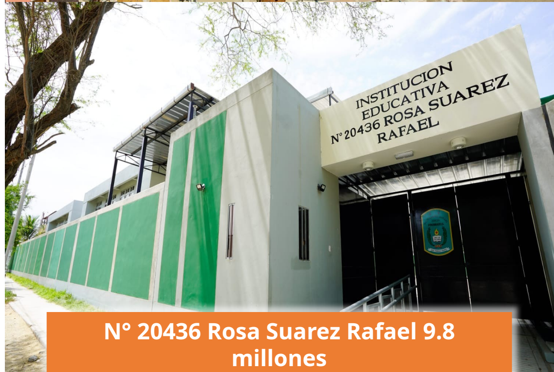
N° 20436 Rosa Suarez Rafael 9.8 millones