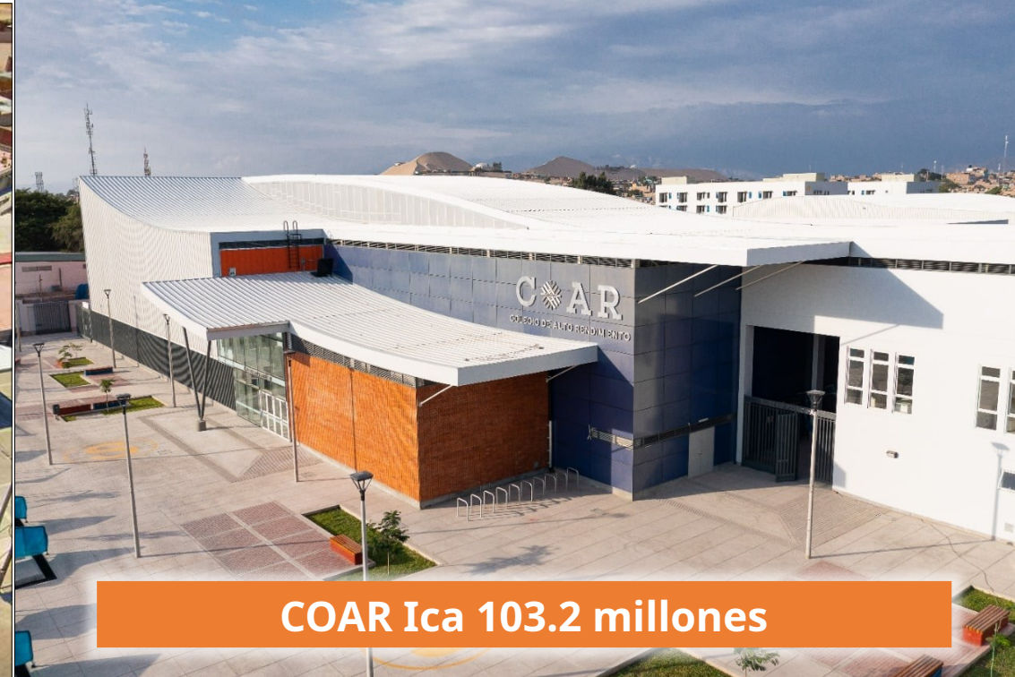
COAR Ica 103.2 millones