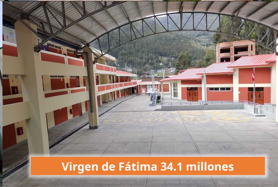
Virgen de Fátima 34.1 millones