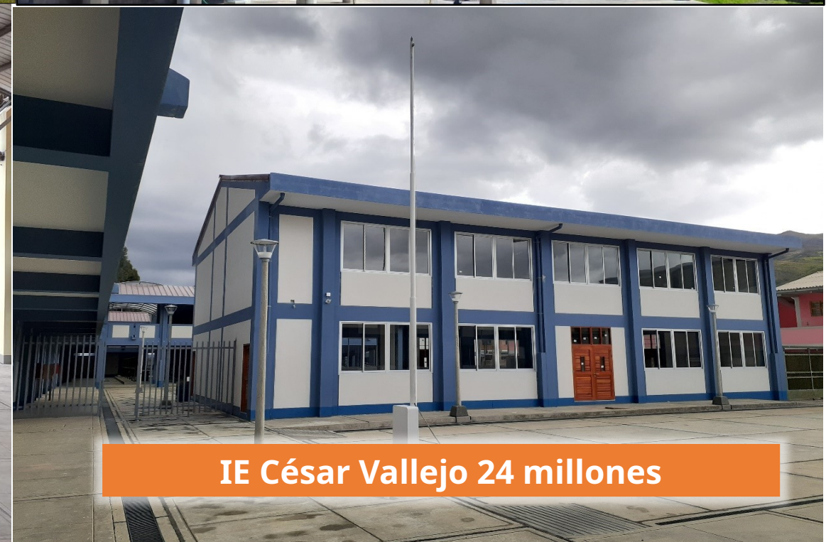
IE César Vallejo 24 millones