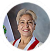
Maria Agüero Congresista de la República