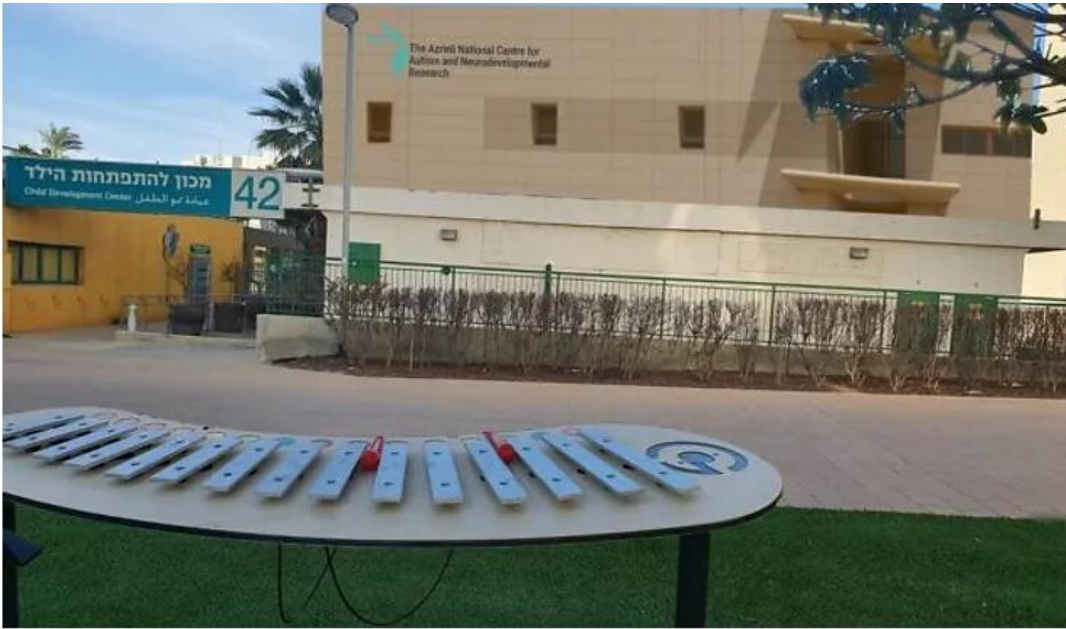
El edificio que albergará el Centro Nacional Azrieli para la Investigación del Autismo y el Neurodesarrollo.