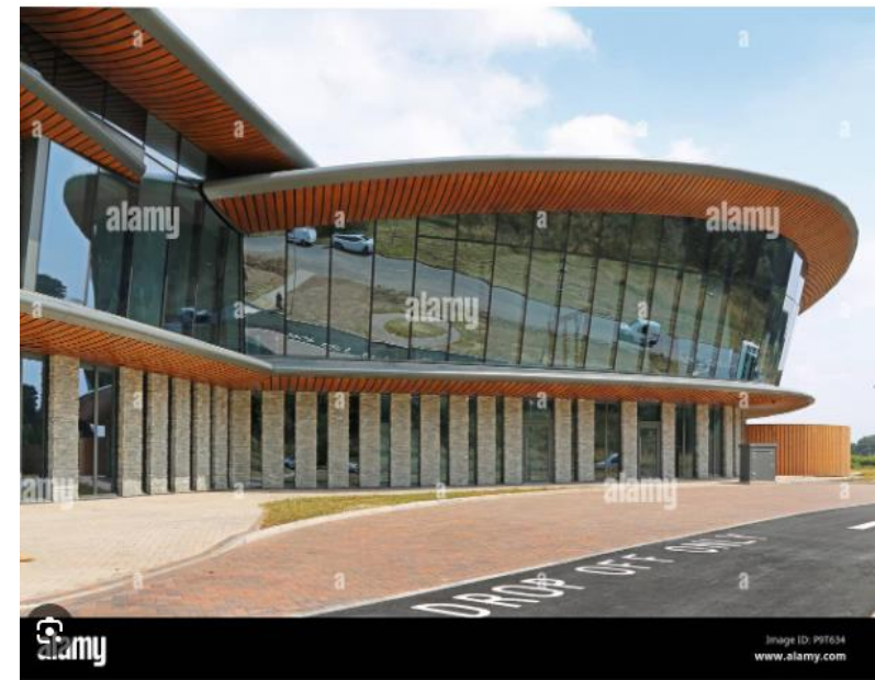
La caridad Caudwell Children's nuevo centro de autismo de la Universidad de Keele, Stoke on Trent, UK. El nuevo...