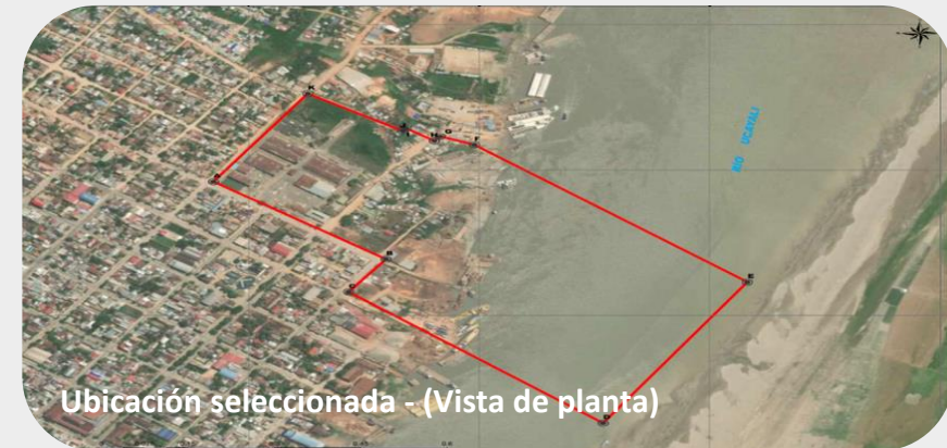
Ubicación seleccionada - (Vista de planta)