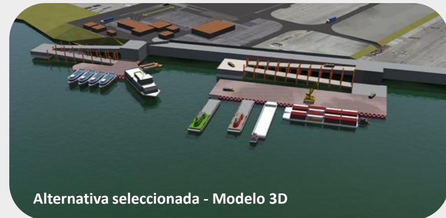
Alternativa seleccionada - Modelo 3D