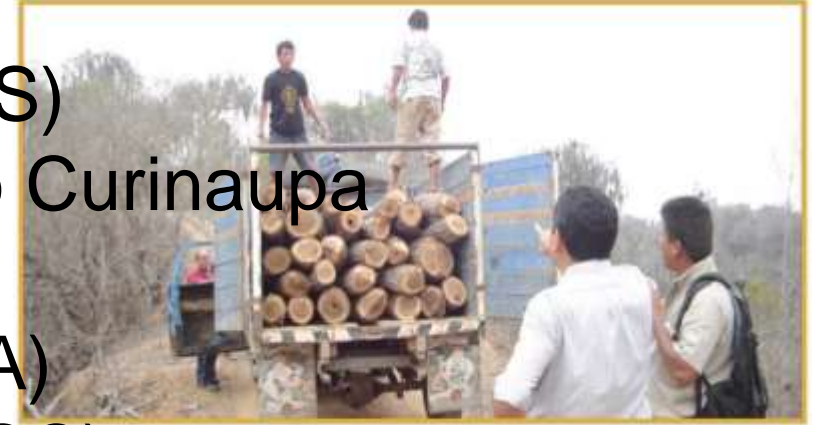
Intervención por tala ilegal en el Parque Nacional Cerros de Amotape de septiembre del 2005.