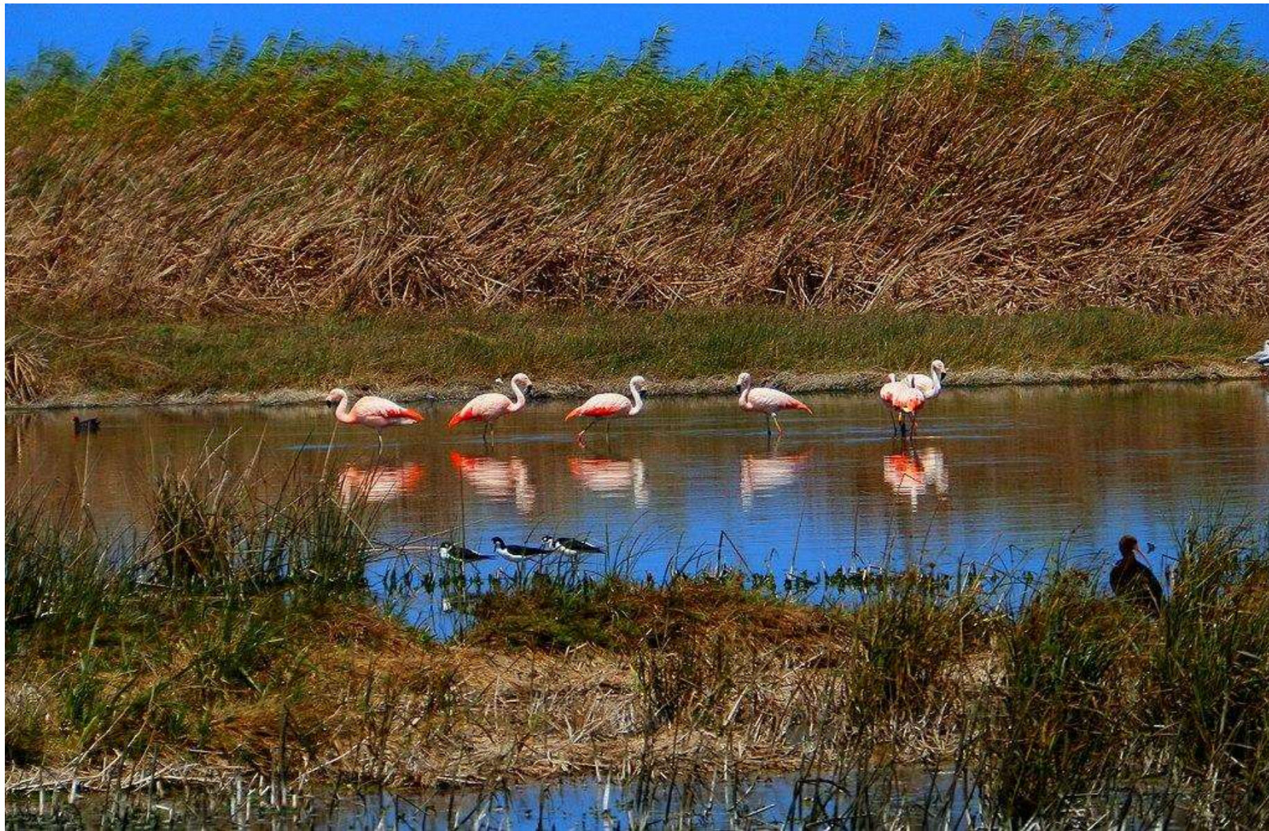
Grupo de flamencos captados el 31 de octubre del 2021 alimentándose en los humedales de Villa María ubicado en Chimbote.