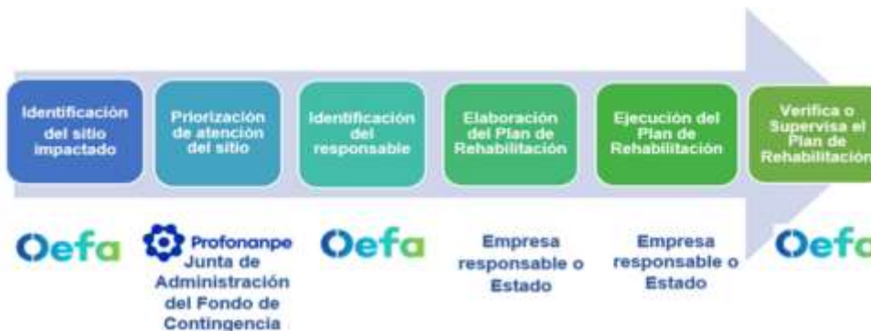
Figura: N.º 1 Procedimiento de la Ley N.º 30321 y su Reglamento.