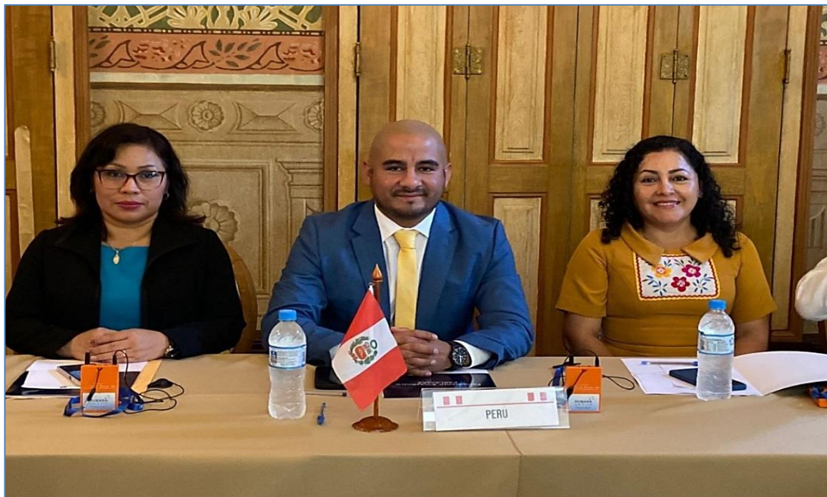
Foto N°1: Participación en la sesión extraordinaria del Parlamento Amazónico