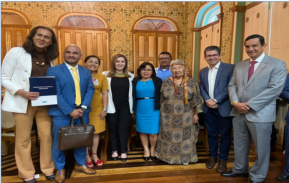
Foto N°2: delegados presentes de los países miembros del Parlamento Amazónico