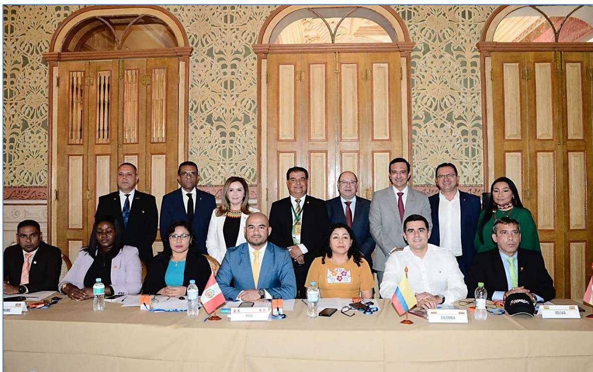
Foto N°2: delegados presentes de los países miembros del Parlamento Amazónico