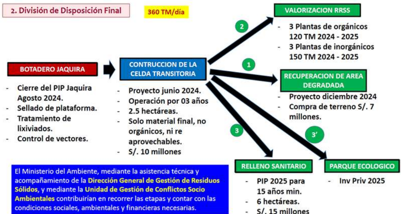
Gráfico 2. Botadero de Haqira. Proyectos de inversión para mejorar el manejo de residuos sólidos municipales.