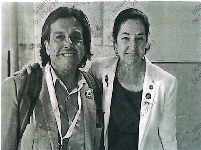
Figura 7. Foto de los Congresistas Ed Málaga, vicepresidente de la Comisión Especial de Cambio Climático del Congreso del Perú y Monica Medina, Subsecretaria de Océanos y Asuntos Científicos y Ambientales Internacionales (OES) del Gobierno de los Estados Unidos.

En general, la recepción fue un evento exitoso que ayudó a promover la colaboración y cooperación entre los jóvenes representantes de organizaciones oceánicas y otras partes interesadas. Proporcionó una plataforma para compartir información e ideas y ayudó a fortalecer la red de personas y organizaciones que trabajan para proteger nuestros océanos.