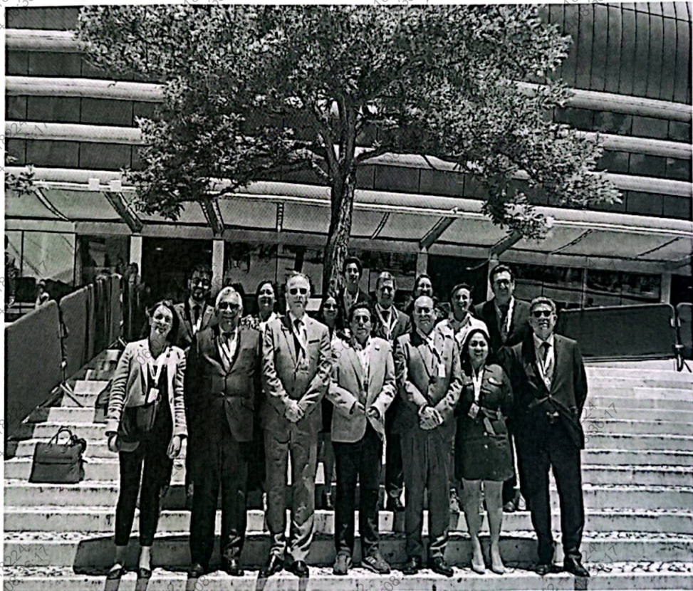
Figura 1. Foto inicial de la delegación peruana en el Lisboa Altice Arena Convention Center, ubicado en Parque das Nações, Rossio dos Olivais, Lote 2.13

Previo al inicio de la II conferencia de los Océanos de las Naciones Unidas, la delegación peruana se reunió para la foto oficial, así como para presentar mutuamente a sus miembros en la delegación y facilitar la colaboración y el intercambio de contactos entre ellos.