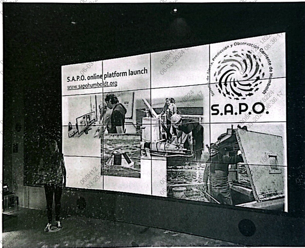
Figura 12.a Foto de la presentación del Sistema de Alerta, Predicción y Observación (S.A.P.O.) basado en la ciencia y a la escala del Gran Ecosistema Marino Corriente de Humboldt (GEMCH)