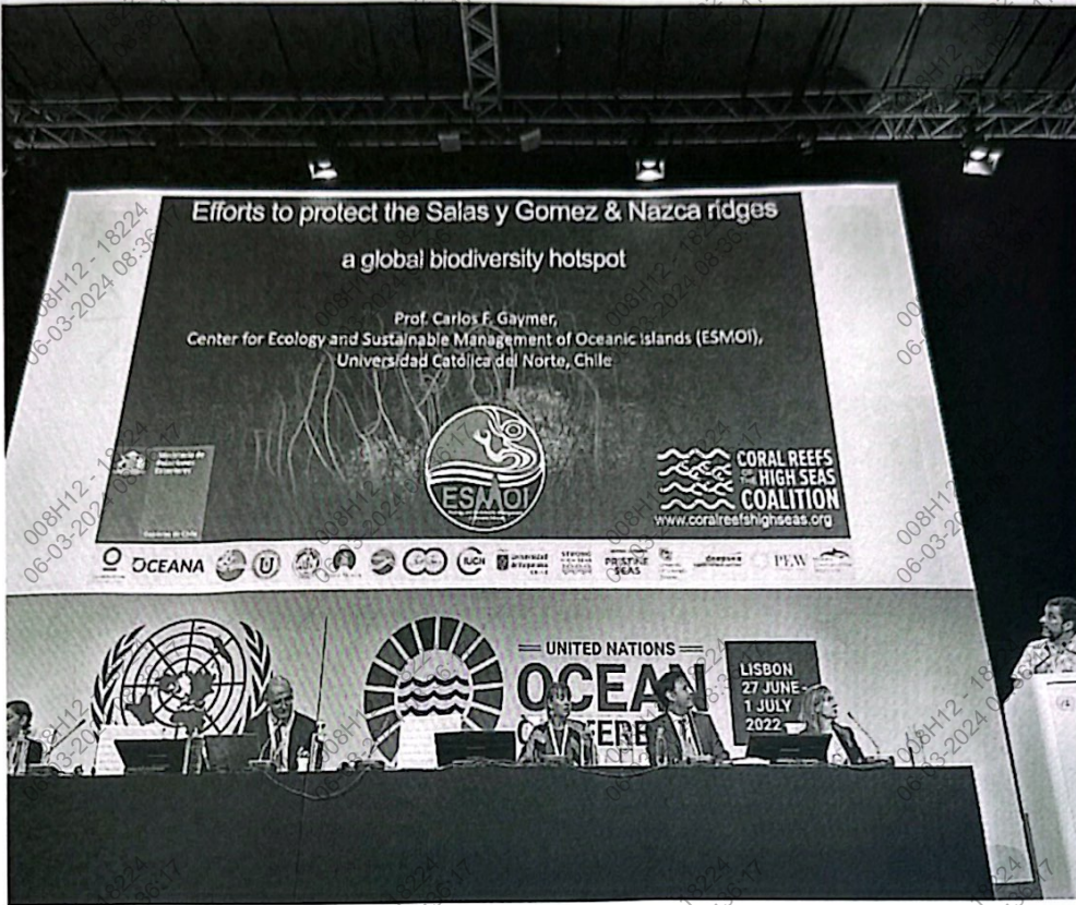
Figura 13.a Foto de la sesión de los Esfuerzos para proteger la dorsal de Nazca, Salas y Gómez.

"Decenio de la igualdad de oportunidades para mujeres y hombres" "Año del Fortalecimiento de la Soberanía Nacional"