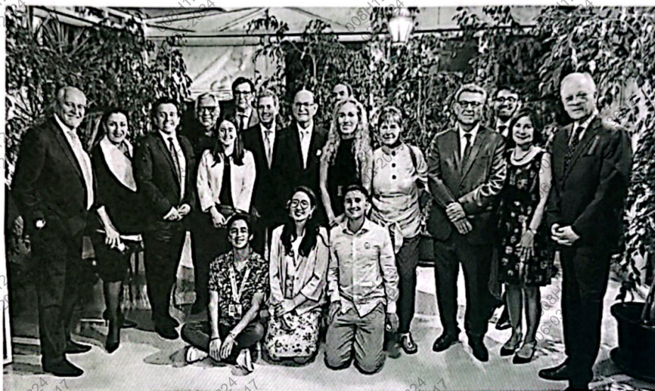
Figura 5. Foto de delegación Peruana en la II Conferencia de las Naciones Unidas sobre el Océano (II UNOC) en Casa del embajador de Perú en Portugal Carlos Gil de Montes.

Reunión con delegación Peruana en Casa del embajador de Perú en Portugal Carlos Gil de Montes donde se ofreció una velada y recepción. En ella, se brindó palabras de bienvenida y los congresistas dieron unas palabras formales de agradecimiento, informando a los invitados sobre sus actividades e intereses, tomándose finalmente la foto oficial de la delegación.