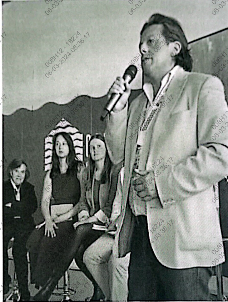
Figura 10. Foto del congresista Málaga dando palabras finales al Panel de Manejo y conservación de los ecosistemas de profundidad.

Sesión de la tarde: Mejorar la conservación y el uso sostenible de los océanos y sus recursos mediante la aplicación del derecho internacional, como se refleja en la Convención de las Naciones Unidas sobre el Derecho del Mar.