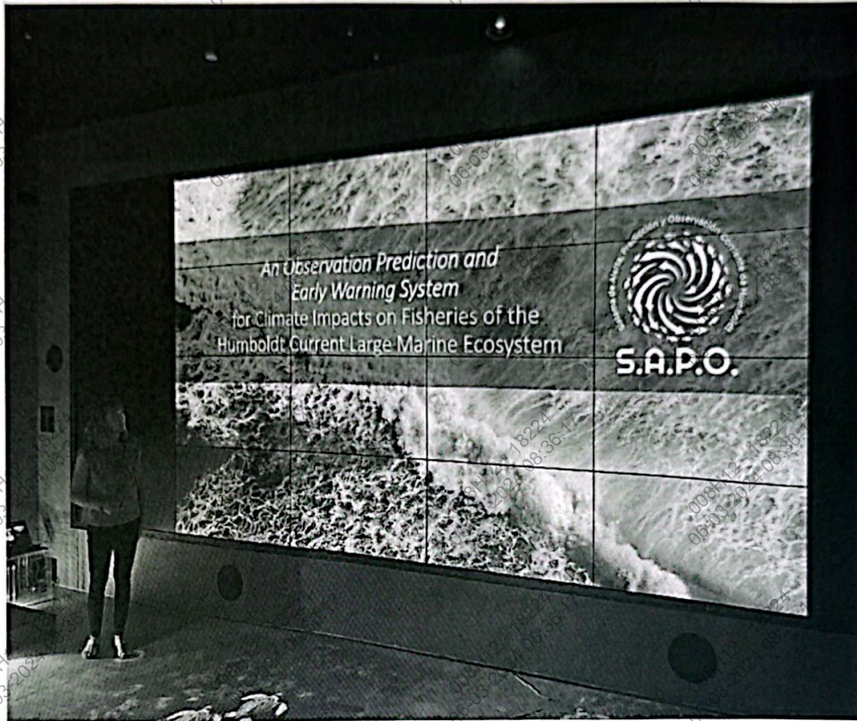
Figura 12.b Foto de la presentación del Sistema de Alerta, Predicción y Observación (S.A.P.O.) basado en la ciencia y a la escala del Gran Ecosistema Marino Corriente de Humboldt (GEMCH)

"Decenio de la igualdad de oportunidades para mujeres y hombres" "Año del Fortalecimiento de la Soberanía Nacional"