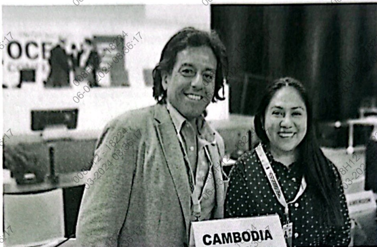
Figura 6. Foto de la Congresista Heidi Juárez y el Congresista Ed Málaga en la sesión Sesión de la mañana sobre minimizar y abordar la acidificación de los océanos, la desoxigenación y el calentamiento de los océanos.

un mecanismo financiero para pérdidas y daños, y reemplazar la producción de alimentos intensiva en recursos con algas marinas.