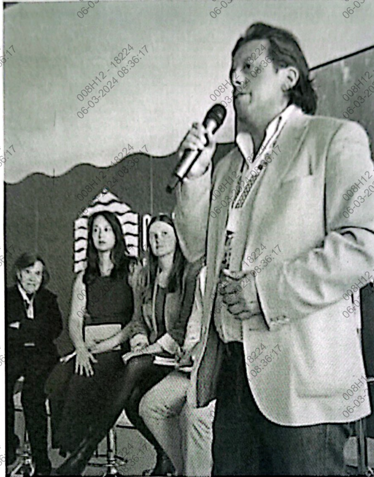
Figura 10. Foto del congresista Málaga dando palabras finales al Panel de Manejo y conservación de los ecosistemas de profundidad.

Sesión de la tarde: Mejorar la conservación y el uso sostenible de los océanos y sus recursos mediante la aplicación del derecho internacional, como se refleja en la Convención de las Naciones Unidas sobre el Derecho del Mar.