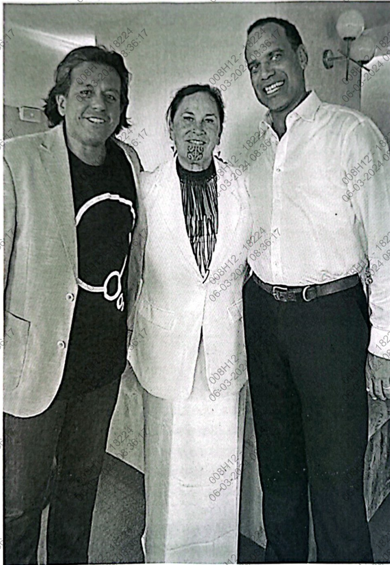
Figura 9. Foto del congresista Malaga Ralph Regenal, Ministro de Asuntos Marítimos de Vanuatu y Debbie Ngarewa-Packer, miembro del parlamento de Nueva Zelanda

Esta reunión entre el Congresista Málaga y el ministro Regenal fue un paso positivo hacia la protección del ecosistema marino de la región del Pacífico.