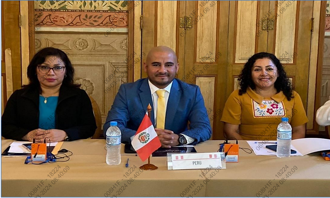
Foto N°1: Participación en la sesión extraordinaria del Parlamento Amazónico