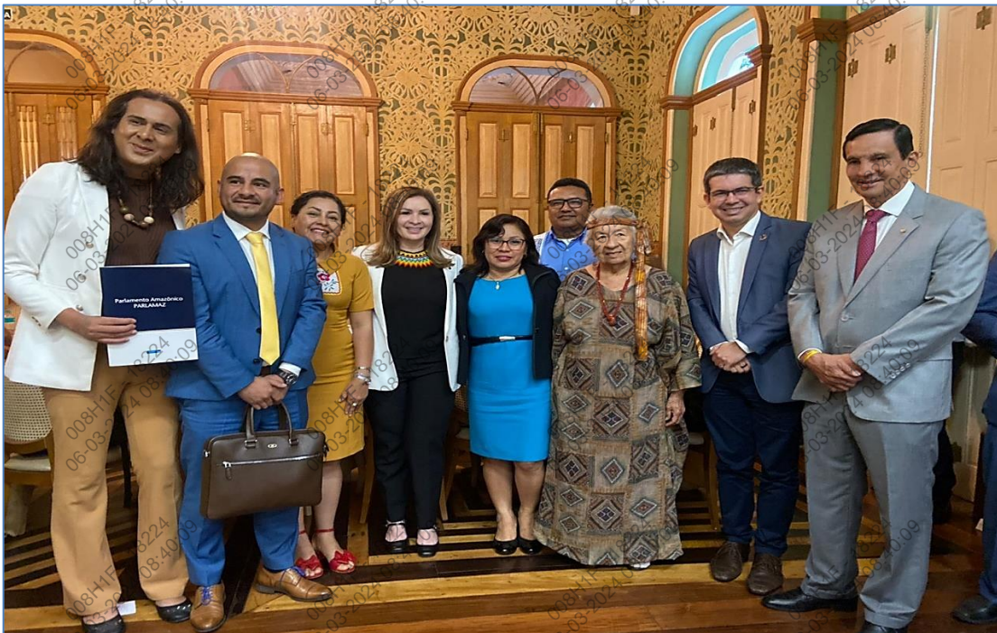
Foto N°2: delegados presentes de los países miembros del Parlamento Amazónico