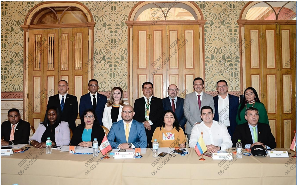
Foto N°2: delegados presentes de los países miembros del Parlamento Amazónico