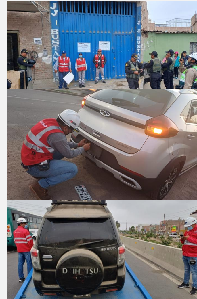
ACTAS DE CONTROL POR INFRACCIÓN F.1 2021 - 2023