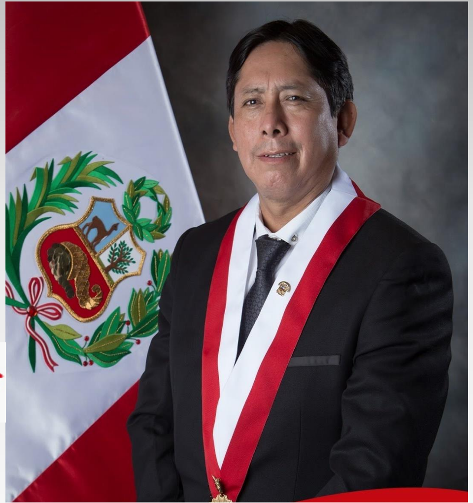
PAUL SILVIO GUTIERREZ TICONA Congresista de la República