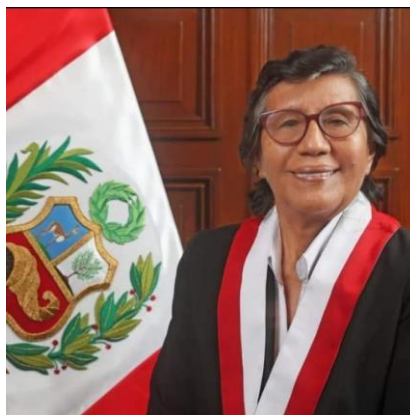
LUCINDA VÁSQUEZ VELA Congresista de la Región San Martín Vocera del Bloque Magisterial de Concertación Nacional