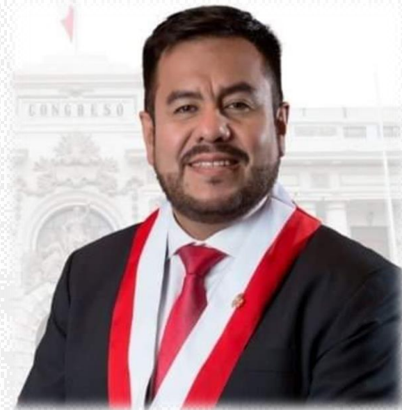
Carlos Zeballos CONGRESISTA DE LA REPÚBLICA

LEY DE REFORMA CONSTITUCIONAL, QUE PROPONE MODIFICAR EL ARTÍCULO 137° Y 165° DE LA CONSTITUCIÓN POLÍTICA DEL PERÚ QUE ESTABLECE LA PARTICIPACIÓN DE LAS FUERZAS ARMADAS PARA BRINDAR APOYO A LA POLICÍA NACIONAL DEL PERÚ CON EL FIN DE FORTALECER LA SEGURIDAD CIUDADANA.