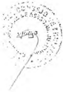
HANIA PÉREZ DE CUÉLLAR LUBIENSKA Ministra de Vivienda, Construcción y Saneamiento