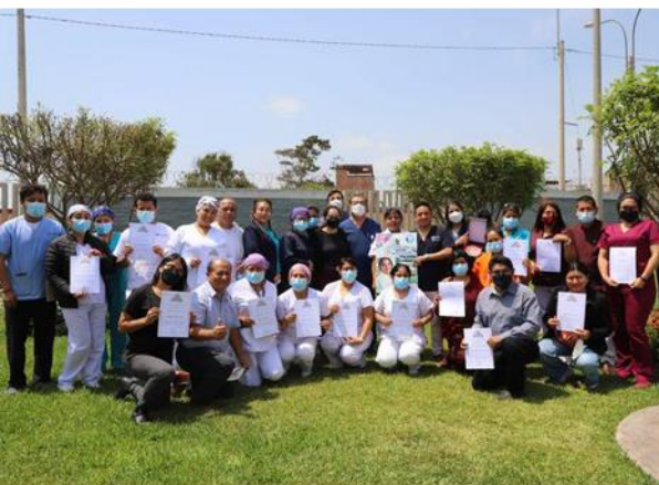
Visita al Hospital de Emergencias Villa El Salvador.