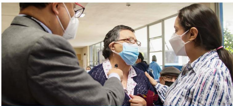
Visita inopinada al hospital Rebagliati, en su labor de fiscalización corroboró las múltiples denuncias y quejas de los pacientes.