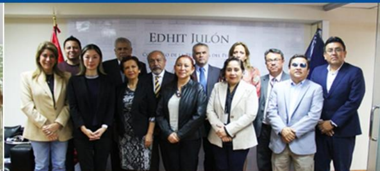
Mesas de Trabajo sobre el Proyecto de Ley 4506/2022-CR, Ley que fortalece la Ley 31014, "Ley que regula el uso de sustancias modelantes en tratamientos corporales con fines estéticos y define dicho procedimiento como acto médico".