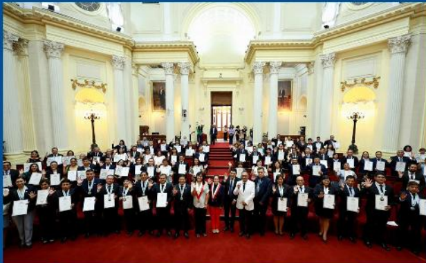
Reconocimiento a los tecnólogos Médicos