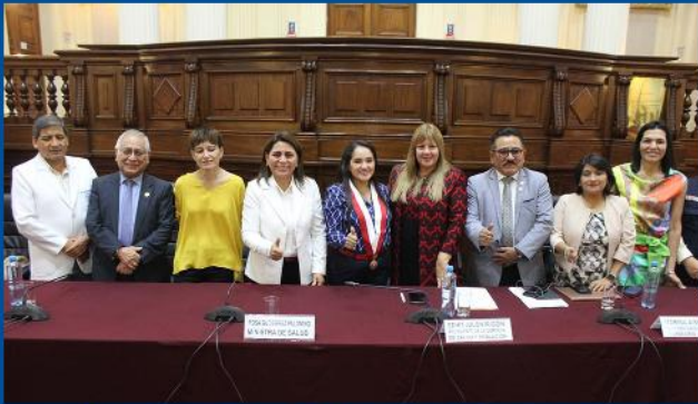
Seminario: ¿Cómo proteger a la población más vulnerable?