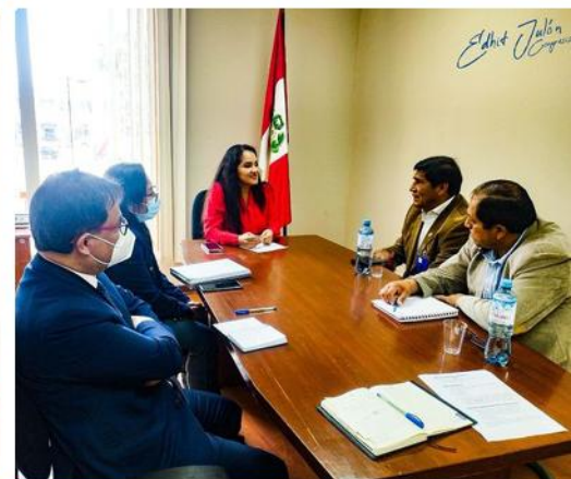
Reunión con el Comité Multisectorial de EsSalud Chota.