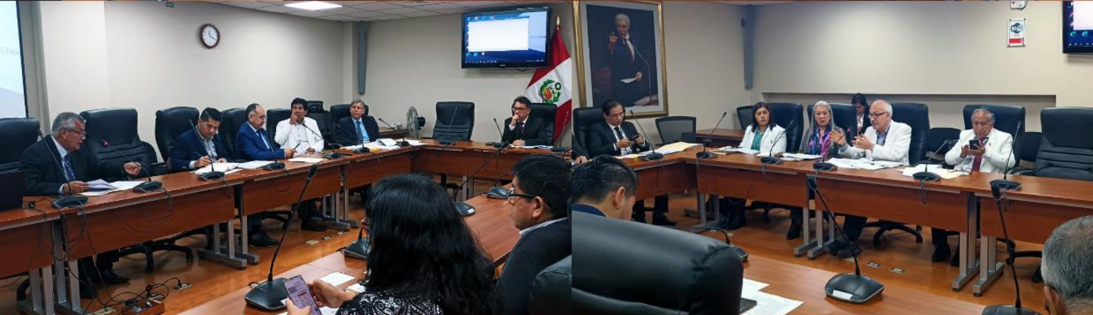
Mesa de Trabajo: En relación al documento técnico: "Lineamientos para la elaboración del manual de operaciones de los órganos prestadores de servicios de Salud (Institutos especializados y hospitales)" aprobado mediante R.M. 475-2023/MINSA.