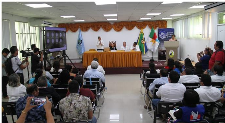
Quinta Sesión Descentralizada de la Comisión de Salud y Población en el departamento de Tumbes.