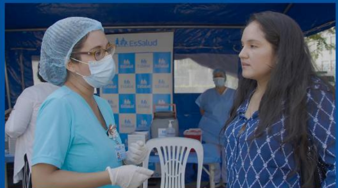
Jornada de vacunación, plazuela Bolívar