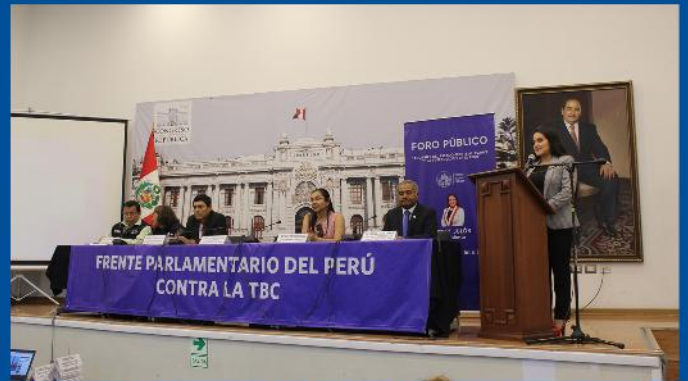
Foro: Acciones del estado frente a la TBC en el Perú