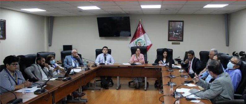
Mesa de Trabajo: Modificaciones a la Ley N° 30947, Ley de Salud Mental.