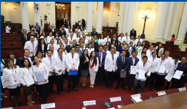
Reconocimiento a los odontólogos