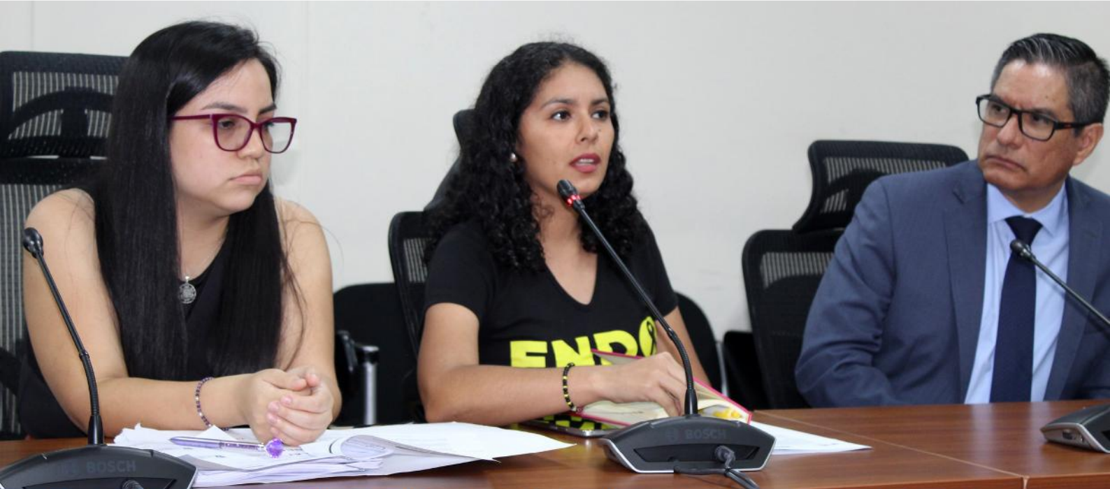
Mesa de Trabajo: Proyecto de ley 4586/2022-CR, Ley que regula la atención, diagnóstico temprano y tratamiento integral de pacientes con Endometriosis.

Como parte de nuestro compromiso con el fortalecimiento del debate público y técnico respecto a diversas propuestas legislativas de interés de la ciudadanía, hemos realizado trece (13) Mesas de Trabajo con representantes del sector público, la empresa privada, la academia y la sociedad civil. A continuación, un resumen de las mesas realizadas durante el periodo anual de sesiones 2022 - 2023.