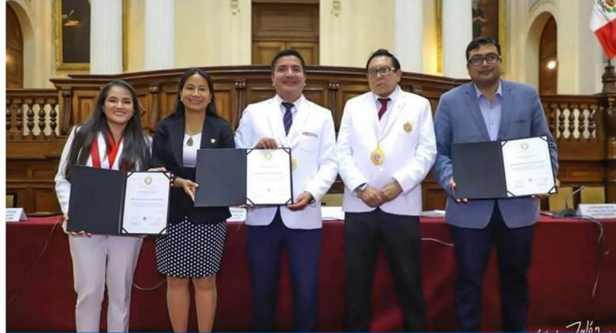
Día de la odontología peruana.