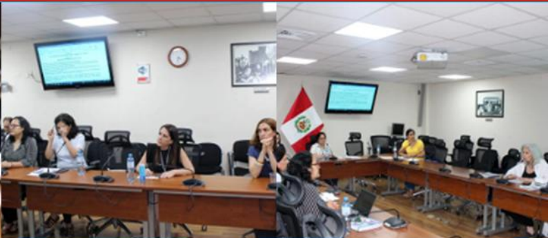
Mesa de Trabajo: Proyecto de Ley N° 3437, "Ley de control de tabaco, nicotina, sucedáneos de tabaco y nicotina, para la protección de la vida y la salud".