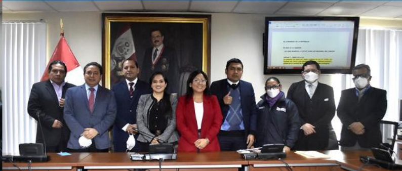
Mesa de Trabajo entre parlamentarios, miembros del MINSA y el INEN para consensuar el texto sobre la modificatoria de la Ley del Cáncer.