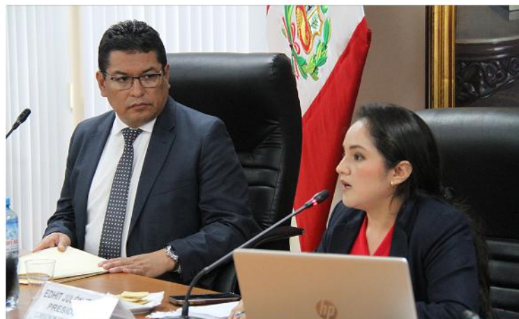
En nuestra 19° sesión ordinaria recibimos al presidente ejecutivo de EsSalud, equipo técnico y a los representantes del FONAFE.