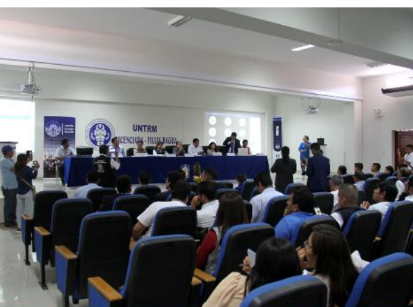
Cuarta Sesión Descentralizada de la Comisión de Salud y Población en el departamento de Amazonas.