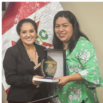
Reconocimiento a los representantes Cas Regular Asistencial del Minsa, de diferentes regiones de nuestro país.