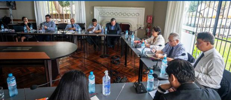
Mesa de Trabajo: Proyecto de ley 3537/2022-CR, Ley que regula y organiza un eficiente funcionamiento del Sistema Nacional de Residencia Médica.