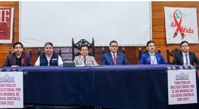
Foro Público Multisectorial por el Día Mundial de la Lucha contra el SIDA – 2022.