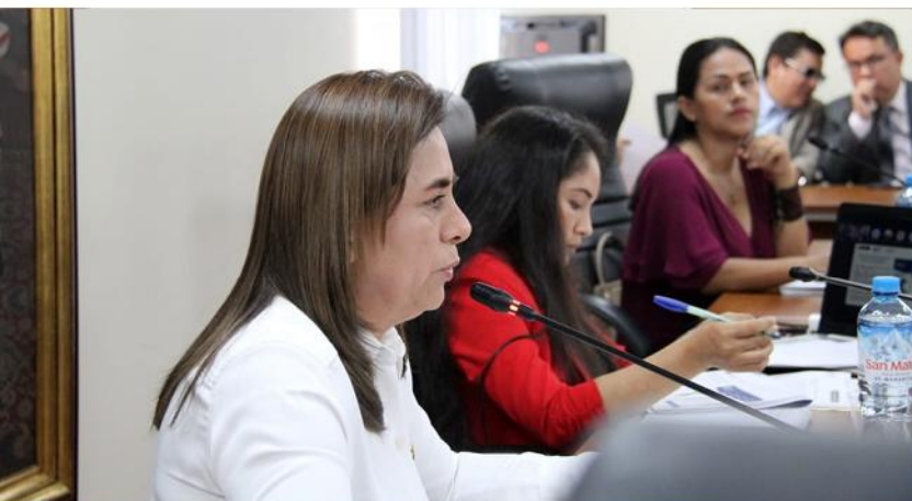
La ministra de Salud, Rosa Gutiérrez, se presentó ante la Comisión de Salud y Población para rendir cuentas por el desempeño de su sector frente a la epidemia del dengue en el país.