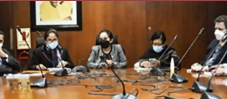
Mesa de Trabajo: Implementación del cuarto tramo de la escala salarial, el ascenso automático en el escalafón e inclusión del nuevo corte del nombramiento del personal de salud.