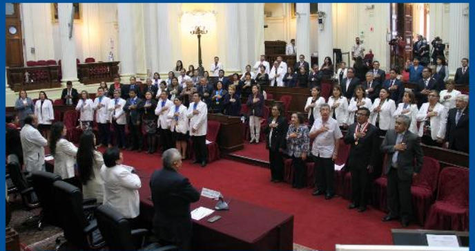
Reconocimiento a los Químicos Farmacéuticos