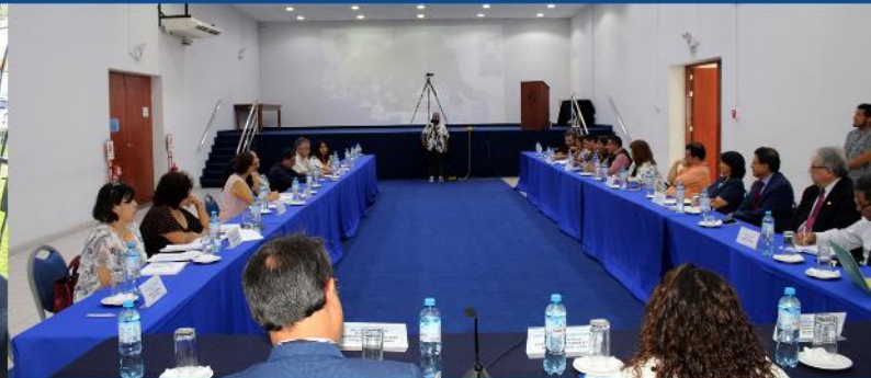
Mesa de Trabajo: Implementación de la Ley N° 30681, Ley que regula el uso medicinal y terapéutico del cannabis y sus derivados, para las asociaciones de pacientes.