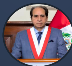
Jorge Arturo Zeballos Aponte Congresista de la República