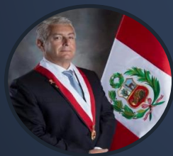
Juan Carlos Lizarzaburu Lizarzaburu Congresista de la República