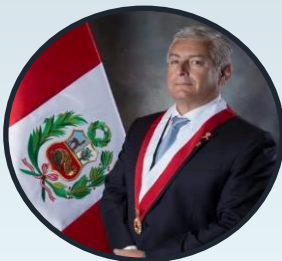
INTEGRANTE: CONG. JUAN CARLOS LIZARZABURU LIZARZABURU