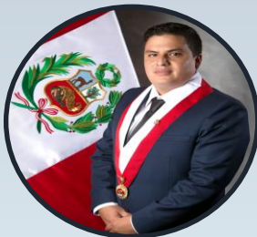
INTEGRANTE: CONG. DIEGO ALONSO BAZÁN CALDERÓN