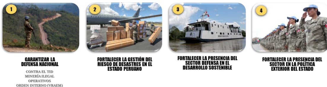
GRÁFICO: OBJETIVOS ESTRATÉGICOS SECTORIALES