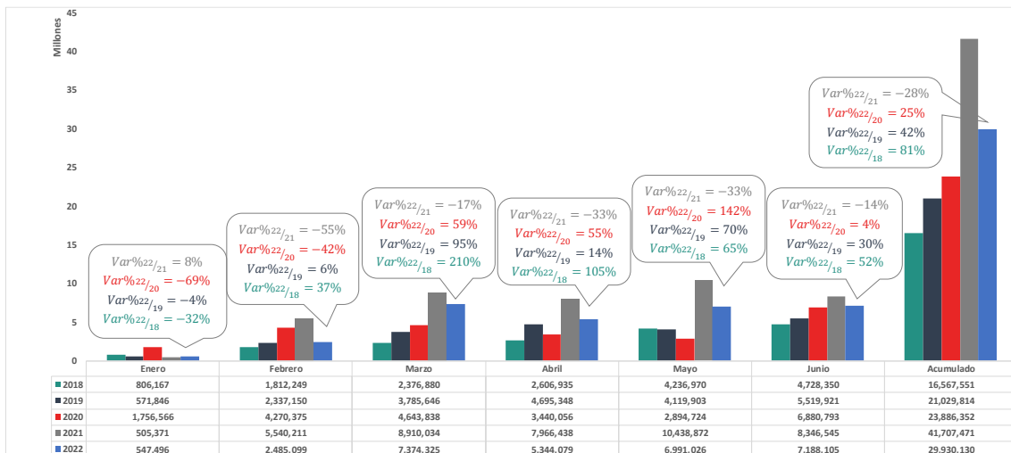
Gráfico 1: ejecución presupuestaria, inversiones, Sector Cultura, al II trimestre 2018-2022 (últimos 5 años)

Fuente: Portal de Transparencia Económica del MEF. Elaboración: OPMI del Sector Cultura.