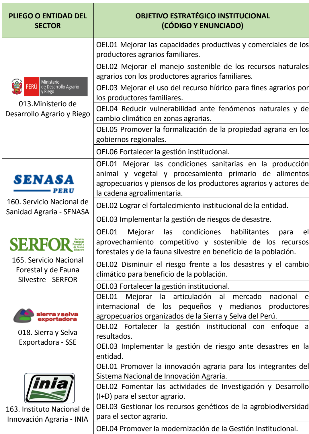
Tabla N° 01: Objetivos Estratégicos Institucionales de los Pliegos del Sector Agrario y de Riego

“Año del Bicentenario del Perú: 200 años de Independencia”