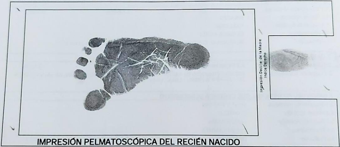
IMPRESIÓN PELMATOSCÓPICA DEL RECIÉN NACIDO

REPUBLICA DEL PERU Ministerio de Salud Instituto Nacional de Estadística e Informática RENIEC