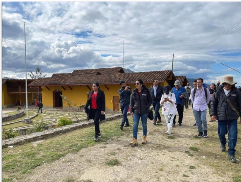
Foto: Llegada al Parador de la Malca – Complejo Arqueológico Kuélap

No se pudo cumplir lo planificado debido a que el frente de defensa de la comunidad de Kuelap no dejó ingresar a los miembros de la Comisión y autoridades que acompañaban los mismos exigieron que las instituciones y organizaciones los tomen en cuenta para la toma de decisiones y planificación en la conservación del Complejo Kuelap.