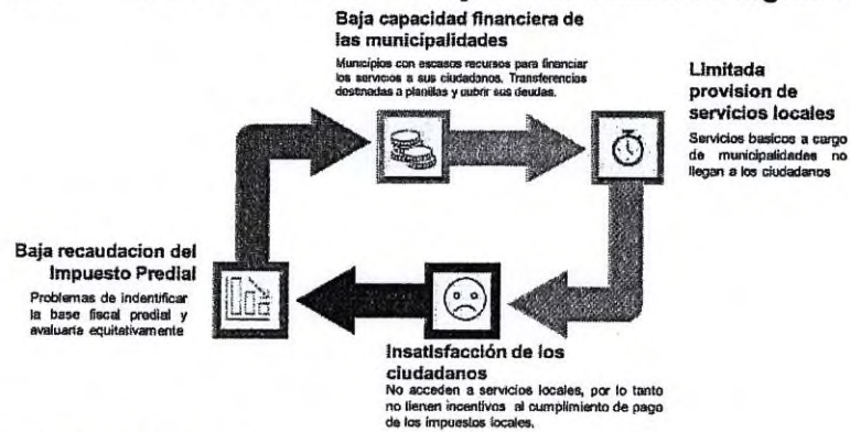
Figura 1. El círculo vicioso de la baja recaudación de ingresos locales

incremento sostenido de sus pasivos. Al mismo tiempo, los ciudadanos, al no tener cobertura de servicios esenciales de nivel municipal que impactan directamente en su bienestar, no tienen incentivos para cumplir con el pago de sus tributos municipales, principalmente el impuesto predial, lo cual, a su vez, debilita financieramente a las municipalidades, entrando en un círculo vicioso, tal y como se ilustra en la Figura 1.