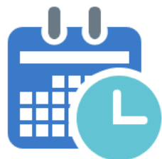
CRONOGRAMA DE IMPLEMENTACIÓN