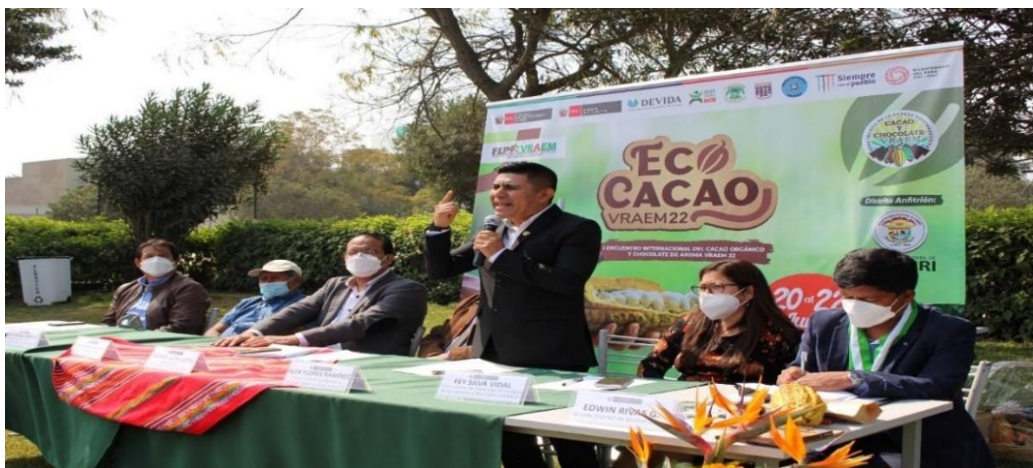
El presidente de la Comisión Especial a favor del VRAEM participando en la ceremonia de lanzamiento del “I Encuentro Internacional del Cacao Orgánico y Chocolate de Aroma del VRAEM, ECOCACAO VRAEM 2022”.

El 17 de junio de 2022, el Presidente de la Comisión Especial a favor del VRAEM, participó en el lanzamiento del “I Encuentro Internacional del Cacao Orgánico y Chocolate de Aroma del VRAEM, ECOCACAO VRAEM 2022”, a celebrarse en Kimbiri (La Convención-Cusco), del 20 al 22 de junio de 2022, pidiendo al Ejecutivo mayor compromiso contundente para promover el desarrollo socioeconómico del VRAEM, principalmente un compromiso más contundente con los agricultores, con los campesinos, de promocionar, de apoyar y de buscar mercados a nivel internacional.