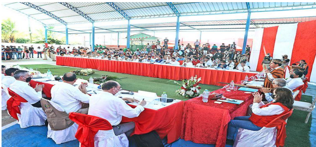
Ex presidente de la República Pedro Castillo Terrones, plantea crear una unidad ejecutora para el desarrollo del VRAEM, similar al de la Autoridad para la Reconstrucción con Cambios.

Sobre la situación de la "Creación de la Unidad Ejecutora para el Desarrollo del VRAEM", propuesto por el ex Presidente de la República, Pedro Castillo Terrones, en el VII Consejo de Ministros Descentralizado, realizado el 27/04/2022, en el distrito de Samugari; el Equipo Técnico de la Comisión - VRAEM, viene solicitando al Ministro de Economía y Finanzas, informe sobre la propuesta presidencial a favor del VRAEM.