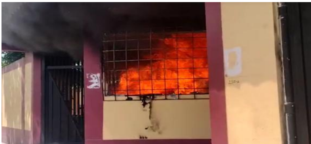
Módulo judicial de Huanta en Ayacucho fue quemado por manifestantes en medio del paro de 24 horas.