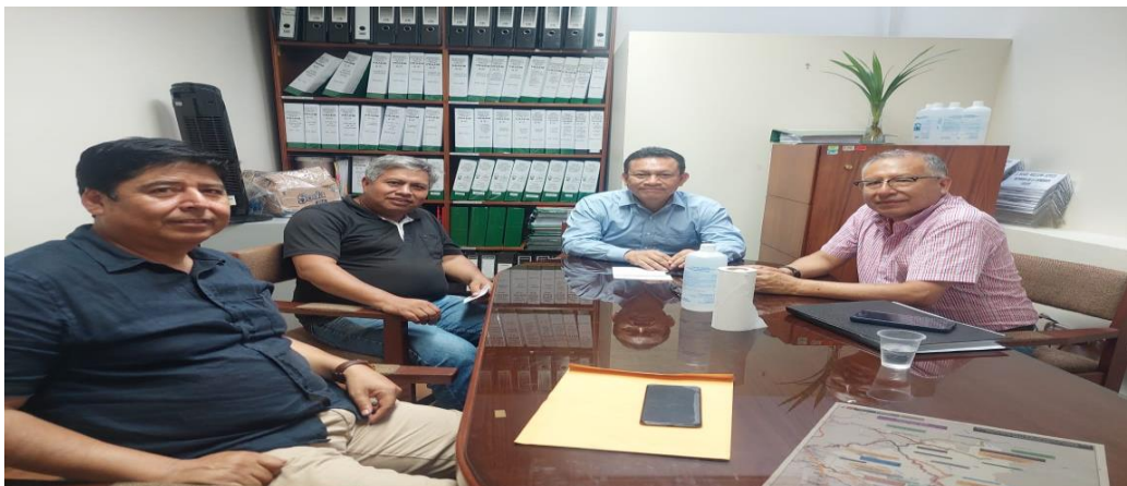
El equipo técnico de la Comisión Especial a favor del VRAEM, reunidos con el ex presidente de la AMUVRAE y su equipo técnico.