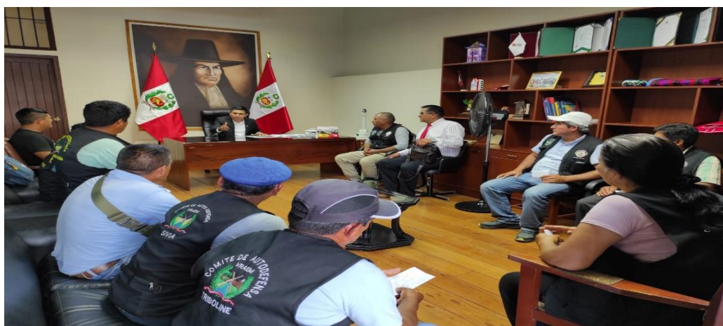
El congresista Alex Flores Ramírez, presidente de la Comisión Especial a favor del VRAEM, recibió en su Despacho a una delegación de los miembros de los Comités de Autodefensa del VRAEM

El 24 de marzo de 2023, el presidente de la Comisión Especial a favor del VRAEM, recibió en su Despacho a una delegación de miembros de los Comités de Autodefensa del VRAEM, con quienes abordó las formas de criminalidad y sus riesgos y el papel de tienen en el desarrollo y defensa de sus pueblos. Se conversó sobre la necesidad de su pronto reconocimiento legal, sin despensar su esencia colectiva, pacífica y civil, vinculada al progreso de sus comunidades.