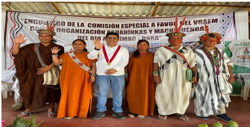
Congresista Alex Flores Ramírez, presidente de la Comisión Especial a favor del VRAEM, reunido con dirigentes de comunidades Ashánincas y Machiguengas del Río Apurímac – OARA, VRAEM.

El 26 de agosto de 2022, la Comisión Especial a favor del VRAEM organizó el "Primer encuentro de la Comisión Especial a favor del VRAEM con las Organizaciones Ashánincas y Machiguengas del Río Apurímac - OARA", donde el congresista Alex Flores Ramírez, explicó los Proyectos de Ley de su autoría, que buscan la atención prioritaria de los poderes del Estado a las demandas de las poblaciones indígenas u originarias, que el Ejecutivo elabore y ejecute un Plan de Emergencia para las Poblaciones Indígenas u Originarias, que contemple sus demandas de salud, educación, electrificación, saneamiento, viviendas rurales, saneamiento físico legal, telefonía, internet y radiodifusión, así como plataformas de servicios fijas (Tambos) y móviles (Plataforma Itinerantes de Acción Social -PIAS), y que fortalece la institucionalidad indígena a través de la declaración de interés nacional de la creación del Viceministerio de Pueblos Indígenas u Originarios en la Presidencia del Consejo de Ministros.