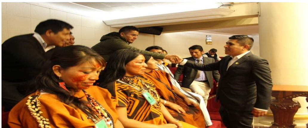
Congresista Alex Flores Ramírez, saludando en el palco del hemiciclo del Congreso de la República a los representantes de la Ugel Pichari-Kimbiri-Villa Virgen.

El 9 de enero de 2023, el presidente de la Comisión Especial a favor del VRAEM, su equipo técnico y representantes de la UGEL Pichari-Kimbiri-Villa Virgen, se reunieron con el ex Ministro de Educación Oscar Becerra Tresierra, para analizar la demanda de 138 personales entre profesores, auxiliares y administrativos en la mencionada UGEL, donde los padres de familia y autoridades locales, pagan de su dinero, al personal educativo faltante. Esta situación se repite todos los años. El Ministro escuchó y se comprometió a resolver esta situación por ser de justicia.