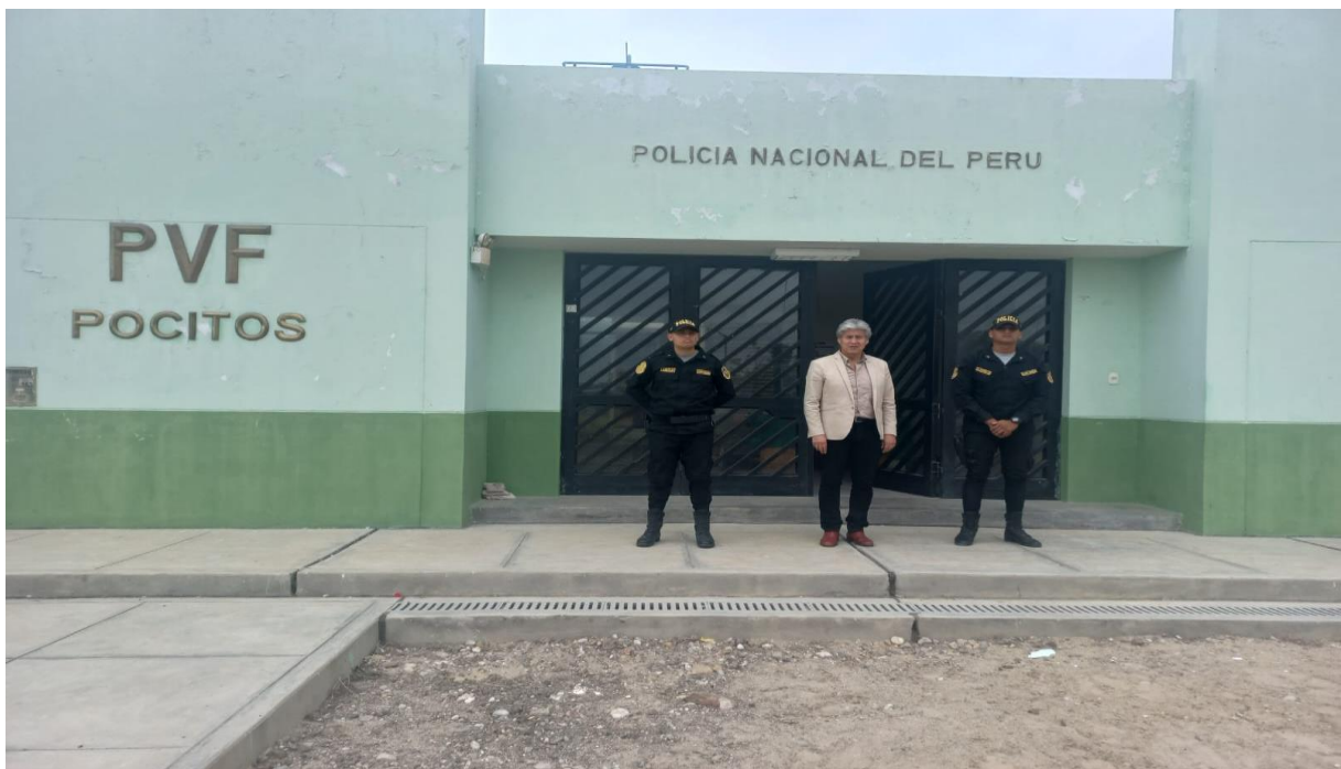
PUESTO DE VIGILANCIA POCITOS (26.10.2022) TUMBES