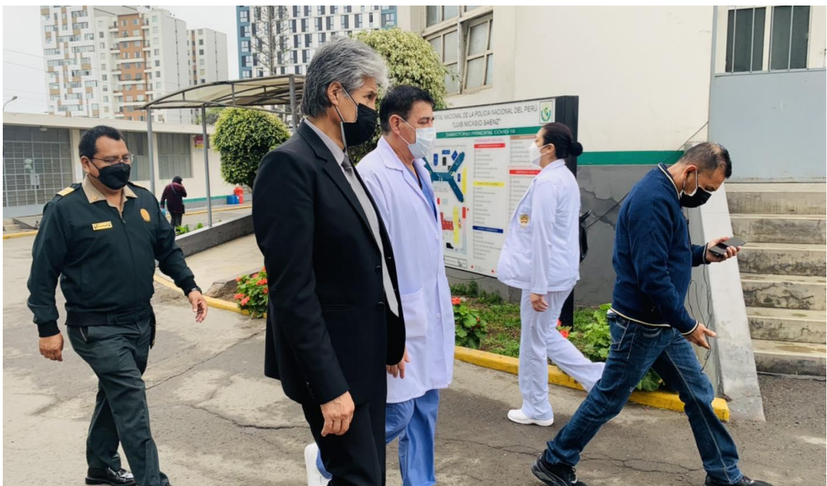
HOSPITAL CENTRAL PNP (04.11.2022)