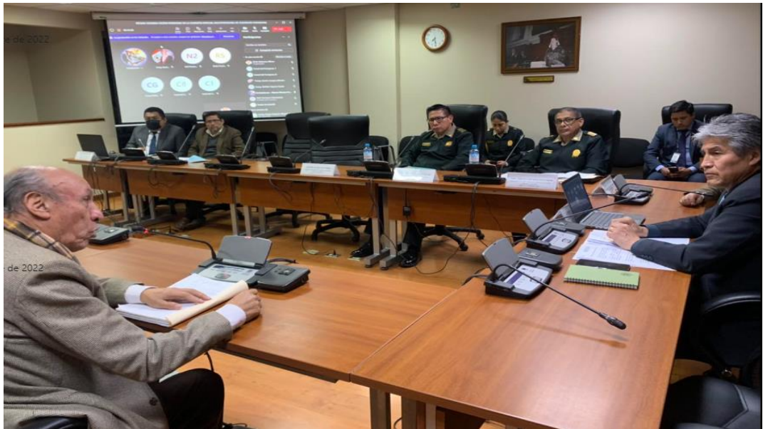
DÉCIMO SEGUNDA SESIÓN ORDINARIA (06.09.2022)