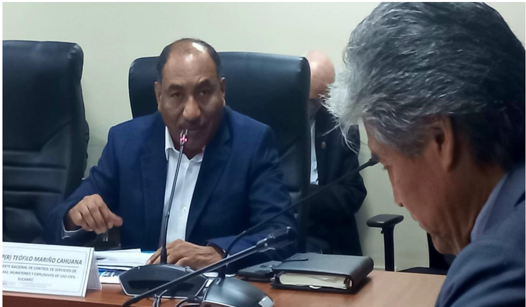
VIGÉSIMO TERCERA SESIÓN ORDINARIA (11.04.2023)

“Decenio de Igualdad de oportunidad para mujeres y hombres” “Año de la unidad, la paz y el desarrollo”