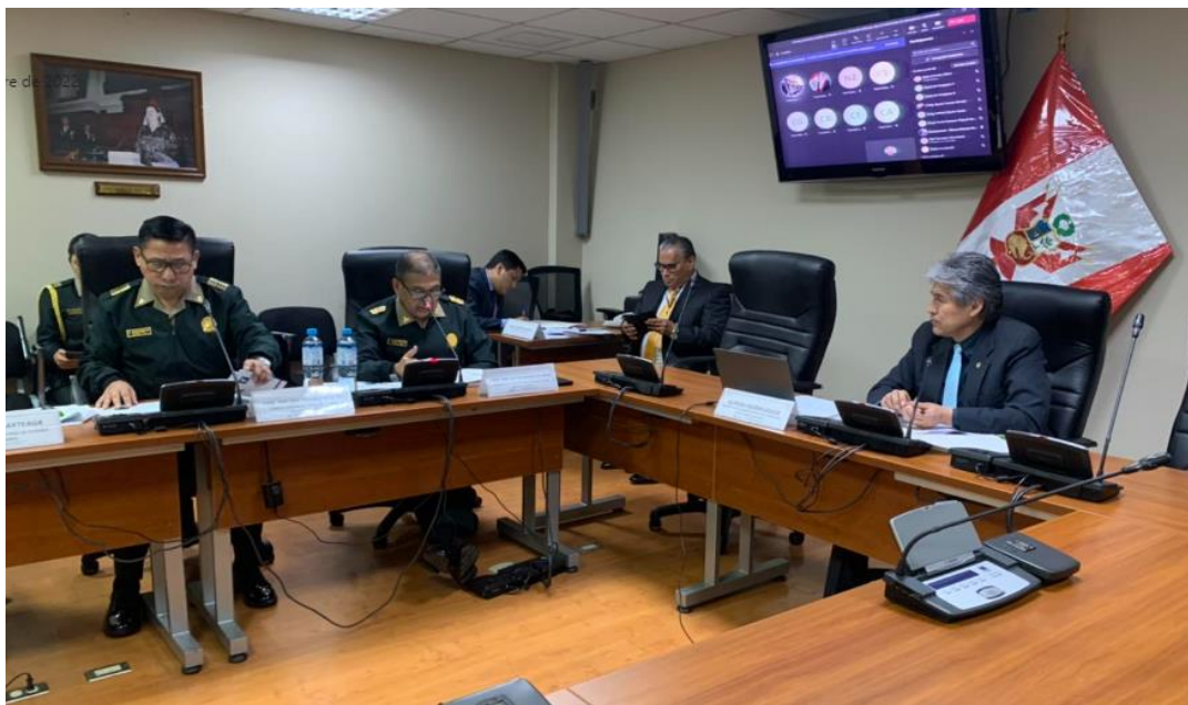
DÉCIMO SEGUNDA SESIÓN ORDINARIA (06.09.2022)