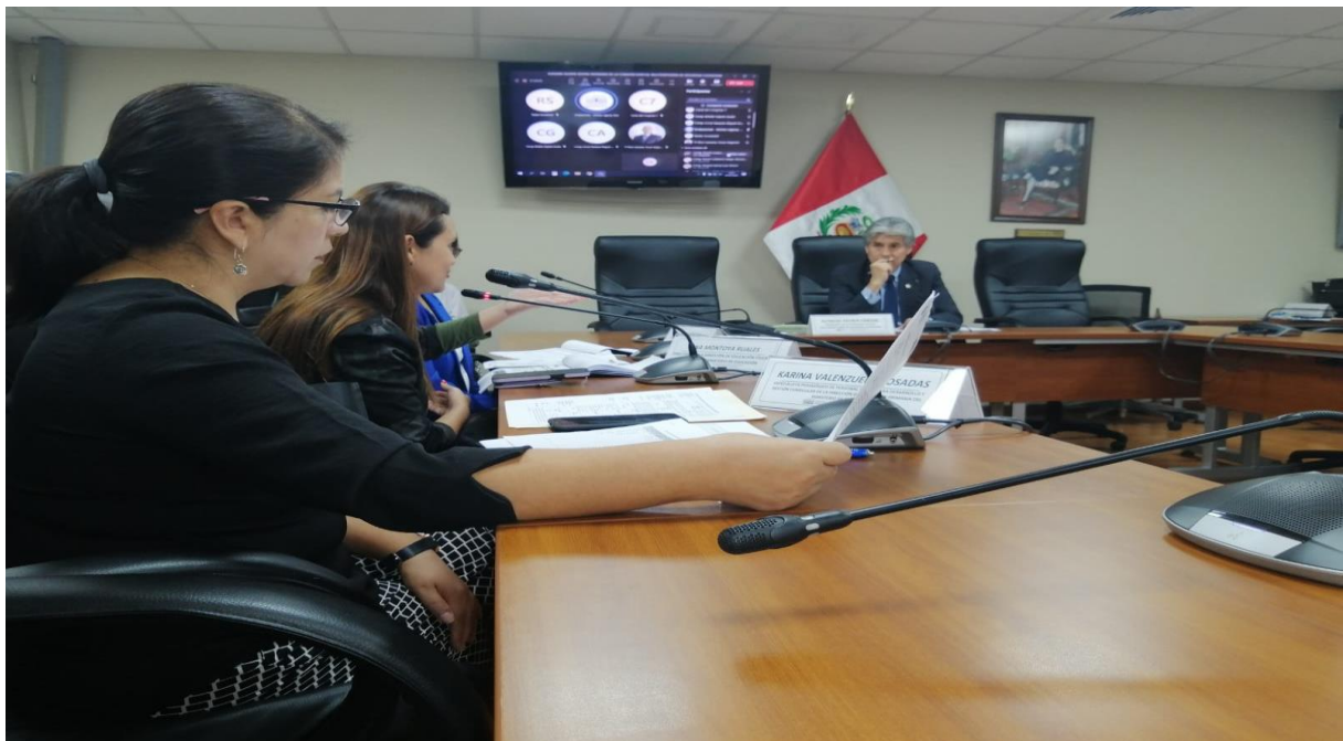
VIGÉSIMO QUINTA SESIÓN ORDINARIA (16.05.2023) FUNCIONARIOS DEL MINISTERIO DE EDUCACIÓN