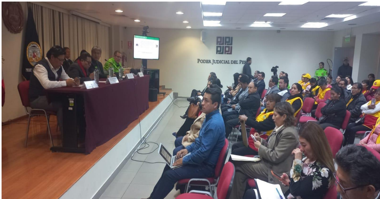
TERCERA SESIÓN EXTRAORDINARIA DESCENTRALIZADA (20.04.2023) HUANCAYO - JUNÍN