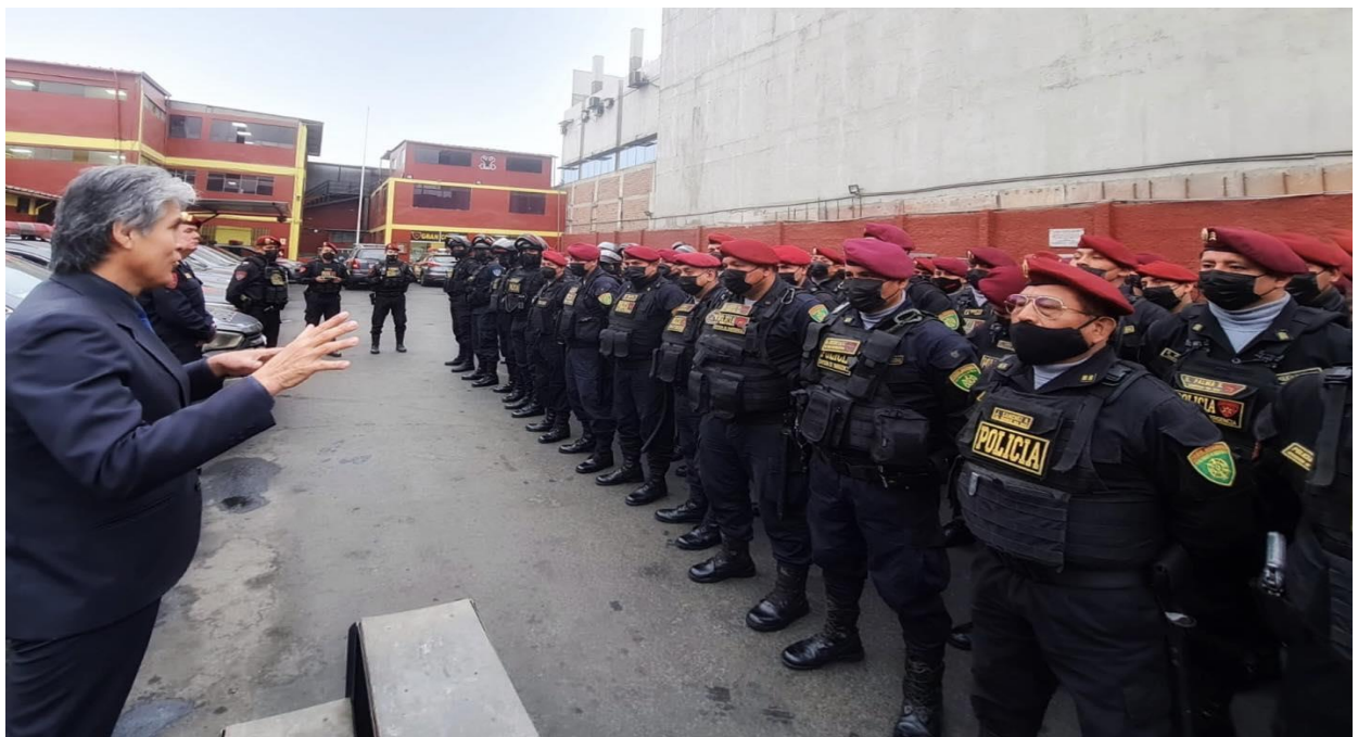
PERSONAL DEPARTAMENTO DE EMERGENCIA LIMA ESTE 1 (03.08.2022)