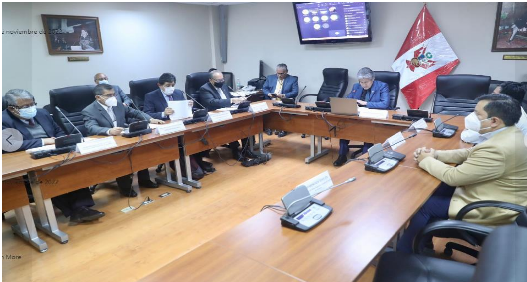
DÉCIMO TERCERA SESIÓN ORDINARIA (13.09.2022)

“Año de la unidad, la paz y el desarrollo”