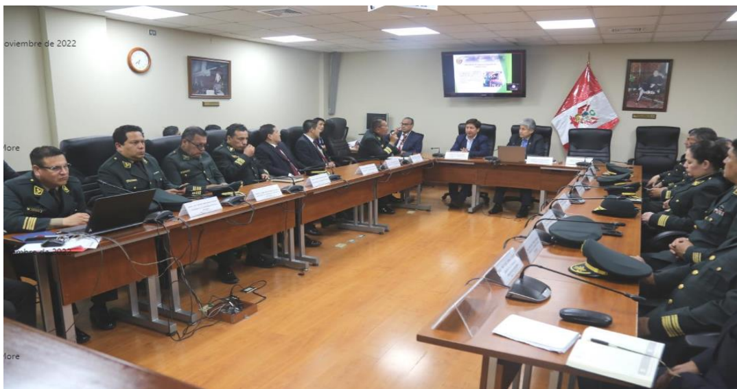
DÉCIMO NOVENA SESIÓN ORDINARIA (15.11.2022)