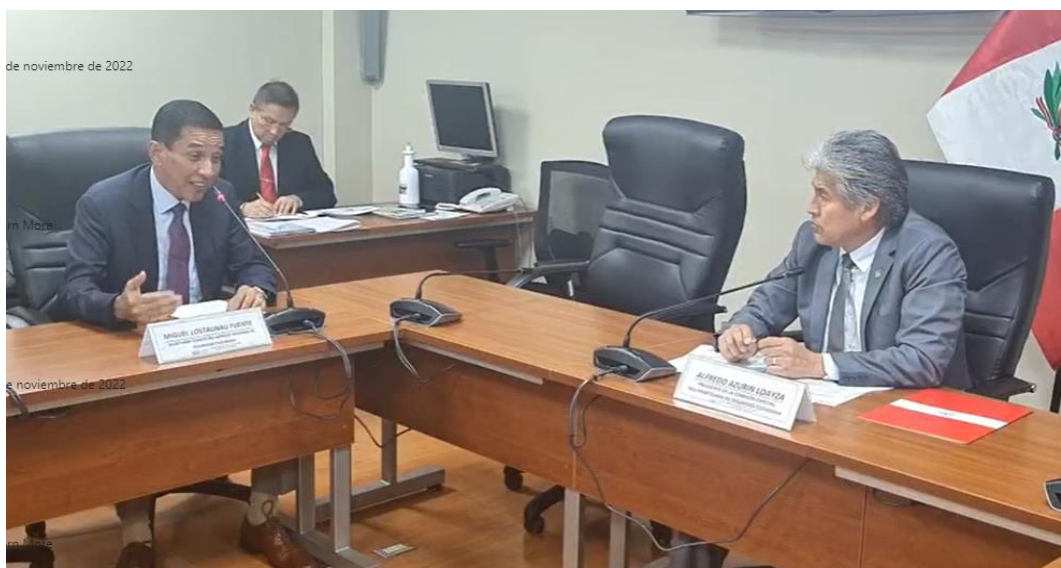
VIGÉSIMO PRIMERA SESIÓN ORDINARIA (07.03.2023)