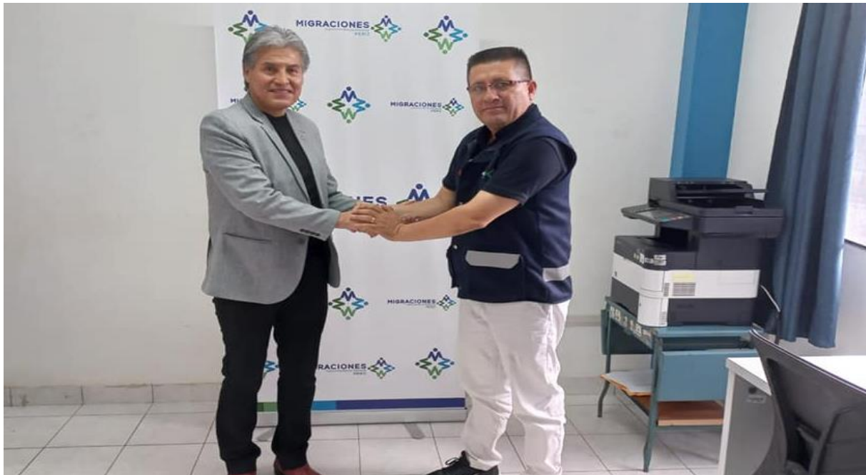
MIGRACIONES PUCALLPA (03.06.2023) UCAYALI

“Año de la unidad, la paz y el desarrollo”