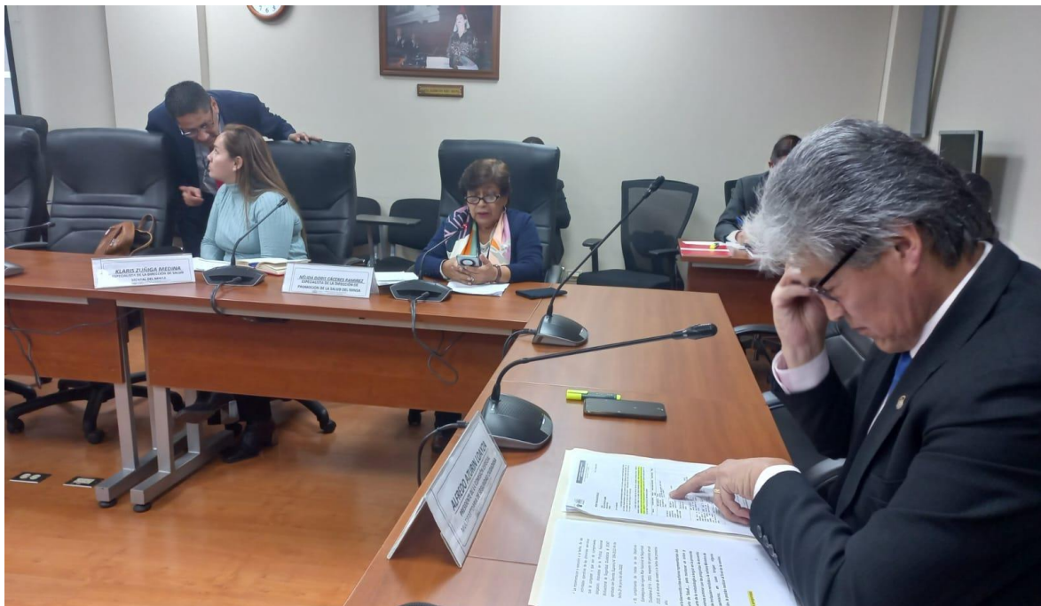
VIGÉSIMO SÉPTIMA SESIÓN ORDINARIA (13.06.2023) FUNCIONARIOS DEL MINISTERIO DE SALUD