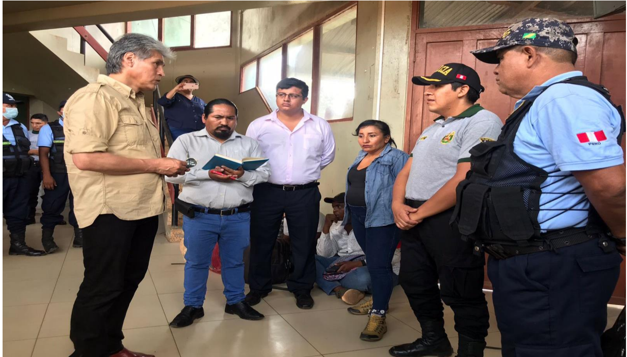
COMISARÍA DE IBERIA (25.09.2022) TAHUAMANU - MADRE DE DIOS

“Decenio de Igualdad de oportunidad para mujeres y hombres” “Año de la unidad, la paz y el desarrollo”