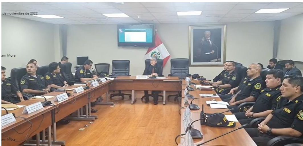
VIGÉSIMO SEGUNDA SESIÓN ORDINARIA (28.03.2023)

obligatorio, dispuestos en la “Política Nacional Multisectorial de Seguridad Ciudadana al 2030” aprobada con Decreto Supremo N° 006-2022-IN de fecha 21 de junio de 2022. Cumplimiento de metas de los Objetivos Estratégicos del vigente Plan Nacional de Seguridad Ciudadana 2019 – 2023; respecto del periodo anual 2022, y el avance de enero a la fecha. Cumplimiento de las actividades operativas y metas de las acciones y objetivos estratégicos como centro de costo de la Unidad Ejecutora de la VII Dirección Territorial de Policía – Lima, señalado en el Plan Operativo Institucional (POI) Anual 2023 del Ministerio del Interior; así como, el cumplimiento de las actividades operativas y metas de las acciones y objetivos estratégicos señalado en el Plan Operativo Institucional (POI) Multianual 2023 – 2025 de la Policía Nacional del Perú.