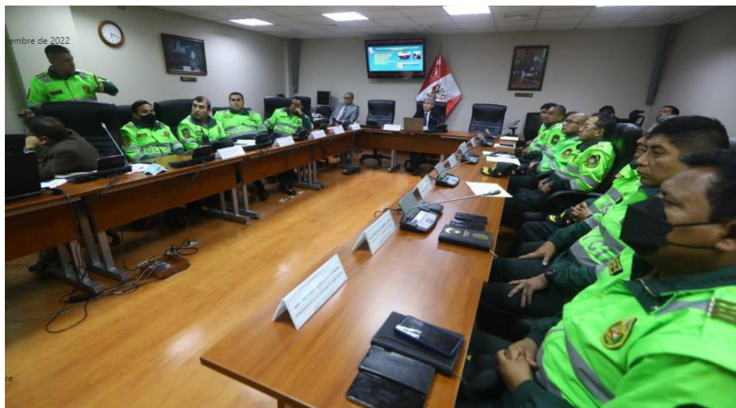
DÉCIMO CUARTA SESIÓN ORDINARIA (20.09.2022)