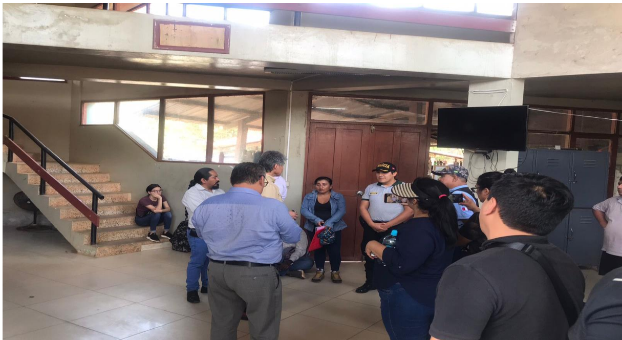
COMISARÍA DE IBERIA (25.09.2022) TAHUAMANU - MADRE DE DIOS