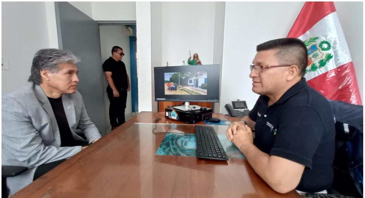
MIGRACIONES PUCALLPA (03.06.2023) UCAYALI