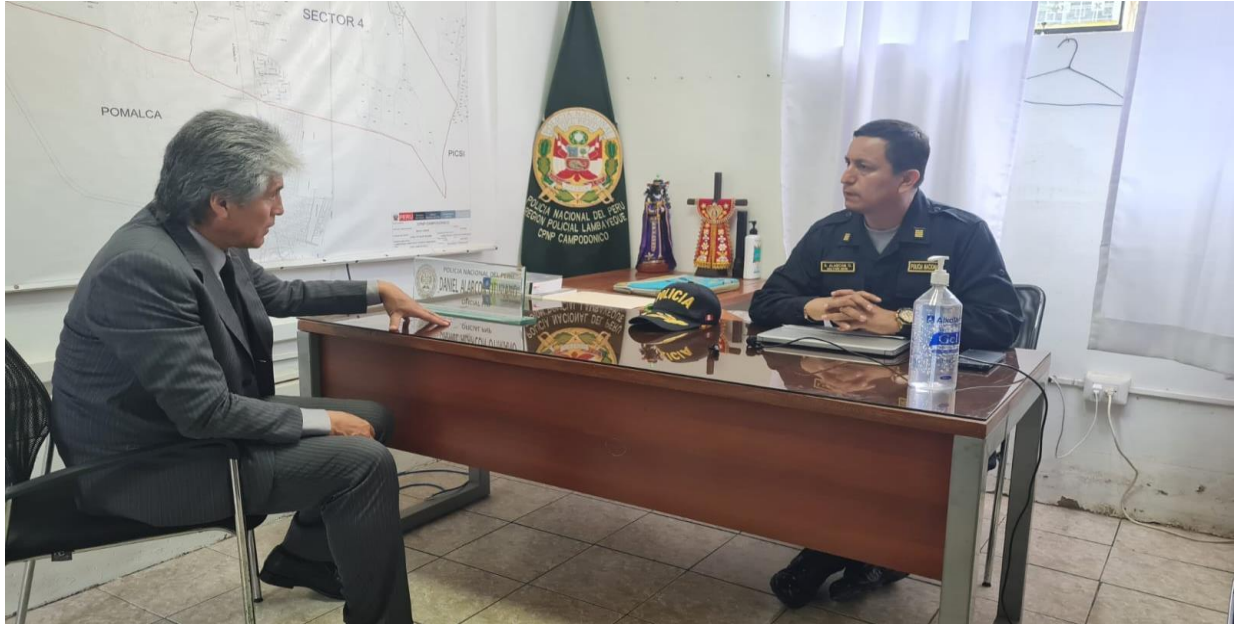
COMISARÍA CAMPODÓNICO (23.02. 2023) CHICLAYO

“Decenio de Igualdad de oportunidad para mujeres y hombres” “Año de la unidad, la paz y el desarrollo”