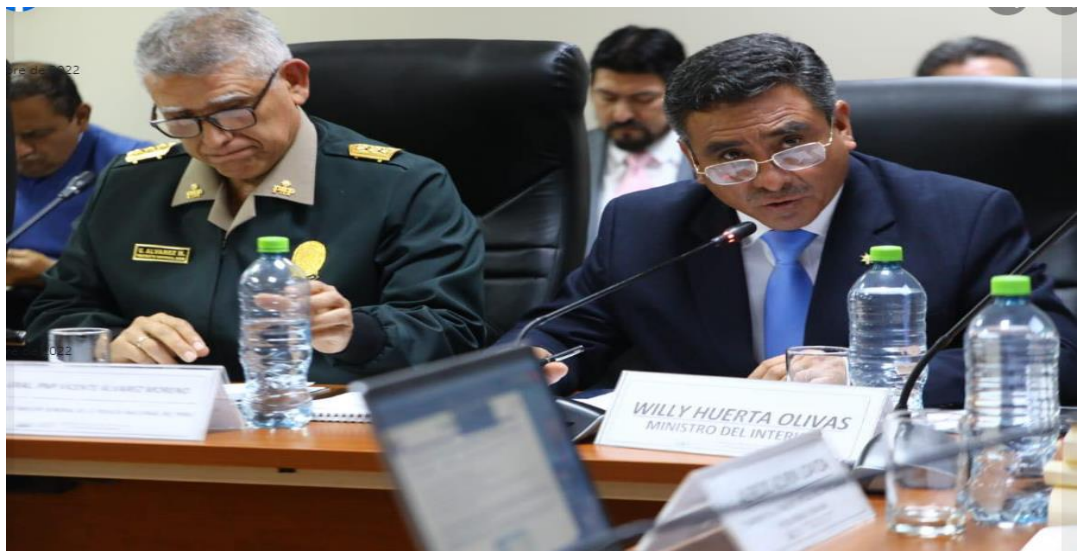
DÉCIMO SÉPTIMA SESIÓN ORDINARIA (18.10.2022)