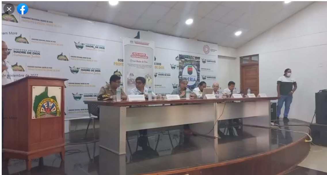
SEXTA SESIÓN DESCENTRALIZADA (27.09.2022) IBERIA – TAHUAMANU MADRE DE DIOS