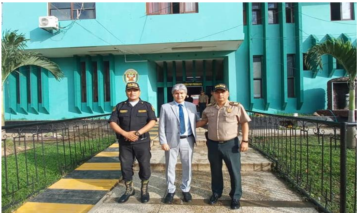
DIVISIÓN DE ORDEN PÚBLICO Y SEGURIDAD (DIVOPUS) (31.05.2023) PUCALLPA - UCAYALI