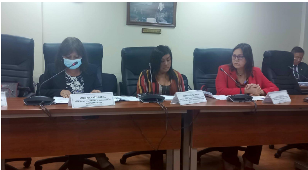
VIGÉSIMO CUARTA SESIÓN ORDINARIA (09.05.2023)