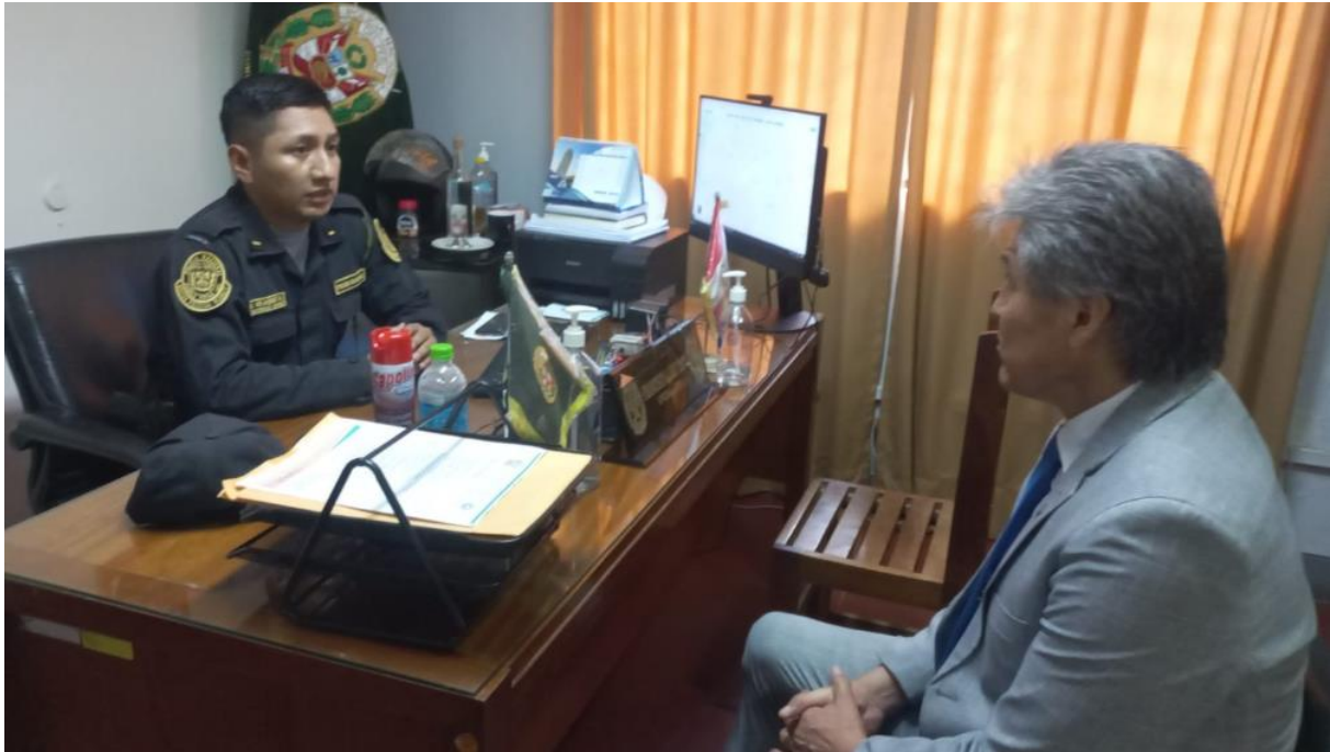
COMISARÍA DE YARINACocha (31.05.2023) UCAyALI

“Decenio de Igualdad de oportunidad para mujeres y hombres” “Año de la unidad, la paz y el desarrollo”