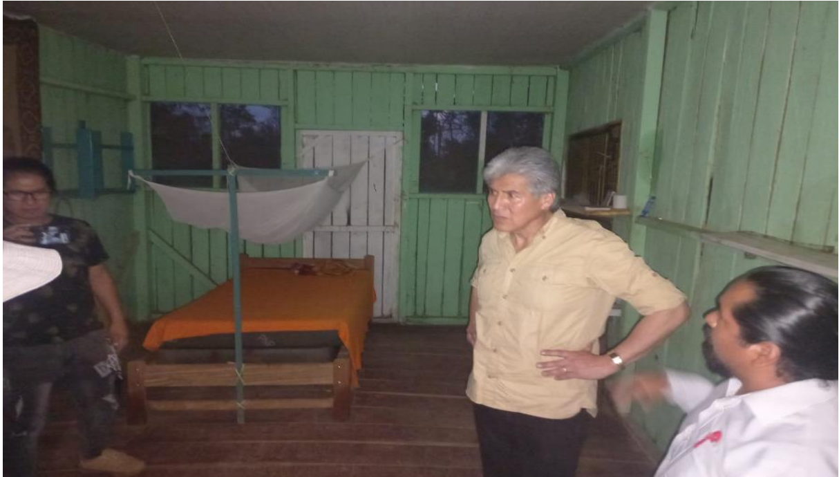
PUESTO DE SEGURIDAD DE FRONTERA UNIÓN (25.09.2022) MADRE DE DIOS

“Decenio de Igualdad de oportunidad para mujeres y hombres” “Año de la unidad, la paz y el desarrollo”