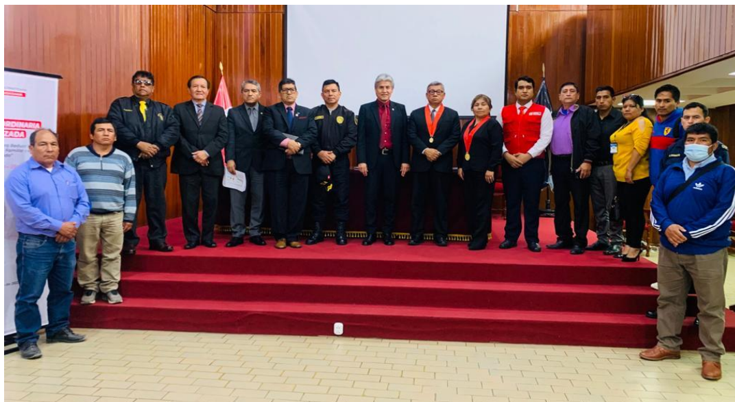
VIGÉSIMA SESIÓN ORDINARIA DESCENTRALIZADA (22.11.2022)