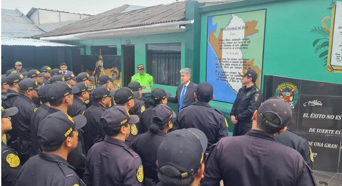
USE PNP HUANCAYO (23.04.2023)