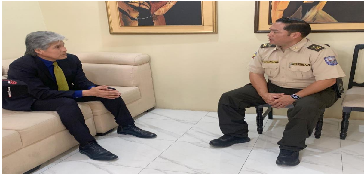
JEFE DEL COMANDO POLICIAL DE HUAQUILLAS – ECUADOR (31. 10.2022)

“Decenio de Igualdad de oportunidad para mujeres y hombres” “Año de la unidad, la paz y el desarrollo”