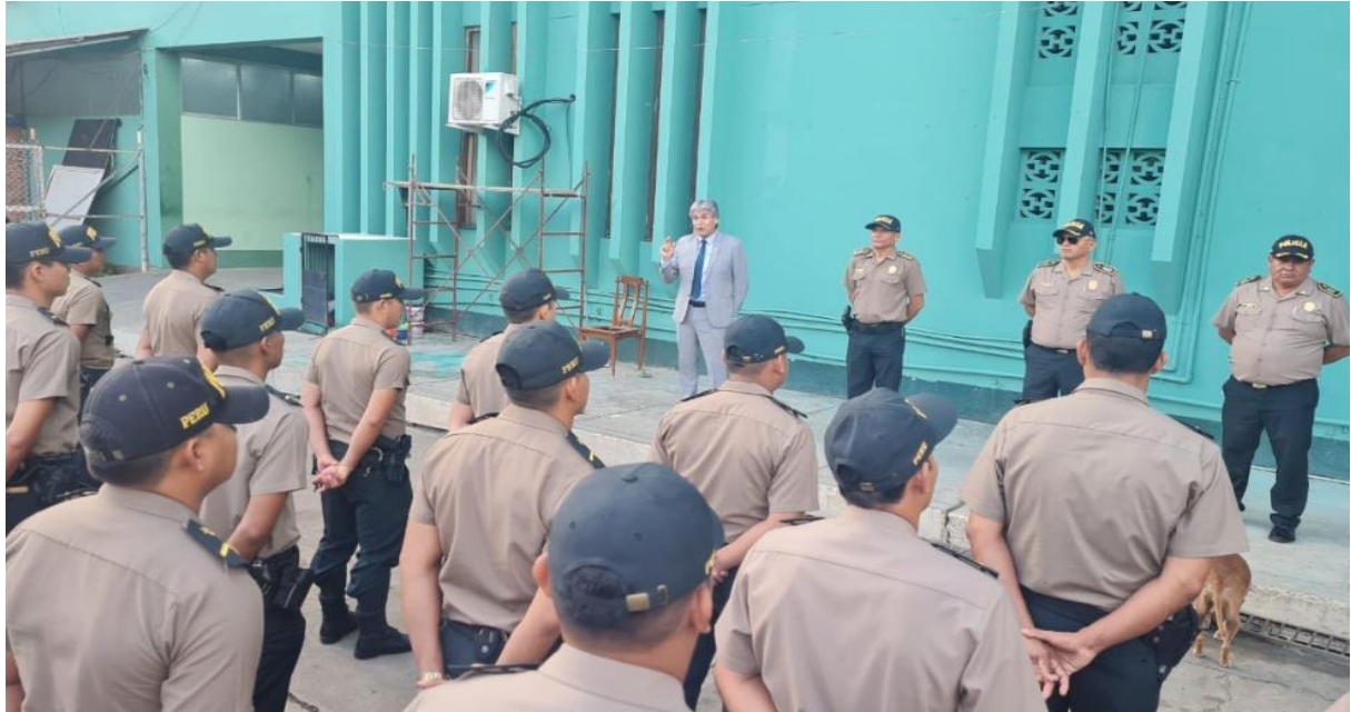
DIVISIÓN DE ORDEN PÚBLICO Y SEGURIDAD (DIVOPUS) (31.05.2023) PUCALLPA – UCAYALI

“Decenio de Igualdad de oportunidad para mujeres y hombres” “Año de la unidad, la paz y el desarrollo”