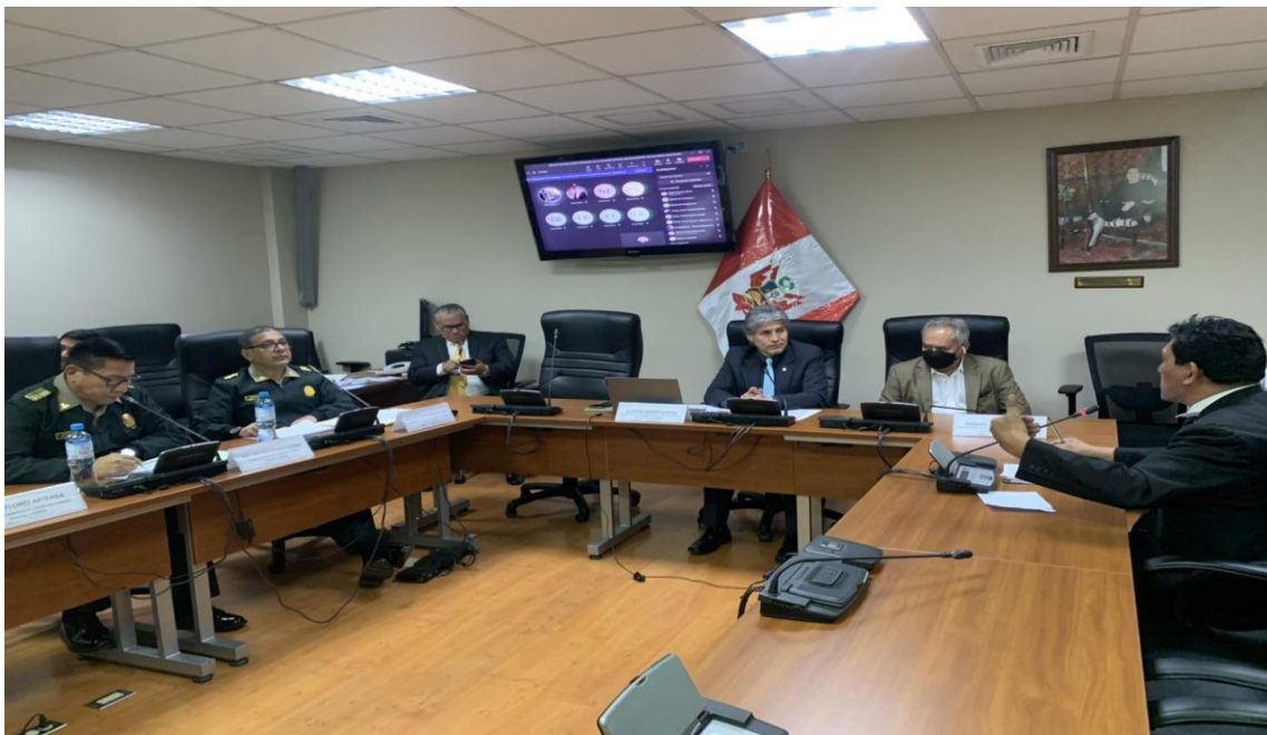
DÉCIMO SEGUNDA SESIÓN ORDINARIA (06.09.2022) FUNCIONARIOS DE FOVIPOL