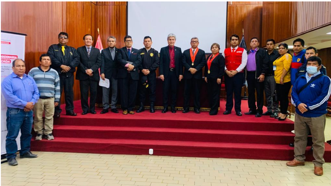
VIGÉSIMO SESIÓN ORDINARIA DESCENTRALIZADA (22.11.2022) HUACHO - HUAURA