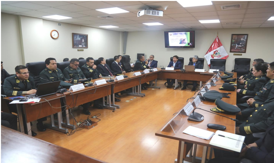
DÉCIMO NOVENA SESIÓN ORDINARIA (15.11.2022) DIVPOL SUR 2

“Decenio de Igualdad de oportunidad para mujeres y hombres” “Año de la unidad, la paz y el desarrollo”