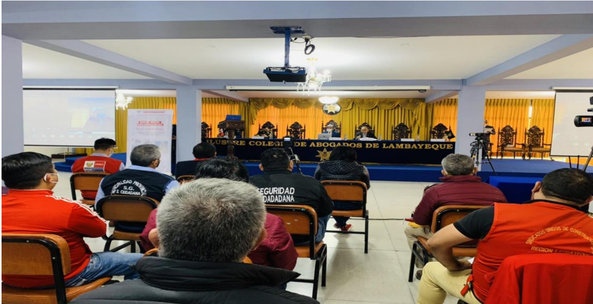
QUINTA SESIÓN DESCENTRALIZADA (25.08.2022) CHICLAYO- LAMBAYEQUE (SESIÓN INFORMATIVA)