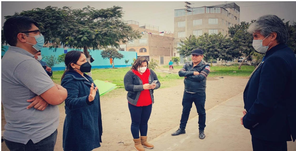
VECINOS AA.HH. “LOS CHASQUIS” SAN MARTIN DE PORRES (16.08.2022)