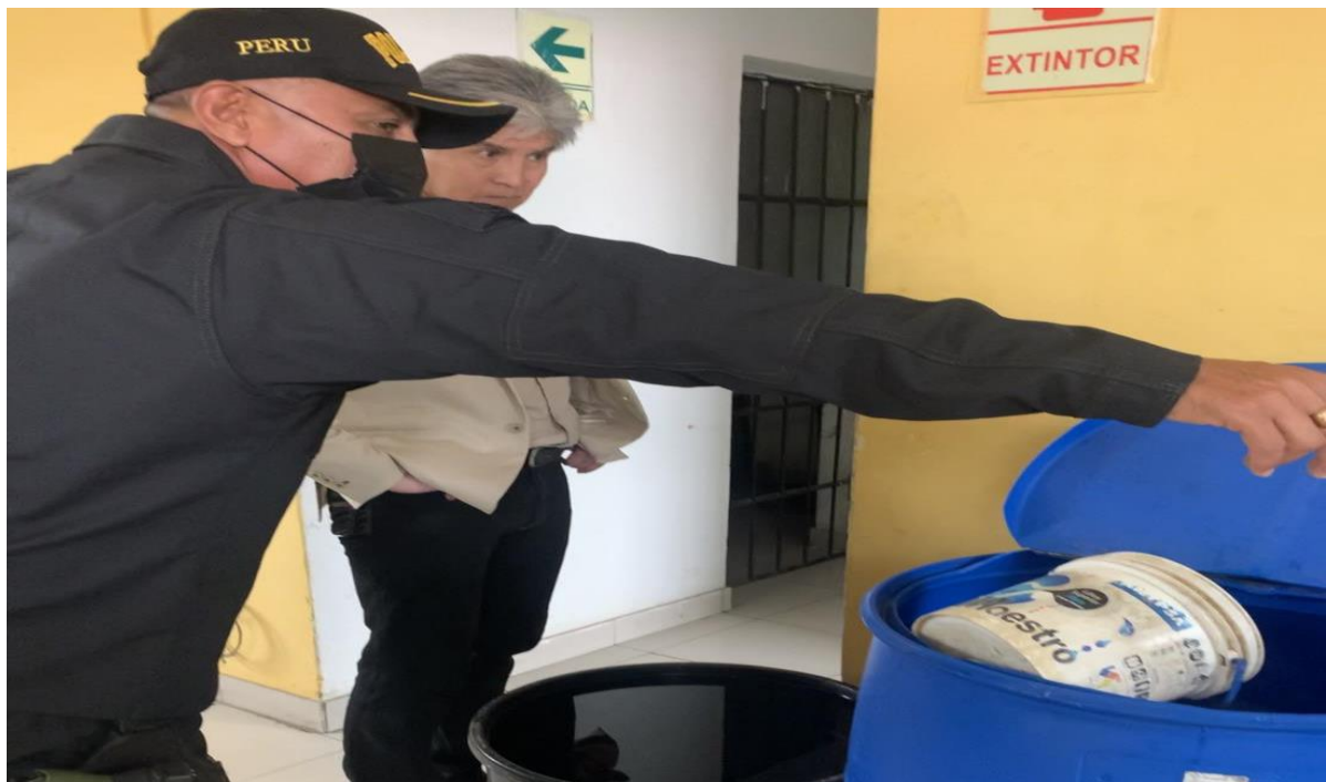
PUESTO DE VIGILANCIA AGUAS VERDES (26 .10. 2022) TUMBES