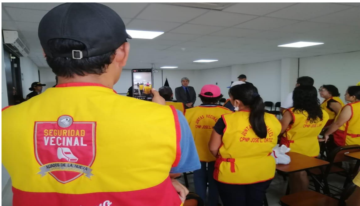
JUNTAS VECINALES (22.02.2023) DISTRITO JOSÉ LEONARDO ORTIZ – CHICLAYO