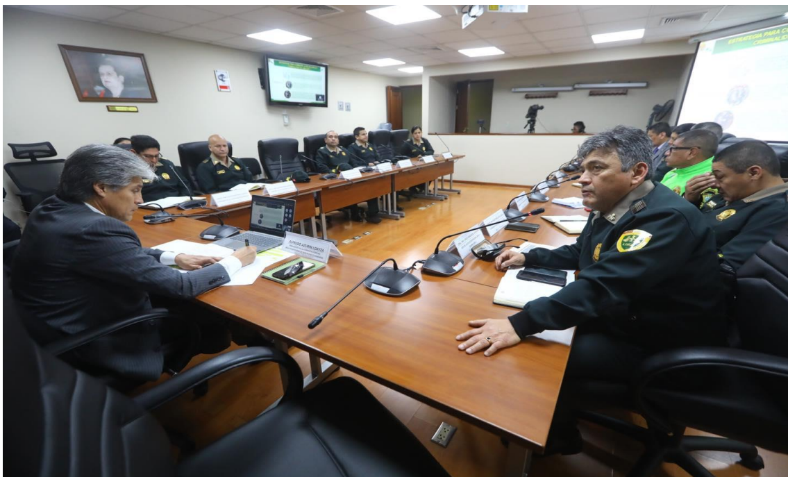
DÉCIMO OCTAVA SESIÓN ORDINARIA (08.11.2022) DIVPOL SUR 1