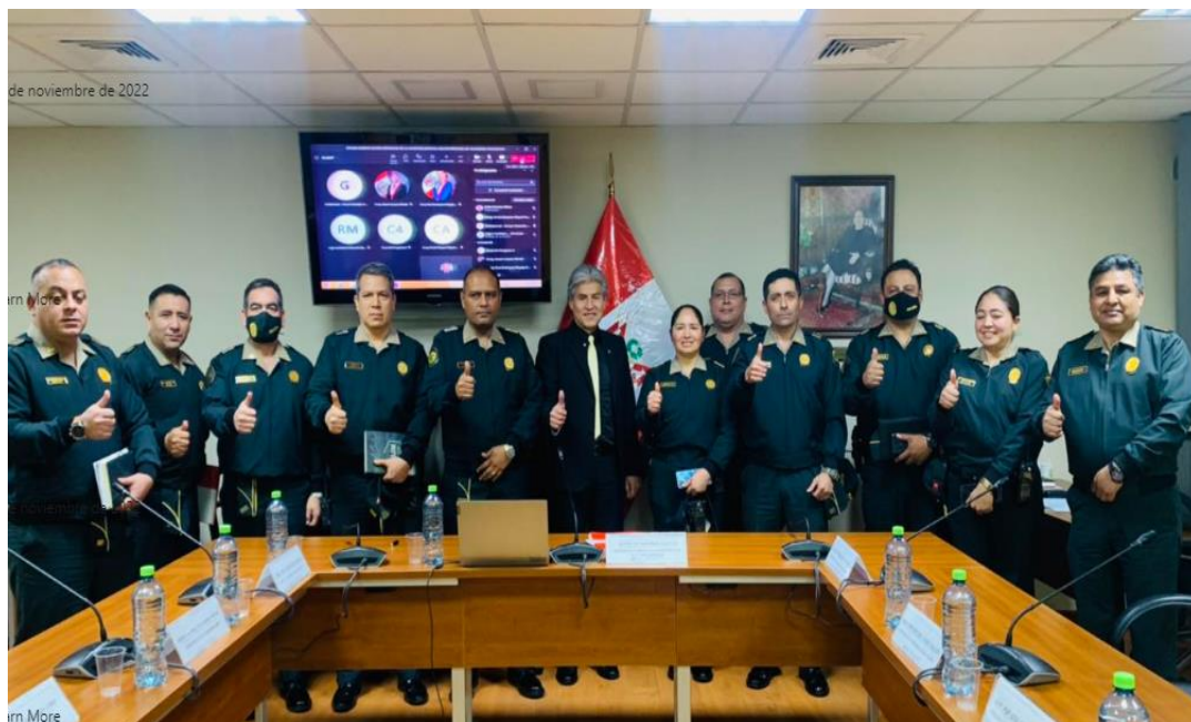
DÉCIMO QUINTA SESIÓN ORDINARIA (04.10.2022)

“Año de la unidad, la paz y el desarrollo”