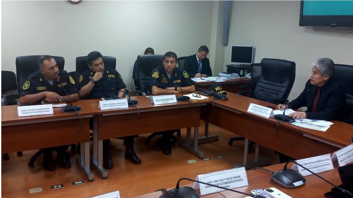
VIGÉSIMO SEGUNDA SESIÓN ORDINARIA (28.03.2023) PRESENTACIÓN DEL JEFE DE DIVPOL SUR 3

“Decenio de Igualdad de oportunidad para mujeres y hombres” “Año de la unidad, la paz y el desarrollo”