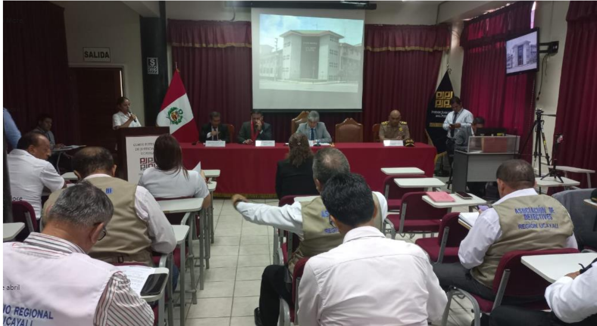
CUARTA SESIÓN EXTRAORDINARIA DESCENTRALIZADA (01.06.2023) PUCALLPA - UCAYALI

“Decenio de Igualdad de oportunidad para mujeres y hombres” “Año de la unidad, la paz y el desarrollo”