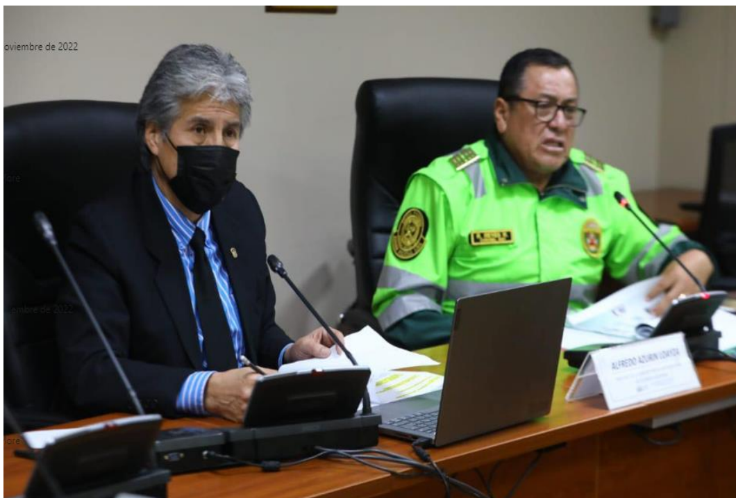
DÉCIMO PRIMERA SESIÓN ORDINARIA (09.08.2022)

“Año de la unidad, la paz y el desarrollo”