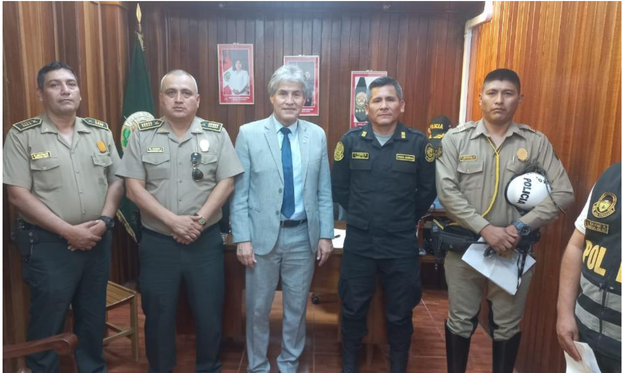
COMISARÍA DE PUCALLPA (31.05.2023)

“Decenio de Igualdad de oportunidad para mujeres y hombres” “Año de la unidad, la paz y el desarrollo”