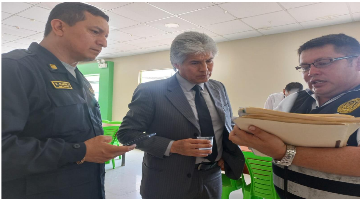
COMISARÍA CAMPODÓNICO (23.02. 2023) CHICLAYO