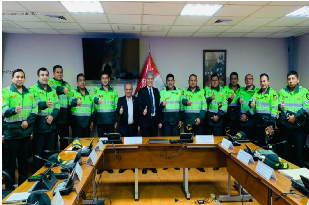
DÉCIMO CUARTA SESIÓN ORDINARIA (20.09.2022)

coordinación que efectúan las Juntas Vecinales de la zona. Nivel de participación en los Comités Distritales de Seguridad Ciudadana – CODISEC y a la vez, informar, qué acciones se vienen articulando y si han detectado algunas deficiencias que puedan ser mejoradas para el buen desarrollo del mencionado Comité.