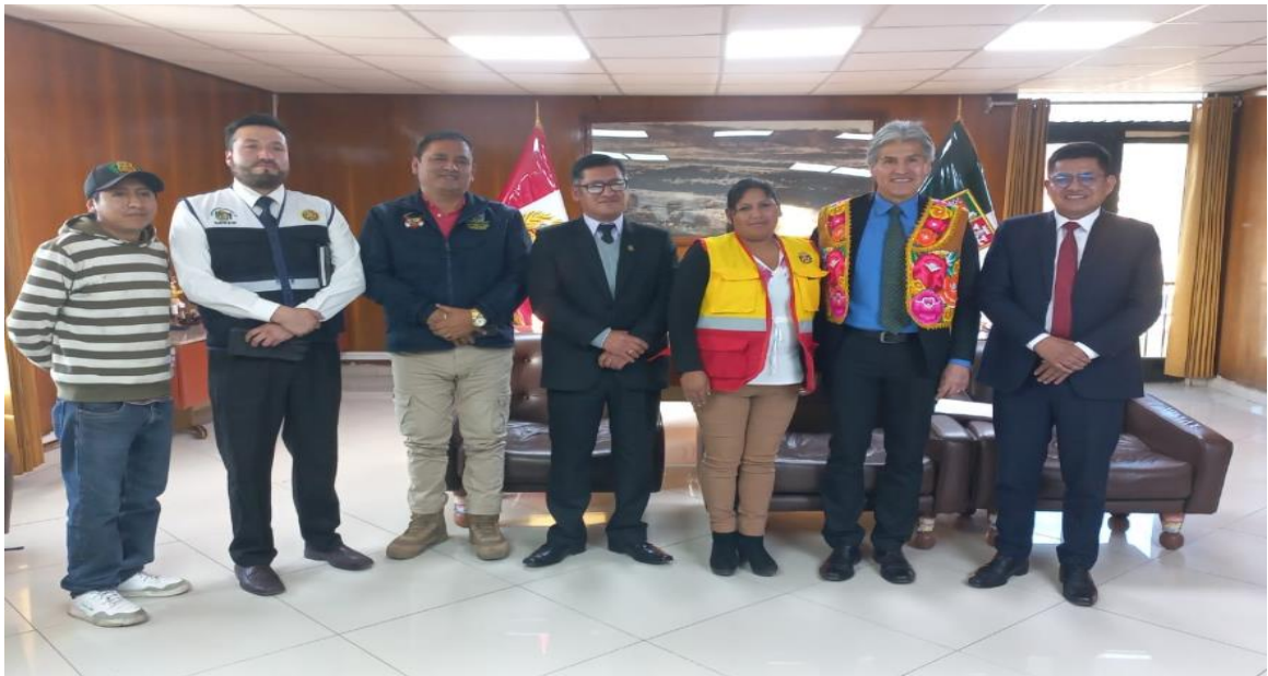
MUNICIPALIDAD PROVINCIAL DE HUANCAYO 24.04.2023