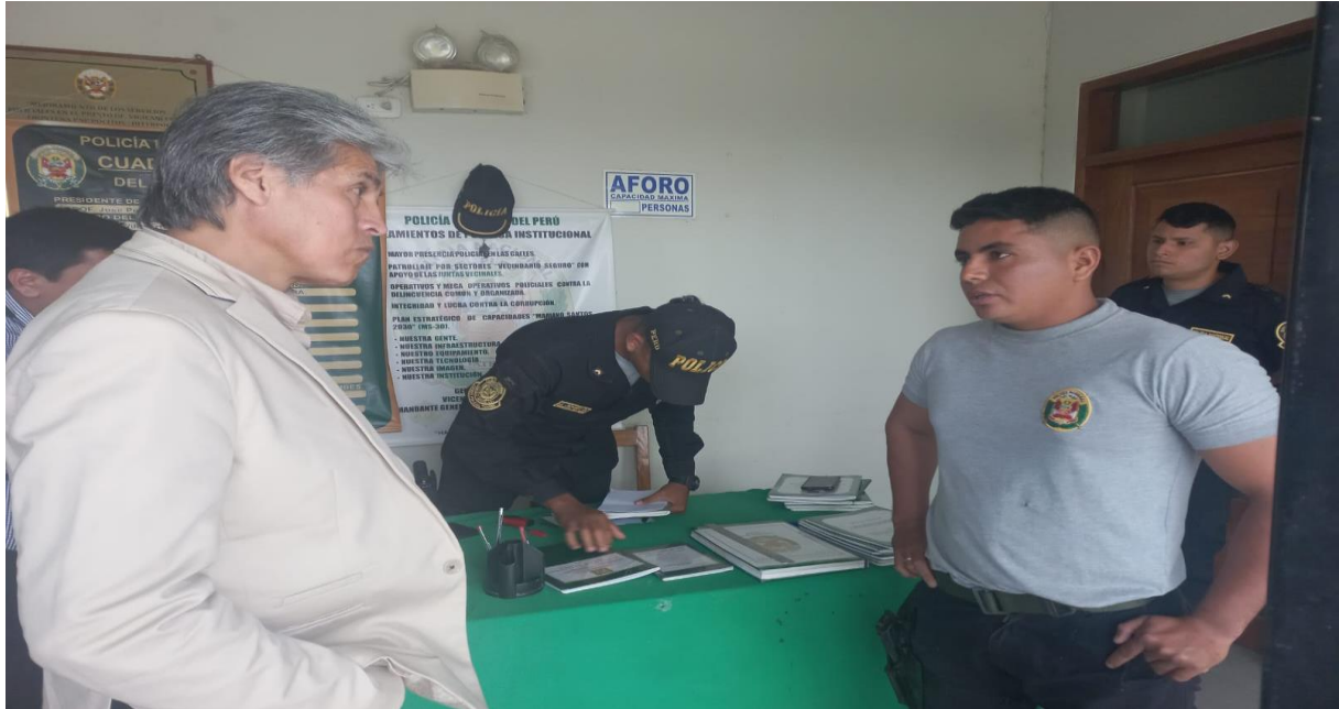
PUESTO DE VIGILANCIA POCITOS (26.10.2022) TUMBES

“Decenio de Igualdad de oportunidad para mujeres y hombres” “Año de la unidad, la paz y el desarrollo”