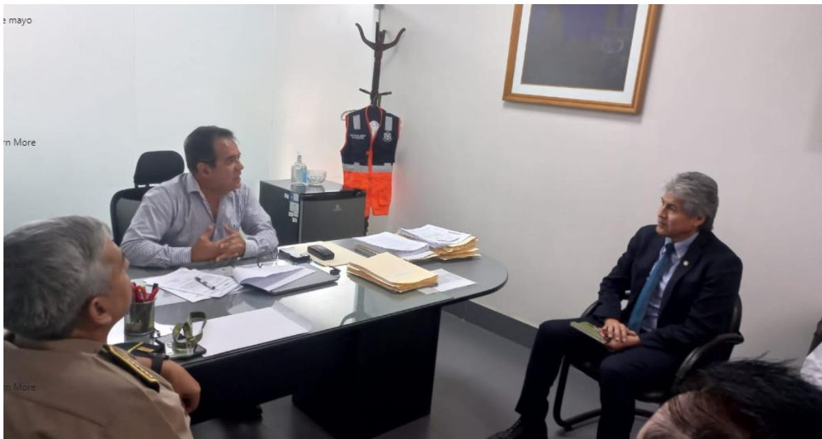
MUNICIPALIDAD DE SAN ISIDRO (24.05.2023)