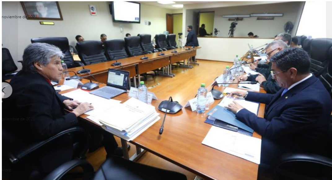
DÉCIMO SÉPTIMA SESIÓN ORDINARIA (18.10.2022)

equipos de comunicaciones, unidades vehiculares y motorizadas, así como la falta de personal. Acciones que se van a realizar para mejorar el control migratorio, a fin de combatir la trata de personas y el tráfico ilícito de drogas. Acciones que se van a implementar para cerrar y vigilar los pasos fronterizos no habilitados. Funcionamiento del sistema integrado de requisitorias que se viene usando en los puestos fronterizos. Asimismo, informar, qué mejoras se han realizado para la utilización de la geolocalización, y sobre las coordinaciones y el nivel de colaboración de los operadores de servicio de telefonía.