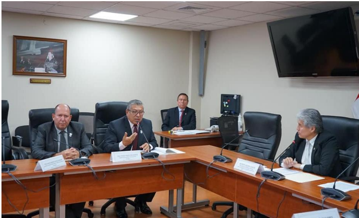
MINEDU, SUCAMEC Y UGEL 5 (14.07.2023)

“Decenio de Igualdad de oportunidad para mujeres y hombres” “Año de la unidad, la paz y el desarrollo”