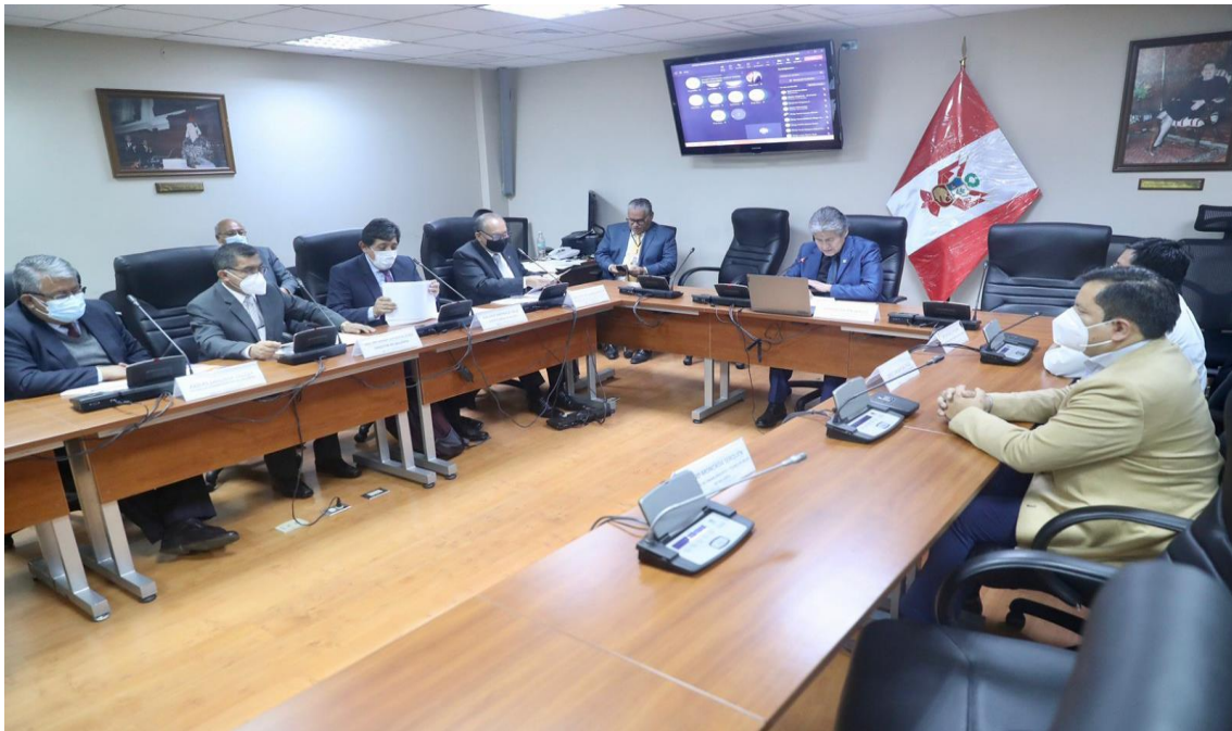
DÉCIMO TERCERA SESIÓN ORDINARIA (13.09.2022) FUNCIONARIOS DE SALUDPOL

“Decenio de Igualdad de oportunidad para mujeres y hombres” “Año de la unidad, la paz y el desarrollo”