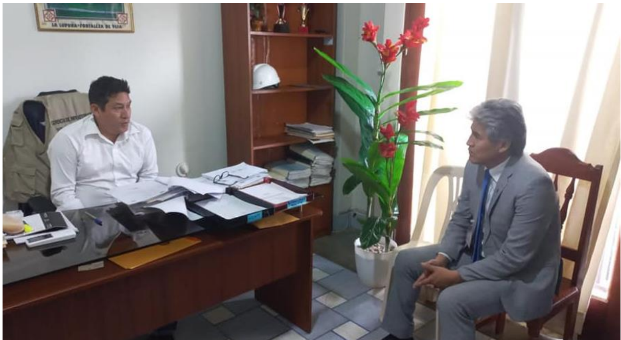
MUNICIPALIDAD DE YARINACocha (31.05.2023) UCAYALI