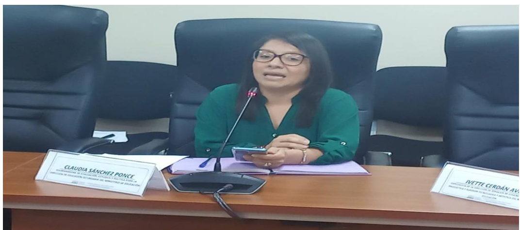
VIGÉSIMO QUINTA SESIÓN ORDINARIA (16.05.2023)