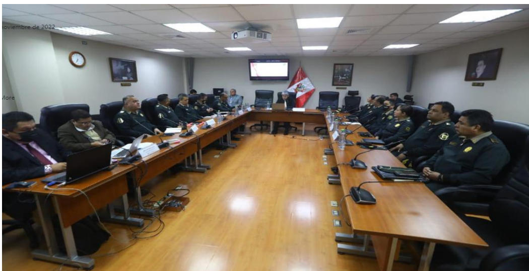
DÉCIMO QUINTA SESIÓN ORDINARIA (04.10.2022)