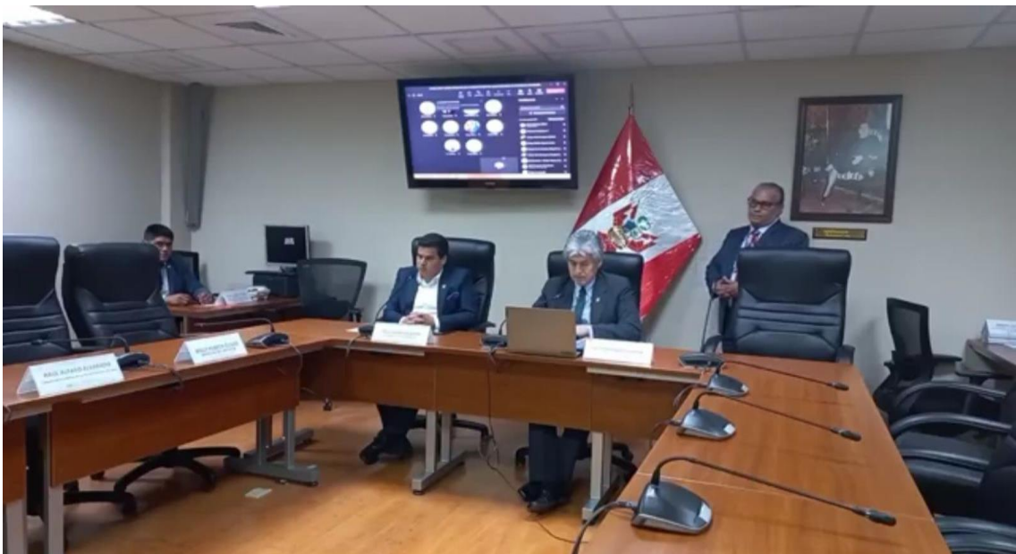
DÉCIMO SEXTA SESIÓN ORDINARIA (11.10.2022)