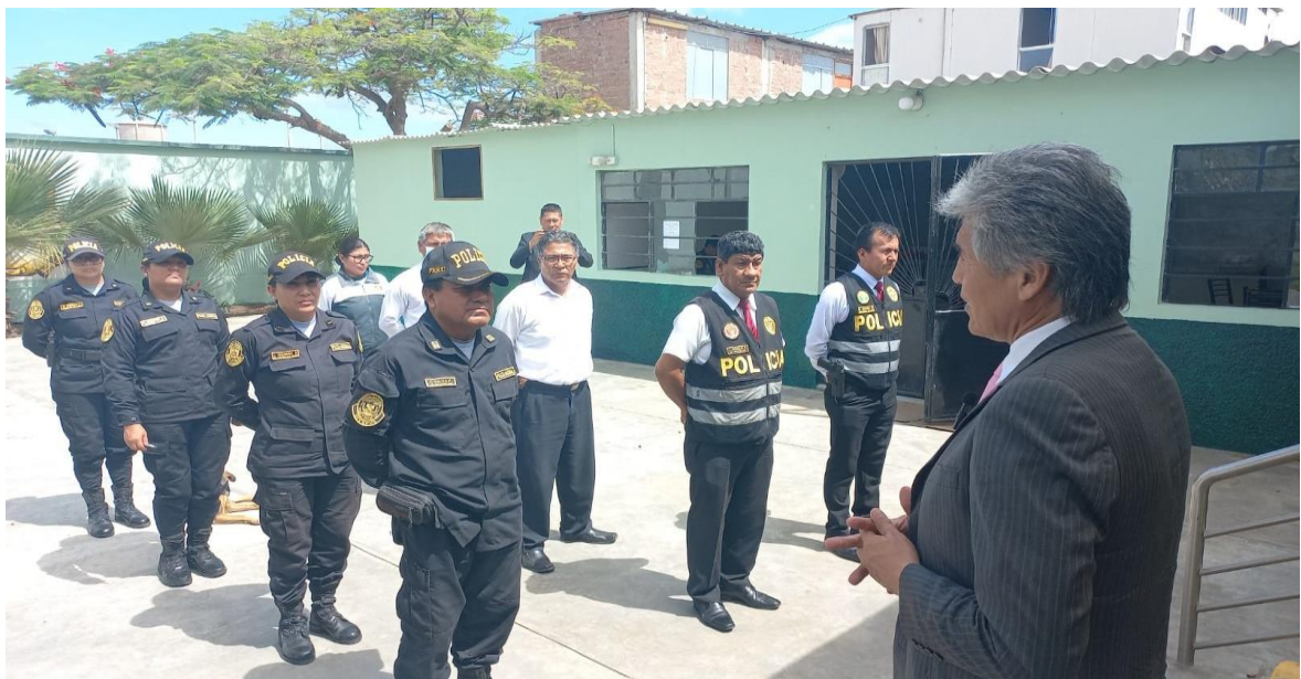
COMISARÍA DE FERREÑAFE (23.02.2023) REGIÓN LAMBAYEQUE