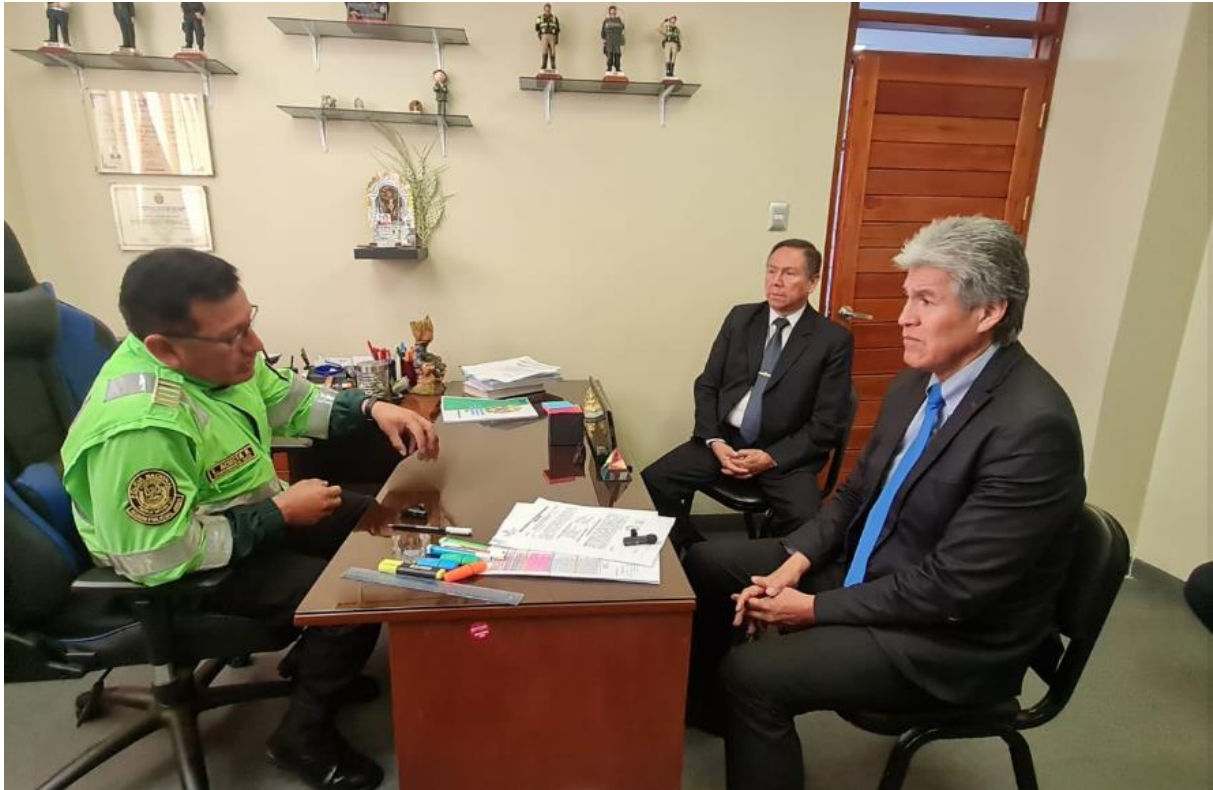
COMISARÍA EL TAMBO (24.04.2023)

“Decenio de Igualdad de oportunidad para mujeres y hombres” “Año de la unidad, la paz y el desarrollo”