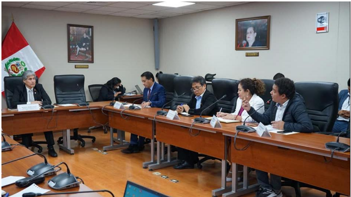
MINEDU, SUCAMEC Y UGEL 5 (14.07.2023)