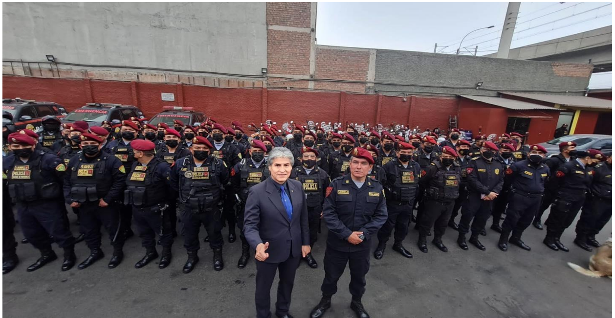
PERSONAL DEPARTAMENTO DE EMERGENCIA LIMA ESTE 1 (03.08.2022)

“Decenio de Igualdad de oportunidad para mujeres y hombres” “Año de la unidad, la paz y el desarrollo”