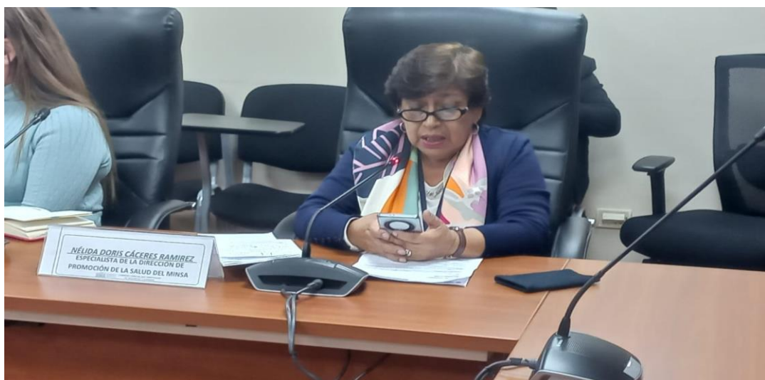
VIGÉSIMO SÉPTIMA SESIÓN ORDINARIA (13.06.2023)