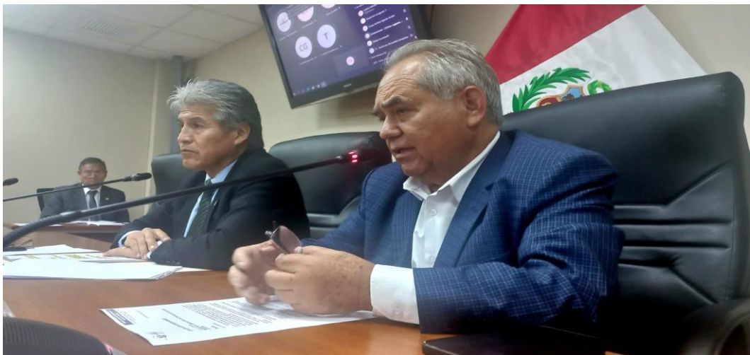
VIGÉSIMO CUARTA SESIÓN ORDINARIA (09.05.2023)