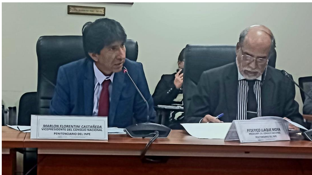
VIGÉSIMO SEXTA SESIÓN ORDINARIA (23.05.2023)