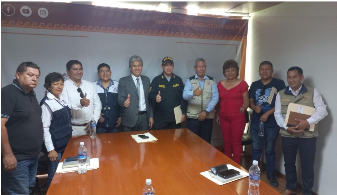
AUDIENCIA DESCENTRALIZADA (24.02.2023) REGIÓN LAMBAYEQUE