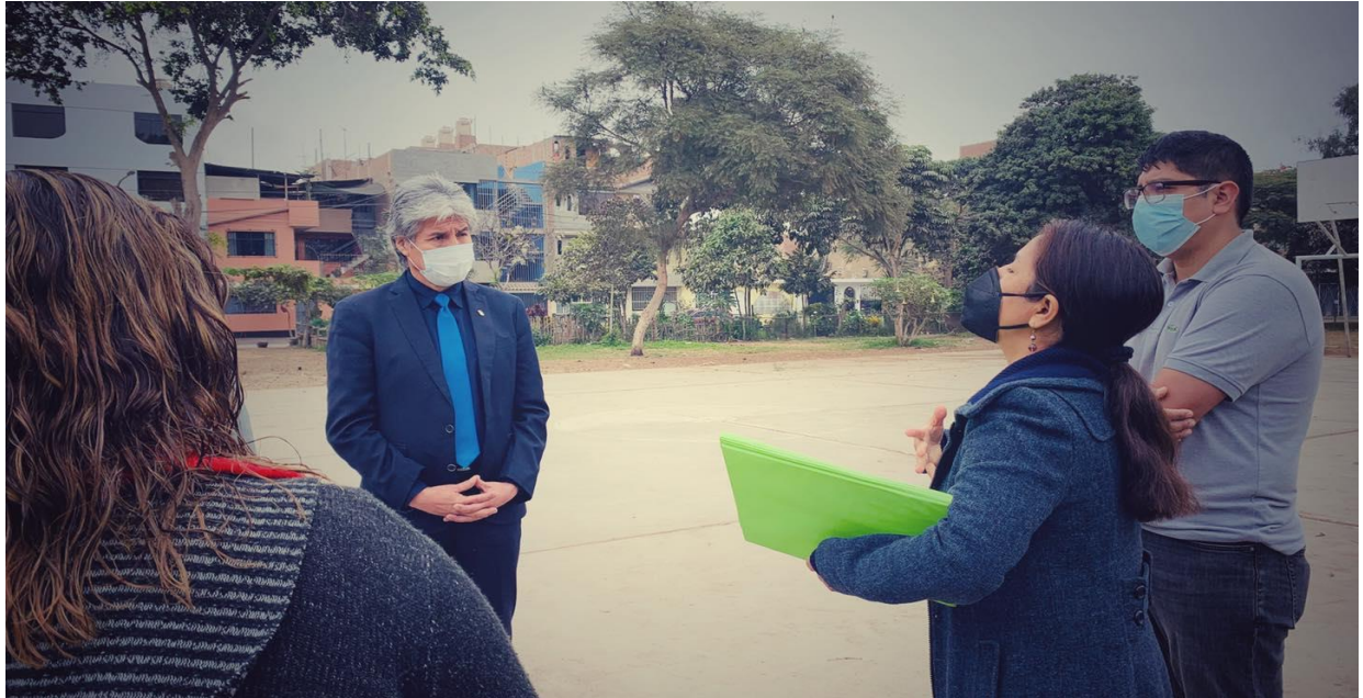
VECINOS AA.HH. “LOS CHASQUIS” SAN MARTIN DE PORRES (16.08.2022)

“Decenio de Igualdad de oportunidad para mujeres y hombres” “Año de la unidad, la paz y el desarrollo”