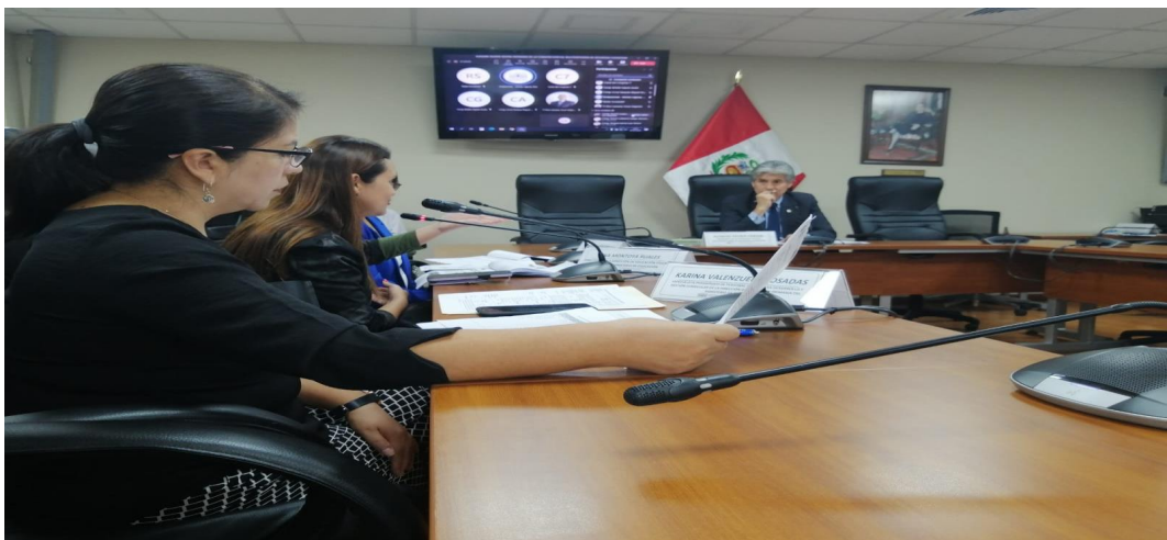
VIGÉSIMO QUINTA SESIÓN ORDINARIA (16.05.2023)