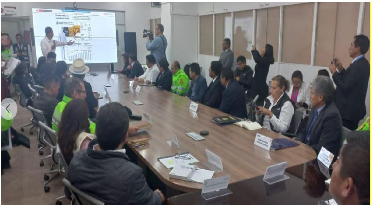
PARTICIPACIÓN EN REUNIÓN DE INTEGRACIÓN (23.04.2023)