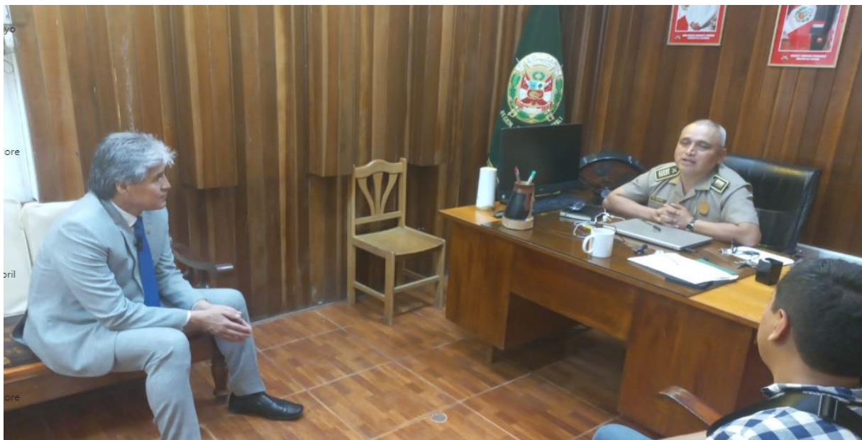
COMISARÍA DE PUCALLPA (31.05.2023)