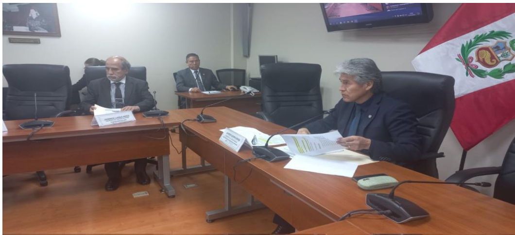
VIGÉSIMO SEXTA SESIÓN ORDINARIA (23.05.2023)