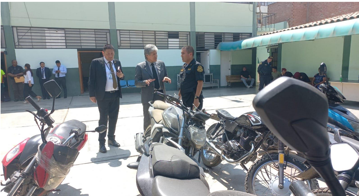
COMISARÍA CÉSAR LLATA (23.02.2023) CHICLAYO