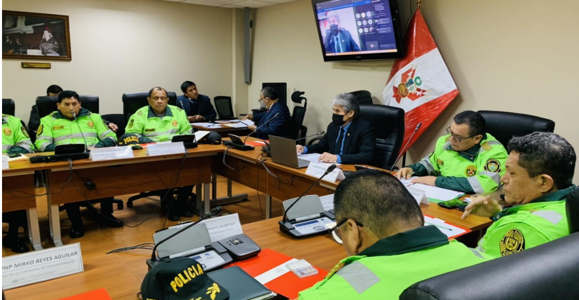
DÉCIMO PRIMERA SESIÓN ORDINARIA (09.08.2022) DIVPOL NORTE 2