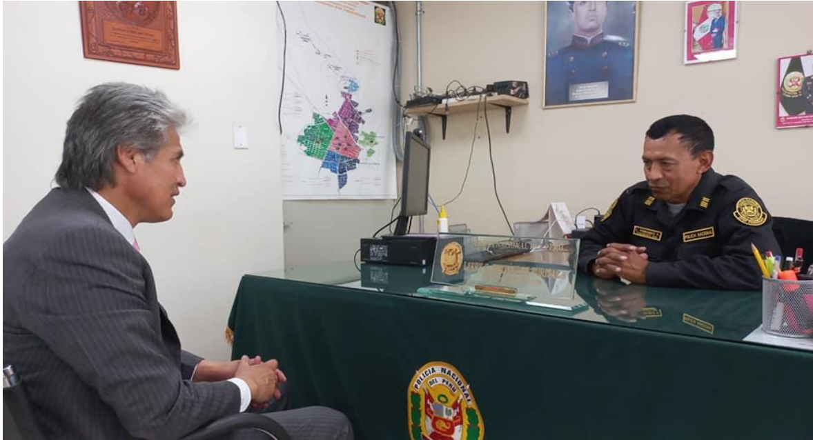
COMISARÍA DE FERREÑAFE (23.02.2023) REGIÓN LAMBAYEQUE

“Decenio de Igualdad de oportunidad para mujeres y hombres” “Año de la unidad, la paz y el desarrollo”