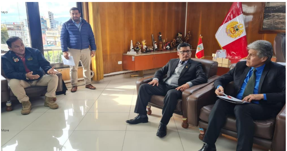
MUNICIPALIDAD PROVINCIAL DE HUANCAYO (24.04.2023)