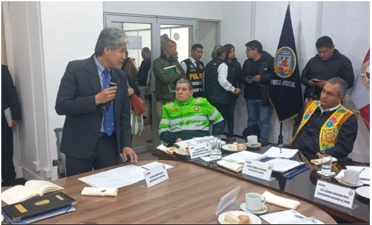
PARTICIPACIÓN EN REUNIÓN DE INTEGRACIÓN (23.04.2023)

“Decenio de Igualdad de oportunidad para mujeres y hombres” “Año de la unidad, la paz y el desarrollo”