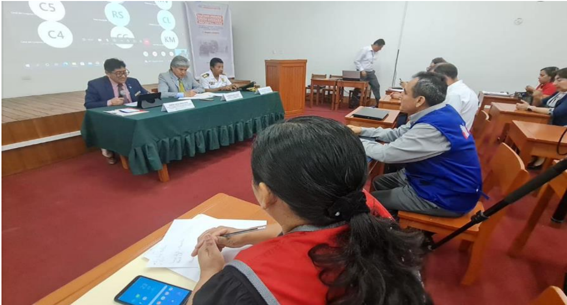
VIGÉSIMO PRIMERA SESIÓN ORDINARIA DESCENTRALIZADA (06.12.2022) IQUITOS - LORETO (SESIÓN INFORMATIVA)

“Decenio de Igualdad de oportunidad para mujeres y hombres” “Año de la unidad, la paz y el desarrollo”