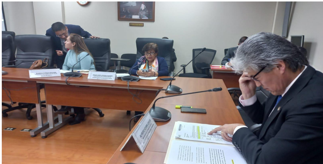
VIGÉSIMO SÉPTIMA SESIÓN ORDINARIA (13.06.2023)