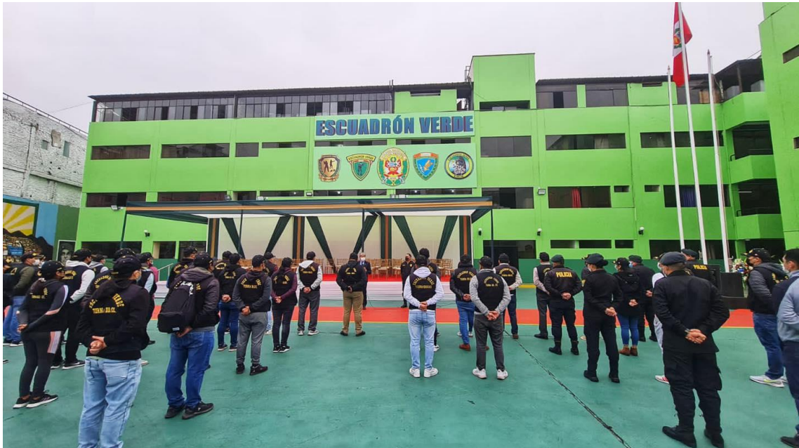
UNIDAD ESCUADRÓN VERDE PNP (19.08.2022)

“Decenio de Igualdad de oportunidad para mujeres y hombres” “Año de la unidad, la paz y el desarrollo”