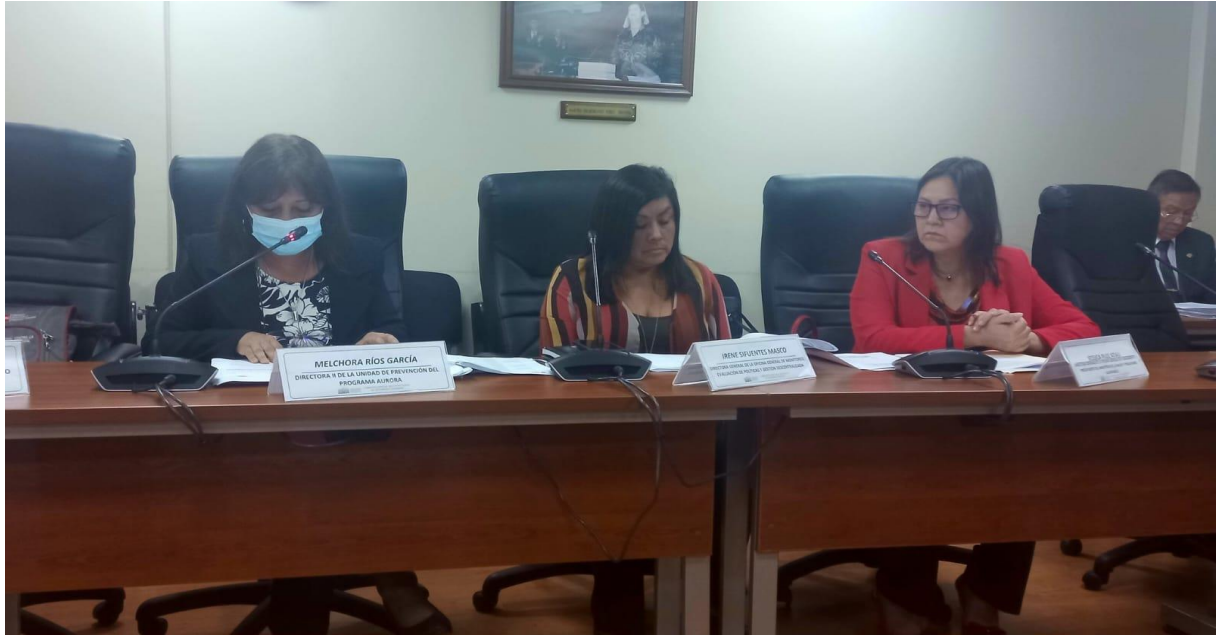
VIGÉSIMO CUARTA SESIÓN ORDINARIA (09.05.2023) FUNCIONARIOS DEL MINISTERIO DE LA MUJER Y POBLACIONES VULNERABLES

“Decenio de Igualdad de oportunidad para mujeres y hombres” “Año de la unidad, la paz y el desarrollo”