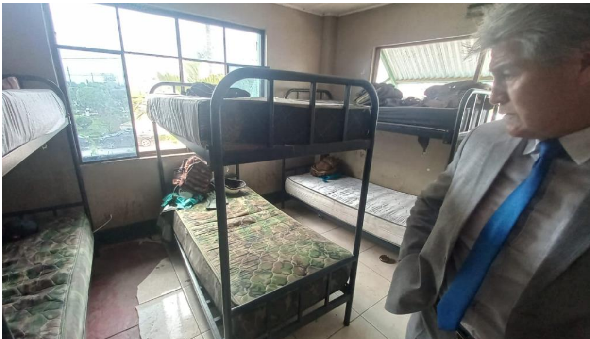
COMISARÍA DE YARINACocha (31.05.2023) UCAyALI