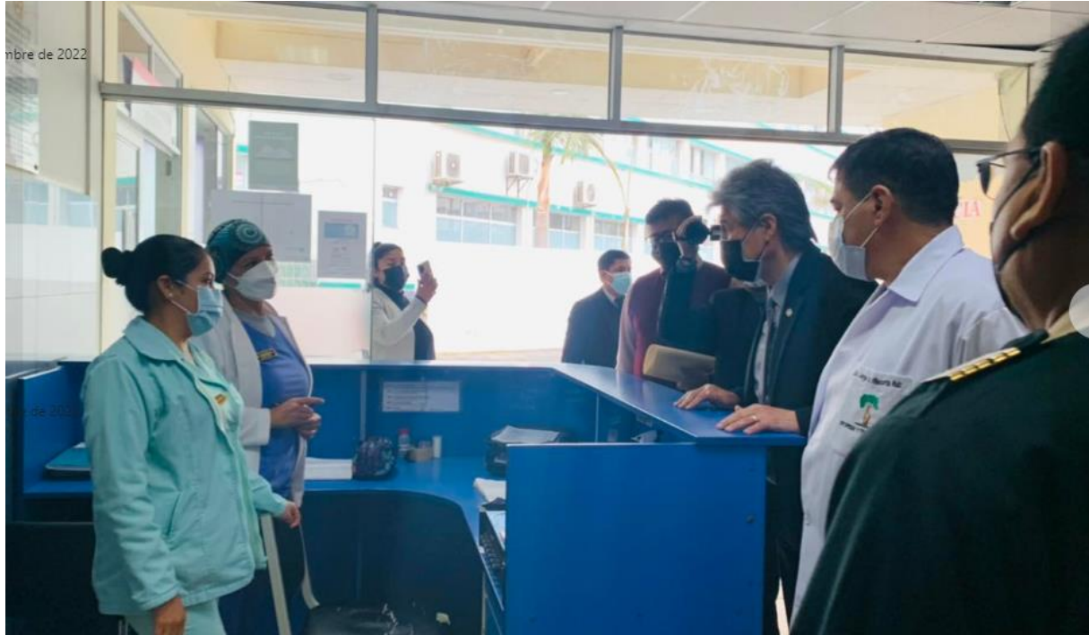
HOSPITAL CENTRAL PNP (04.11.2022)

“Decenio de Igualdad de oportunidad para mujeres y hombres” “Año de la unidad, la paz y el desarrollo”