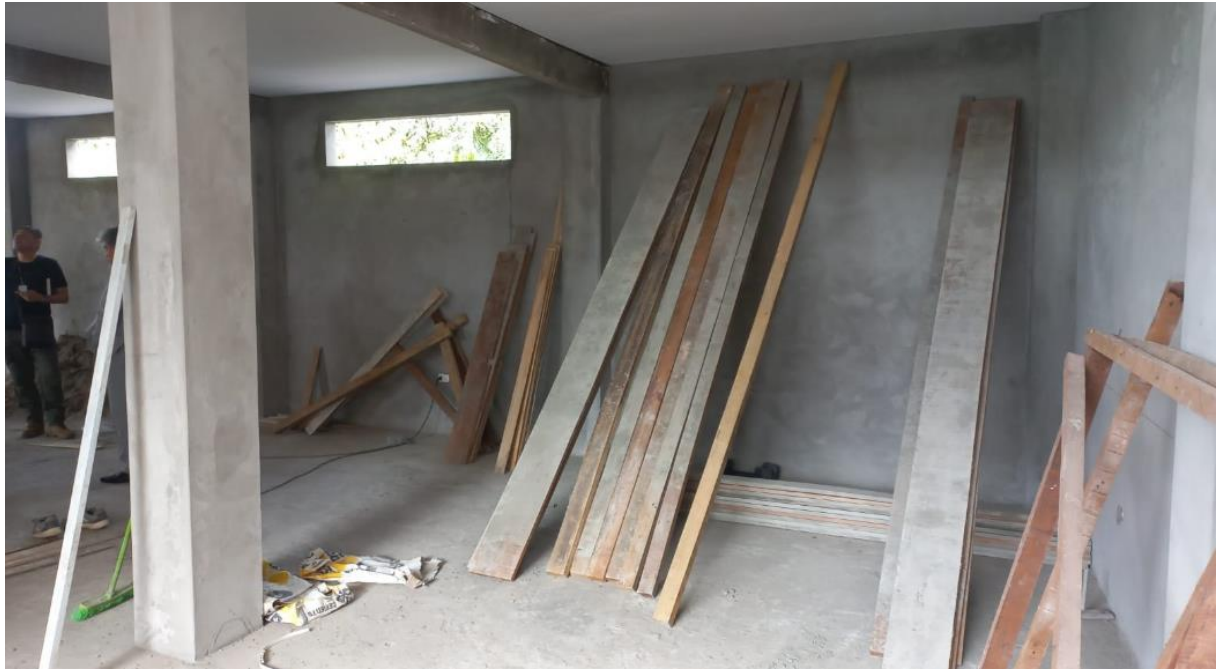
COMISARÍA DE YARINACOCHA (31.05.2023) UCAYALI

“Decenio de Igualdad de oportunidad para mujeres y hombres” “Año de la unidad, la paz y el desarrollo”