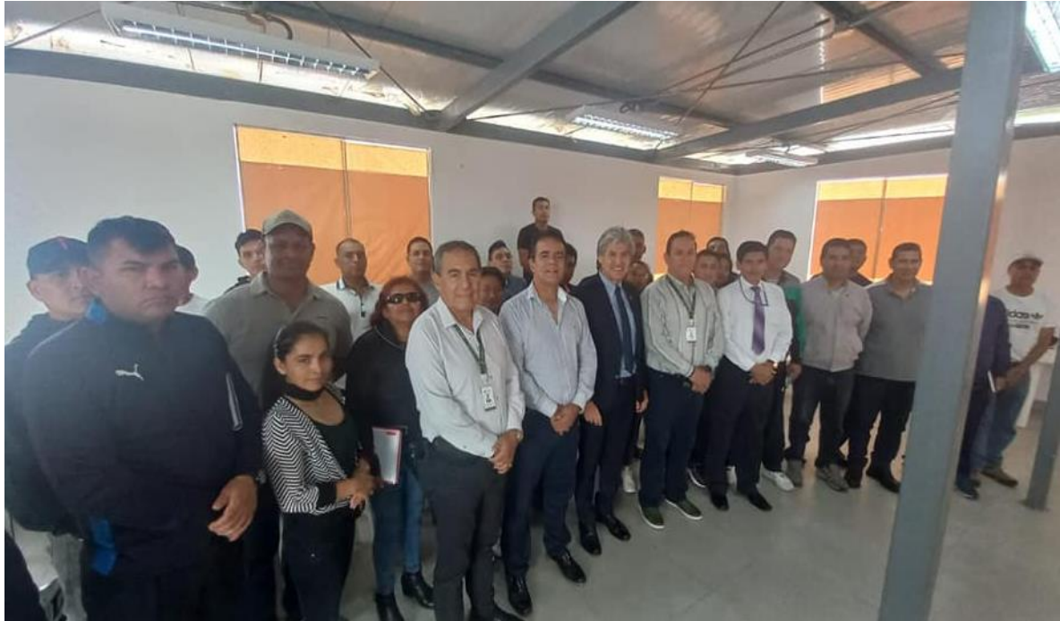
MUNICIPALIDAD DE SAN ISIDRO (24.05.2023)

“Decenio de Igualdad de oportunidad para mujeres y hombres” “Año de la unidad, la paz y el desarrollo”