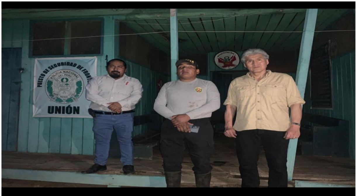
PUESTO DE SEGURIDAD DE FRONTERA UNIÓN (25.09.2022) MADRE DE DIOS