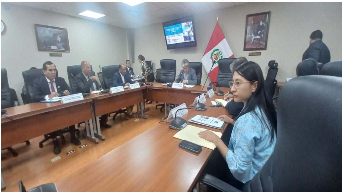
VIGÉSIMO TERCERA SESIÓN ORDINARIA (11.04.2023) PRESENTACIÓN SUCAMEC