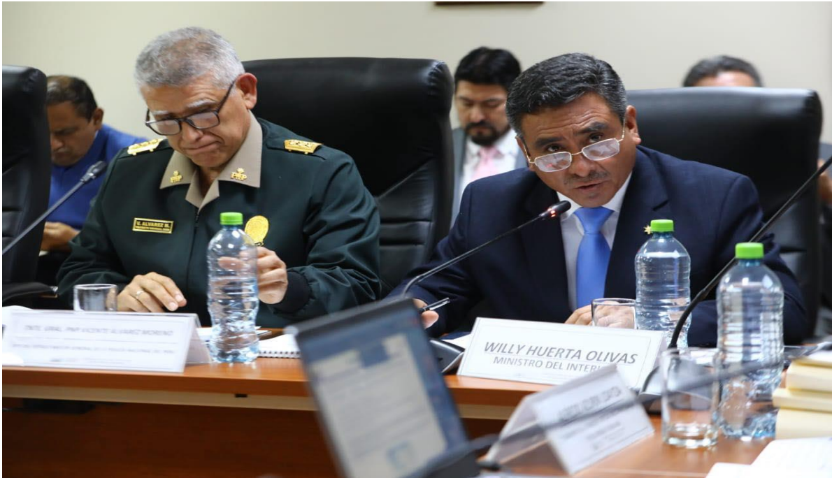
DÉCIMO SÉPTIMA SESIÓN ORDINARIA (18.10.2022) SEÑOR WILLY HUERTA OLIVAS, MINISTRO DEL INTERIOR

“Decenio de Igualdad de oportunidad para mujeres y hombres” “Año de la unidad, la paz y el desarrollo”