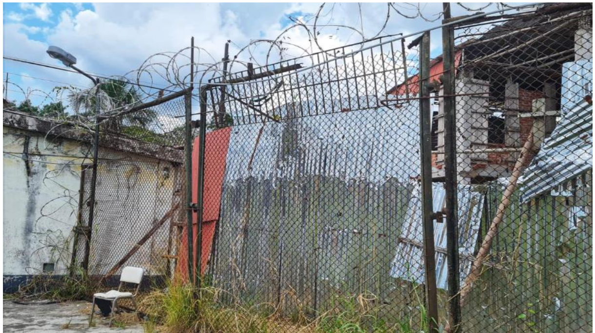
CENTRO PENITENCIARIO DE VARONES (05.12.2022) IQUITOS - LORETO