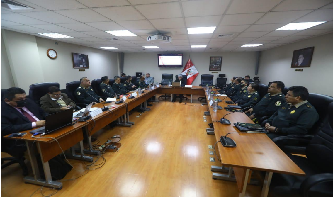
DÉCIMO QUINTA SESIÓN ORDINARIA (04.10.2022) DIVPOL NORTE 3

“Decenio de Igualdad de oportunidad para mujeres y hombres” “Año de la unidad, la paz y el desarrollo”