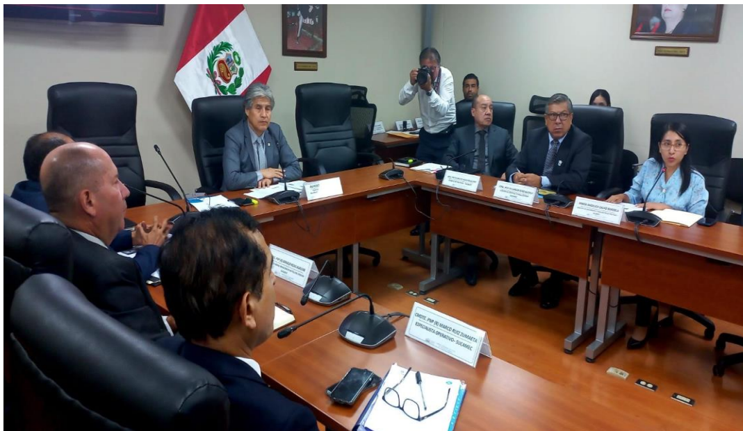
VIGÉSIMO TERCERA SESIÓN ORDINARIA (11.04.2023)