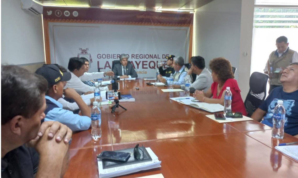
AUDIENCIA DESCENTRALIZADA (24.02.2023) REGIÓN LAMBAYEQUE

“Decenio de Igualdad de oportunidad para mujeres y hombres” “Año de la unidad, la paz y el desarrollo”