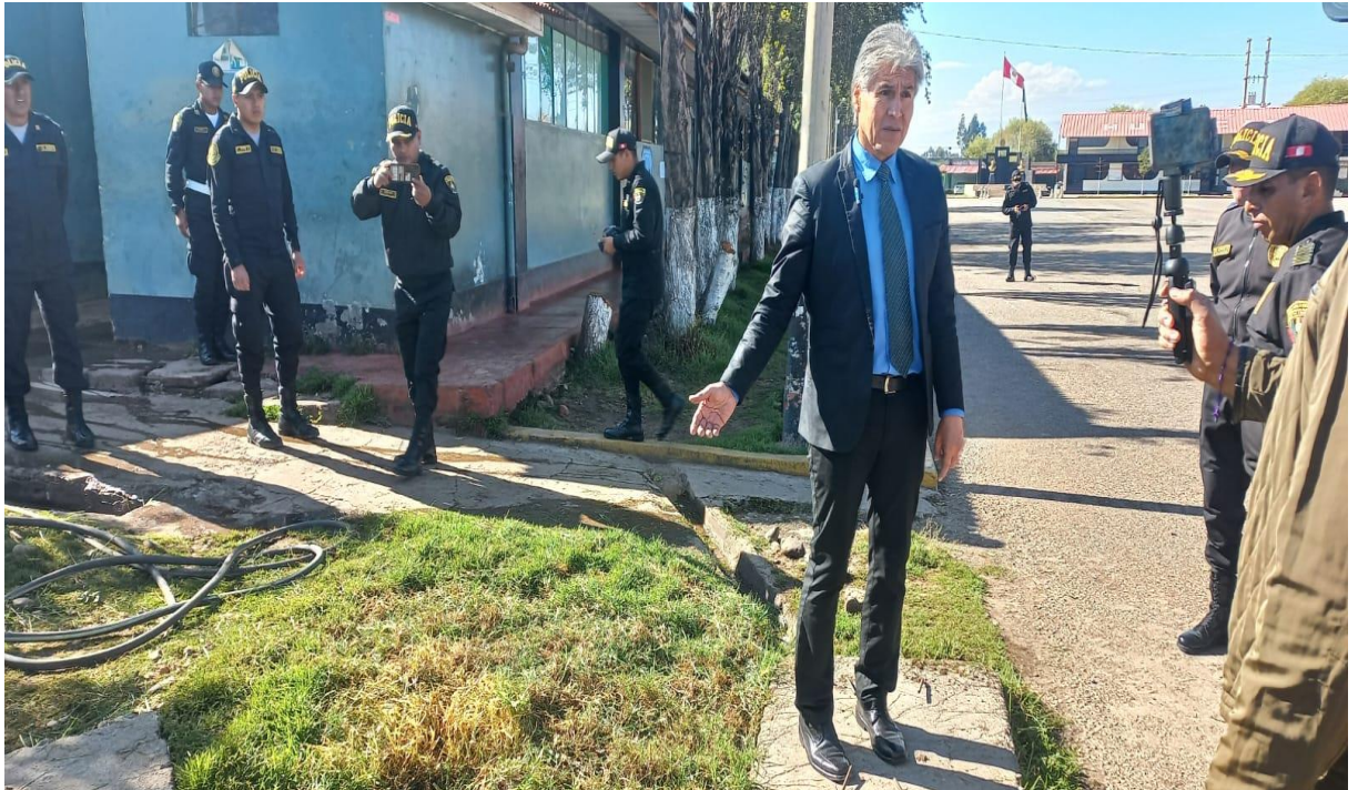
ESCUELA TÉCNICA SUPERIOR PNP DE HUANCAYO (21.04.2023)

“Decenio de Igualdad de oportunidad para mujeres y hombres” “Año de la unidad, la paz y el desarrollo”