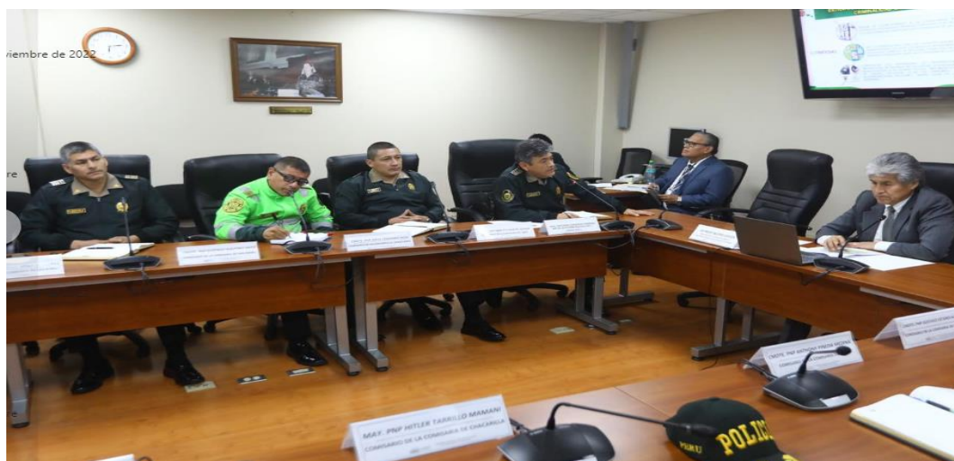
DÉCIMO OCTAVA SESIÓN ORDINARIA (8.11.2022)