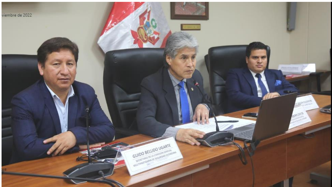
DÉCIMO NOVENA SESIÓN ORDINARIA (15.11.2022)

mantenimiento respectivo; Sobre el presupuesto asignado para combustible y la modalidad de entrega del mismo. Informar, qué vehículos han sido puestos a disposición de la Fiscalía y que, luego, han sido abandonados en las comisarías. Sobre el grado de coordinación que efectúan con las Juntas Vecinales de la zona. Sobre el nivel de participación en los Comités Distritales de Seguridad Ciudadana - CODISEC y, a la vez, informar qué acciones se vienen articulando, y si han detectado algunas deficiencias que puedan ser mejoradas para el buen desarrollo del mencionado comité.