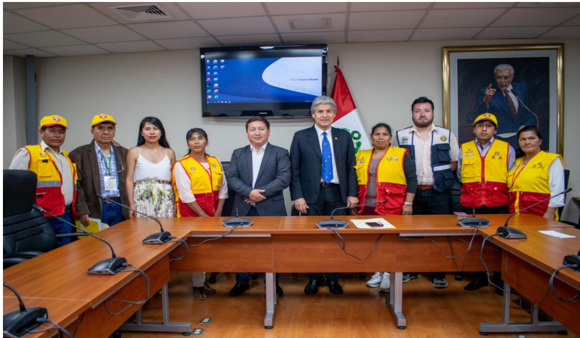
JUNTAS VECINALES DE HUANCAYO Y SUS DISTRITOS (16.02.2023)