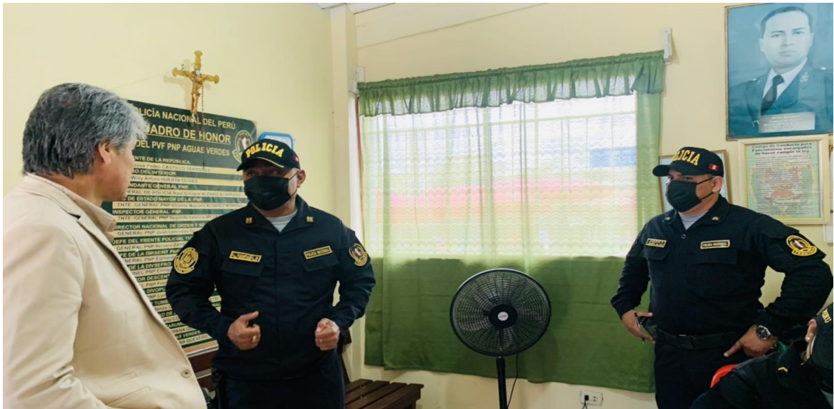
PUESTO DE VIGILANCIA AGUAS VERDES (26 .10. 2022) TUMBES

“Decenio de Igualdad de oportunidad para mujeres y hombres” “Año de la unidad, la paz y el desarrollo”