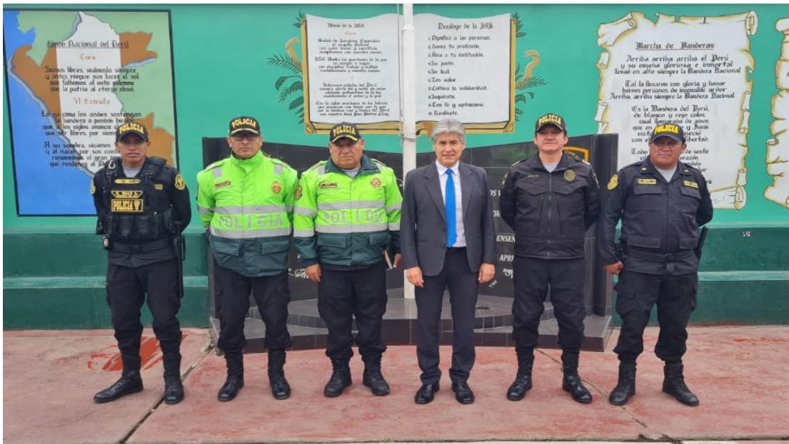
USE PNP HUANCAYO (23.04.2023)