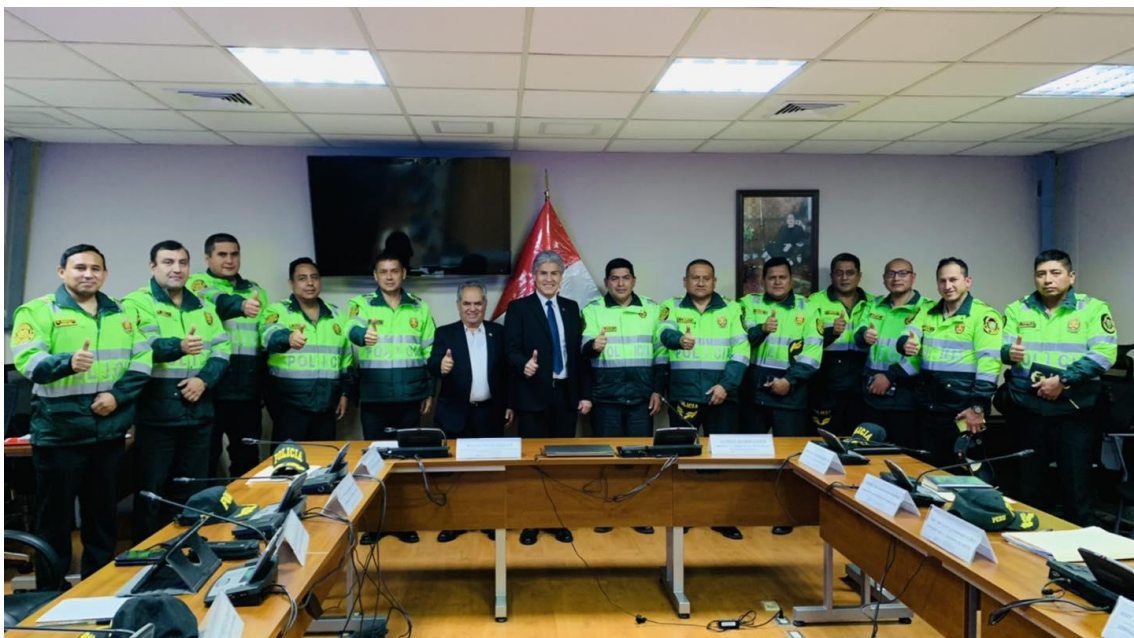
DÉCIMO CUARTA SESIÓN ORDINARIA (20/09/2022) DIVPOL NORTE 1