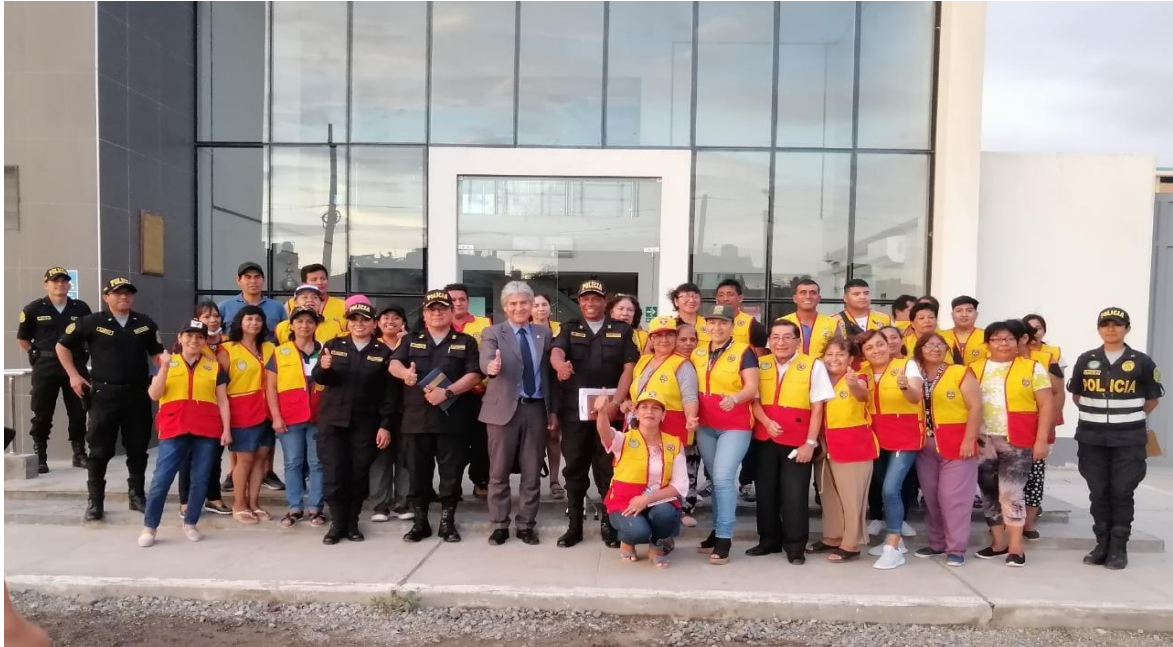
JUNTAS VECINALES (22.02.2023) DISTRITO JOSÉ LEONARDO ORTIZ - CHICLAYO

“Decenio de Igualdad de oportunidad para mujeres y hombres” “Año de la unidad, la paz y el desarrollo”