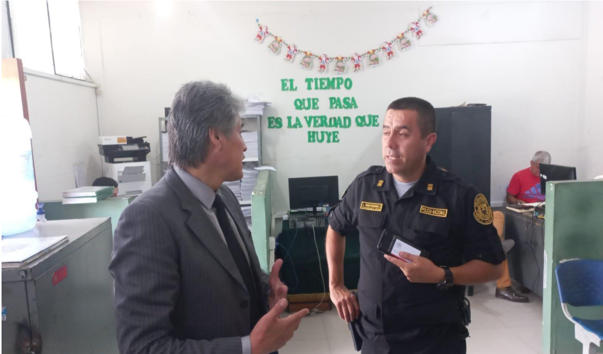
COMISARÍA CÉSAR LLATA (23.02.2023) CHICLAYO

“Decenio de Igualdad de oportunidad para mujeres y hombres” “Año de la unidad, la paz y el desarrollo”