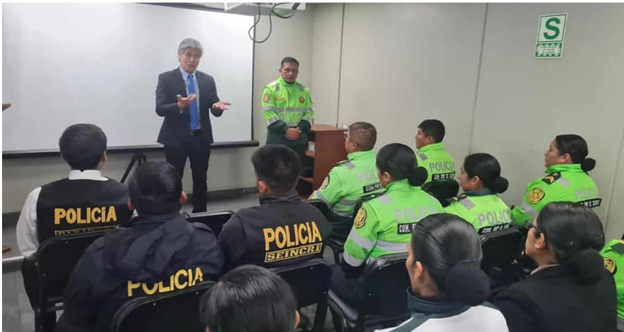
COMISARIA EL TAMBO (24.04.2023)