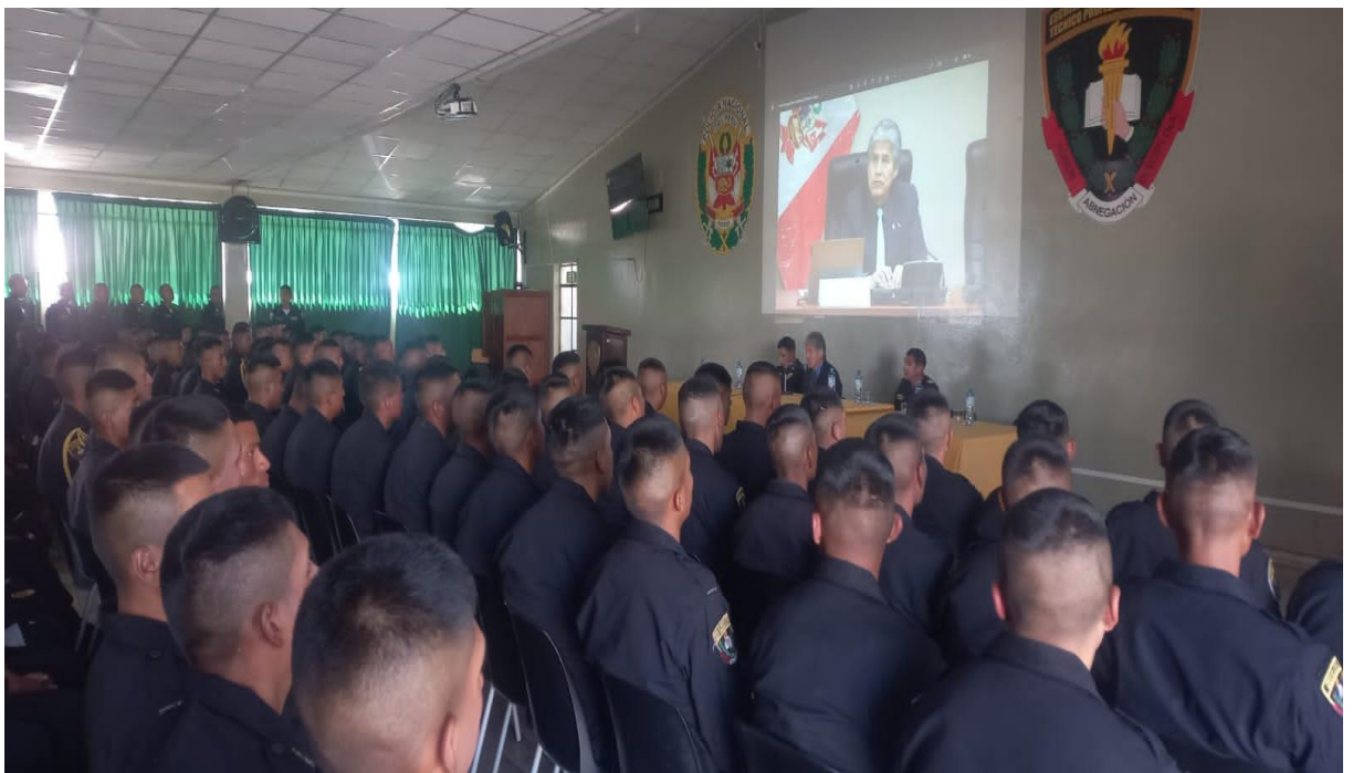
ESCUELA TÉCNICA SUPERIOR PNP DE HUANCAYO (21.04.2023)