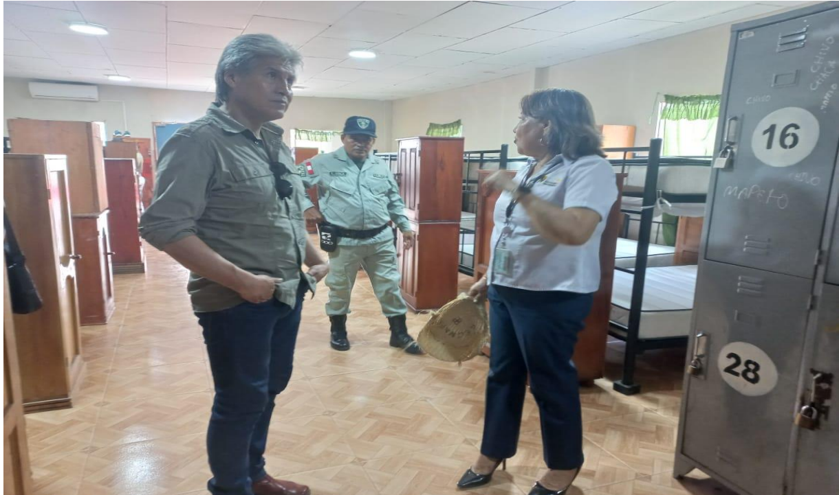
CENTRO PENITENCIARIO DE VARONES (05.12.2022) IQUITOS - LORETO

“Decenio de Igualdad de oportunidad para mujeres y hombres” “Año de la unidad, la paz y el desarrollo”