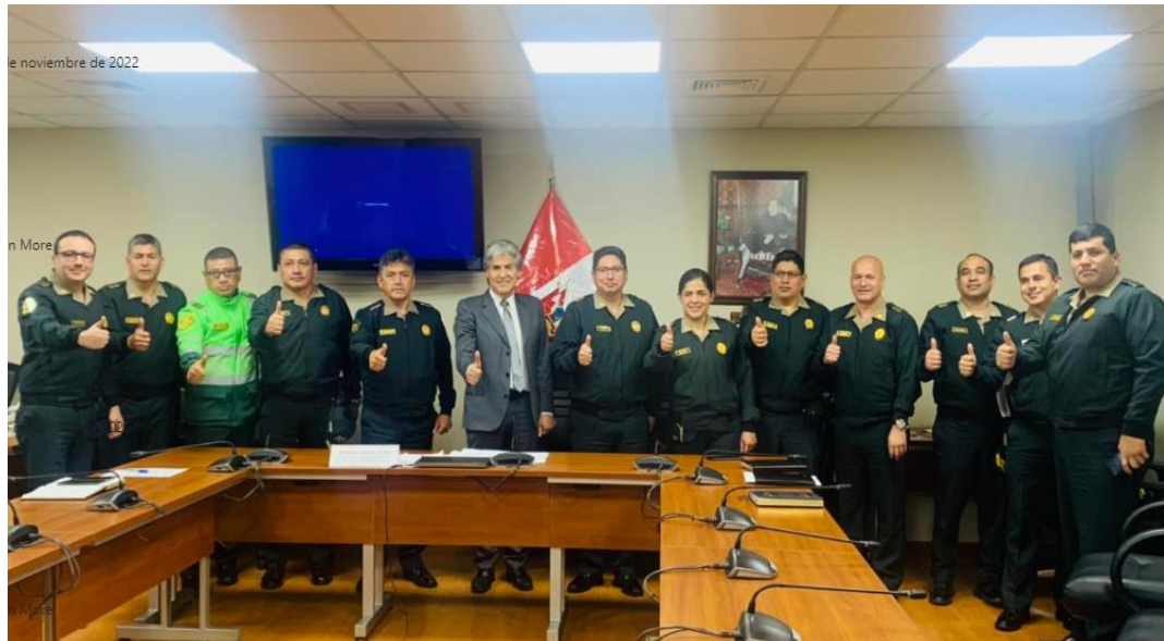
DÉCIMO OCTAVA SESIÓN ORDINARIA (8.11.2022)

“Decenio de Igualdad de oportunidad para mujeres y hombres” “Año de la unidad, la paz y el desarrollo”