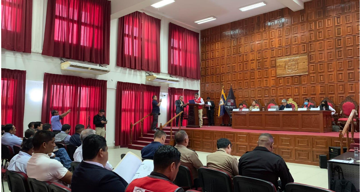
SÉPTIMA SESIÓN DESCENTRALIZADA (27.10.2022) TUMBES

“Decenio de Igualdad de oportunidad para mujeres y hombres” “Año de la unidad, la paz y el desarrollo”