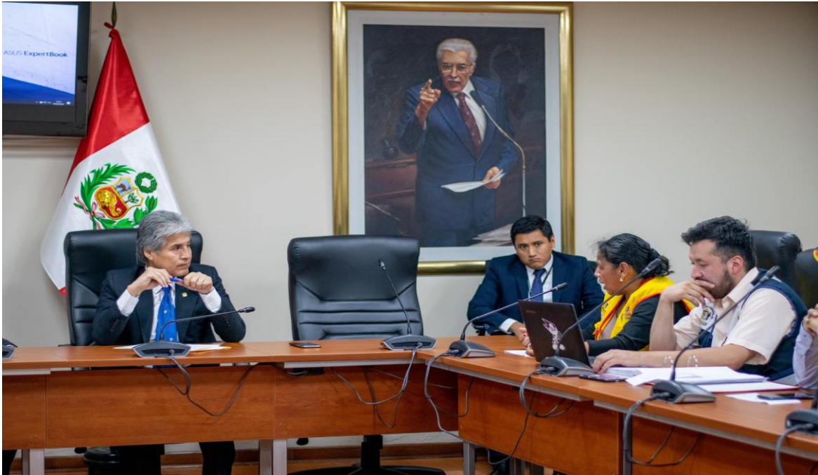
JUNTAS VECINALES DE HUANCAYO Y SUS DISTRITOS (16.02.2023)

“Decenio de Igualdad de oportunidad para mujeres y hombres” “Año de la unidad, la paz y el desarrollo”