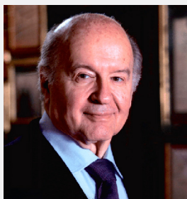
Hernando de Soto

COMISIÓN ESPECIAL MULTIPARTIDARIA CAPITAL PERÚ "Cerrando la brecha entre peruanos"