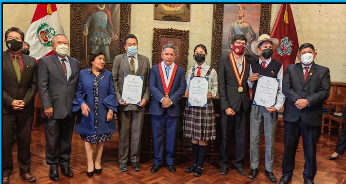
Reconocimiento de estudiantes y docentes de educación básica regular que destacan como talentos en distintas disciplinas del aprendizaje de la región Arequipa el día 23 de junio de 2022