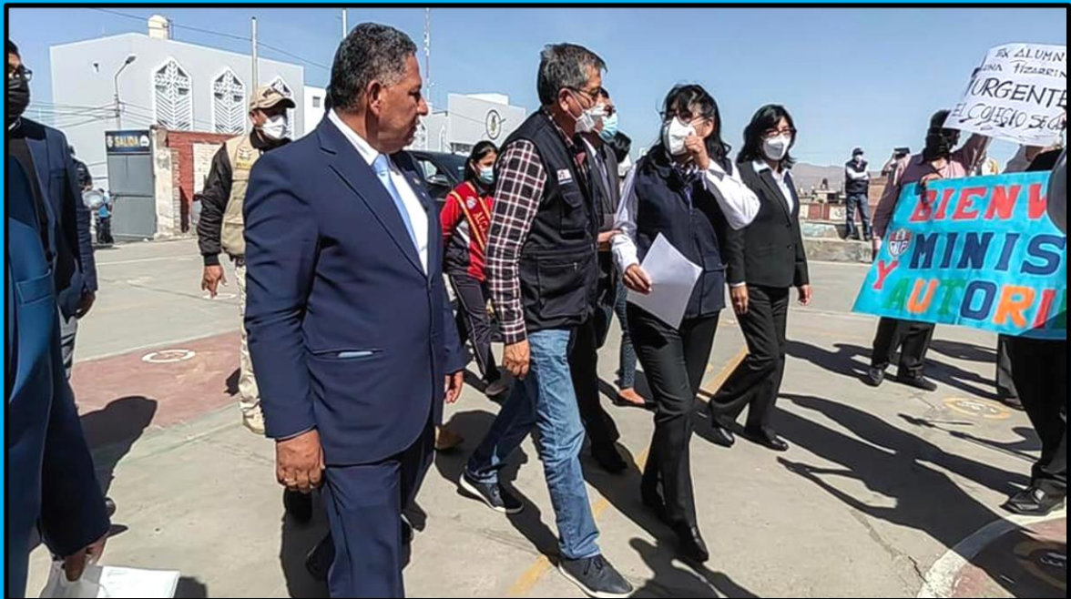
Visita al Colegio Javier de Luna Pizarro, ubicado en el distrito de Miraflores, región Arequipa, el día 23 de junio de 2022