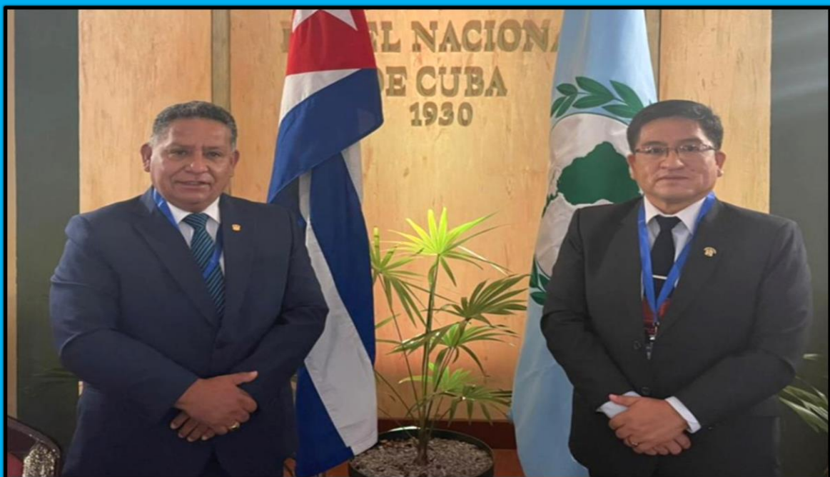
Participación en la XXXVI Reunión de la Comisión de Educación, Cultura, Ciencia, Tecnología y Comunicación, que se desarrolló en la Habana, Cuba, el día 26 de mayo del 2022