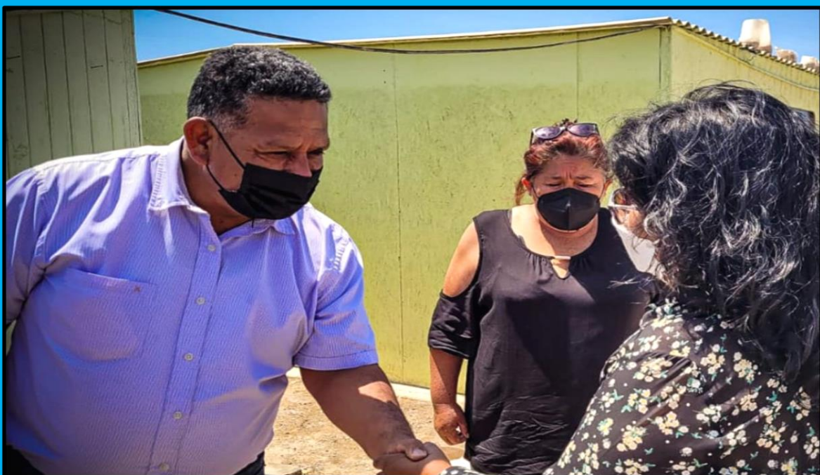
Visita a la Institución Educativa “Las Gardenias” en la región Arequipa, El Pedregal, con motivo de la campaña “Colegios en emergencia”, realizada el día 21 de marzo de 2022