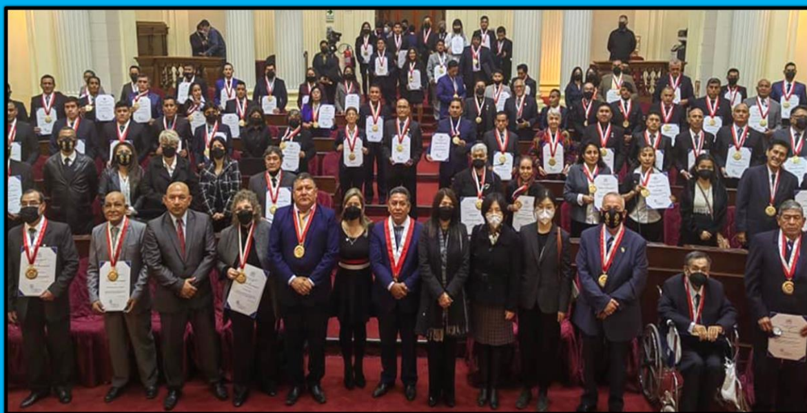
Ceremonia "II Reconocimiento a los instructores y maestros de artes marciales chinas del Perú", realizada en el Hemiciclo Raúl Porras Barrenechea del Congreso de la República el día 3 de junio de 2022