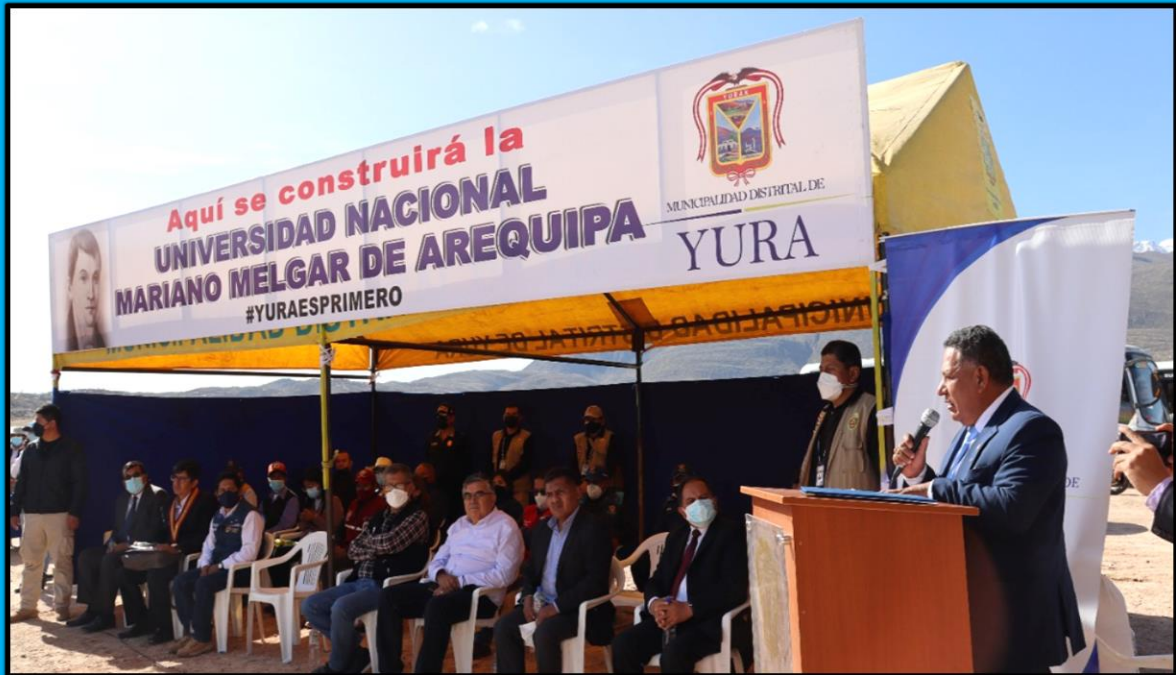
Visita al terreno en donde se proyecta la creación de la Universidad Nacional Mariano Melgar de Arequipa, distrito de Yura, región Arequipa, el día 23 de junio de 2022