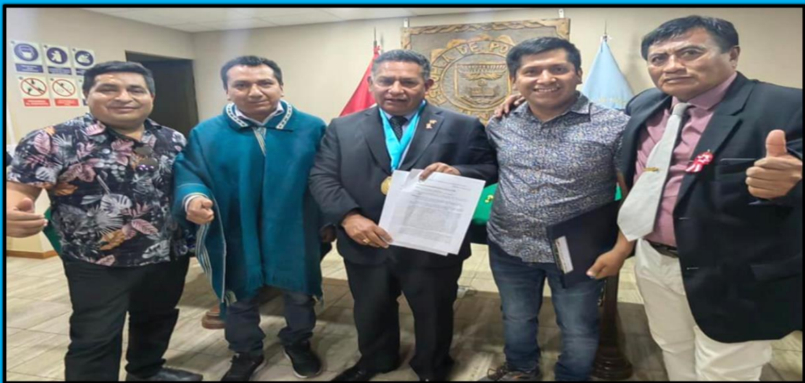
Reconocimiento a los docentes en la Universidad Nacional de Piura, realizada en la ciudad de Piura, con motivo del "Día del Maestro" el día 4 de julio de 2022