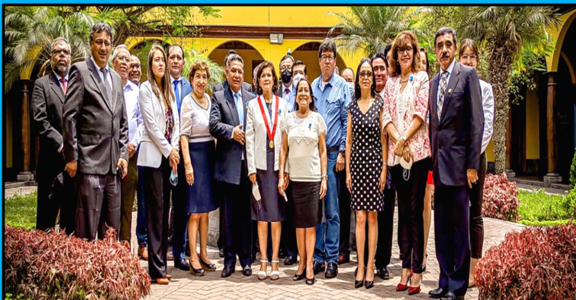
Juramentación del nuevo Consejo Directivo de la Asociación Nacional de Universidades Públicas del Perú (ANUPP) 2022 – 2024, realizada el día 4 de marzo de 2022