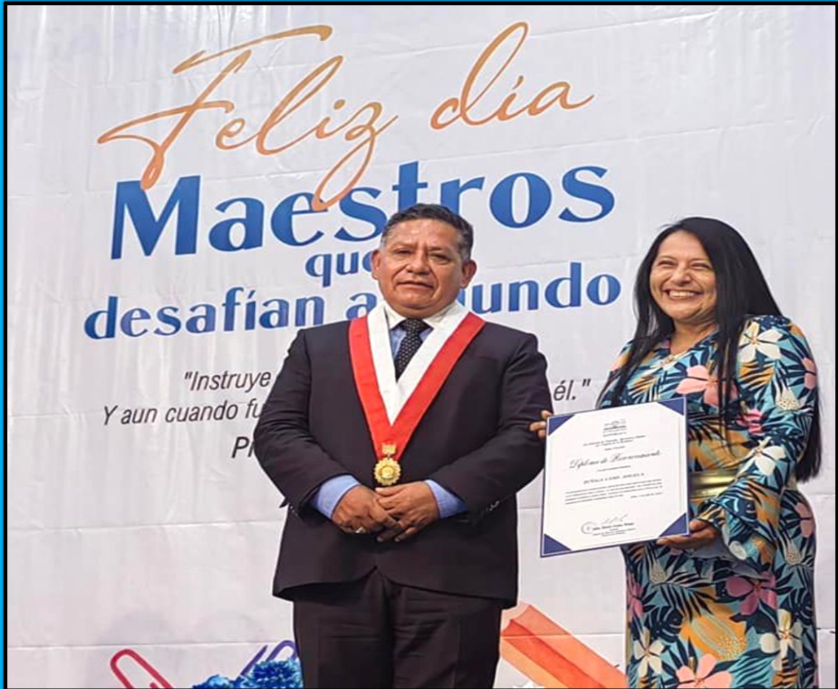
Reconocimiento a los docentes en el distrito de Pueblo Libre con motivo del "Día del Maestro" el día 3 de julio del 2022