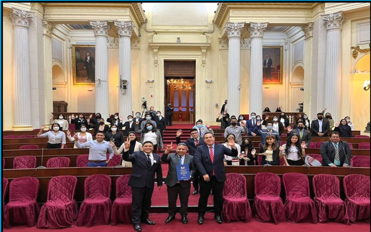
Exposición del Proyecto de Ley N° 970/2021-CR, por el que se propone la Ley General de Juventudes del Perú. En dicha reunión participa la Red Nacional de Juventudes del Perú, efectuada el día 9 de mayo de 2022