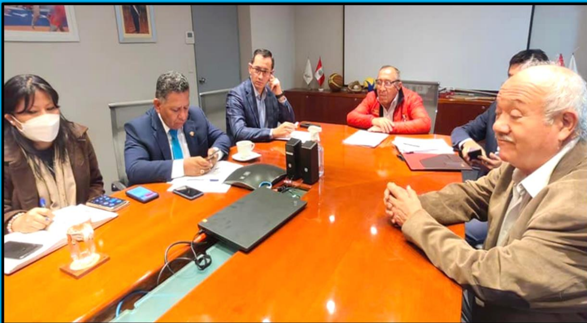
Reunión con el presidente del Instituto Peruano del Deporte (IPD) para tratar sobre la problemática del "Complejo Deportivo 9 de noviembre" y del "Coliseo Julio Granda", ubicados en la región Arequipa, provincia de Camaná, el día 2 de junio de 2022