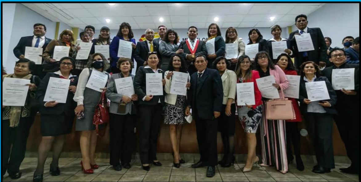
Reconocimiento a los docentes de Arequipa con motivo del "Día del Maestro" efectuado el día 10 de julio de 2022