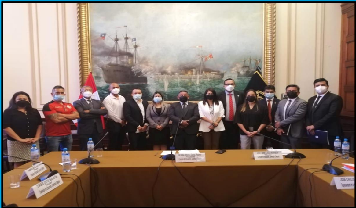
Mesa de trabajo "Fortalecimiento de las organizaciones deportivas de fútbol" realizada el día 14 de febrero de 2022