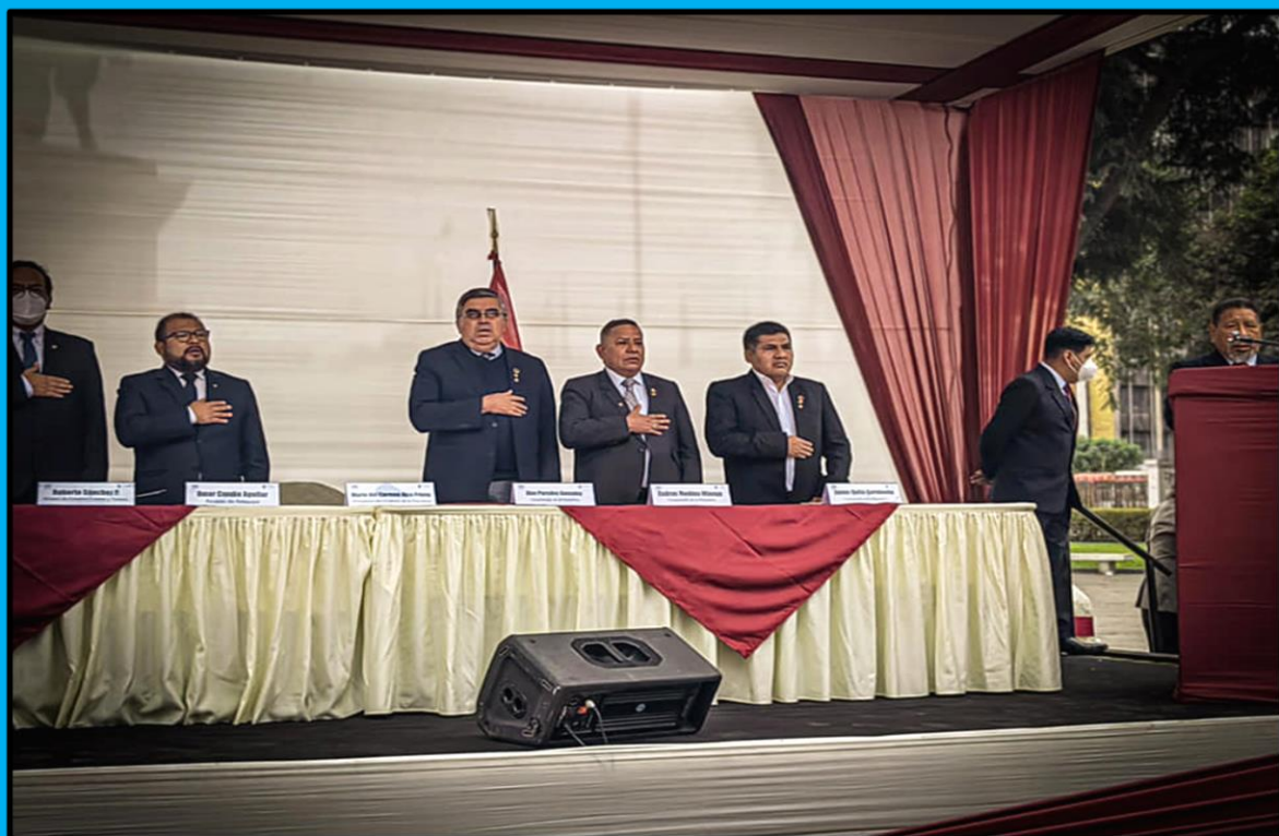
Presentación de las actividades por el aniversario de Arequipa en el Congreso de la República, Plaza Bolívar, el día 15 de julio de 2022