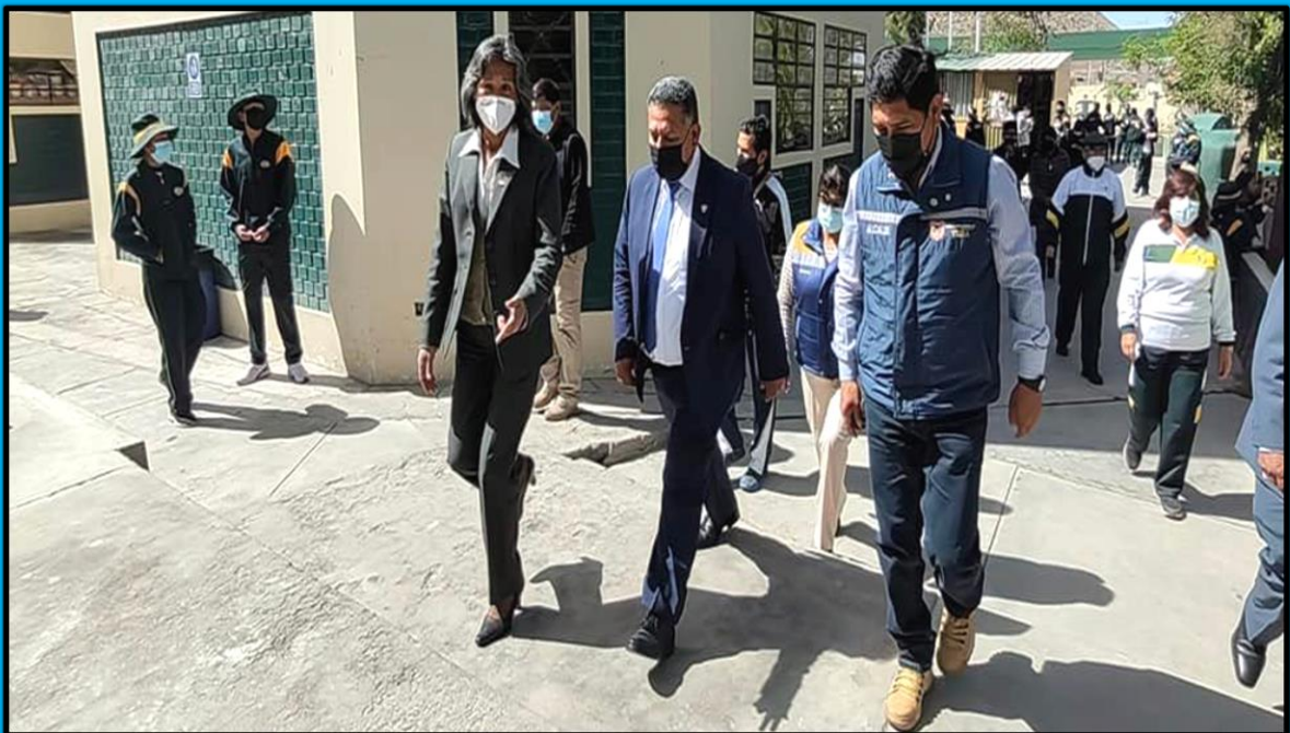
Visita a la Institución Educativa San Bernardo – CIRCA, en la ciudad de Arequipa, realizada el día 21 de junio de 2022