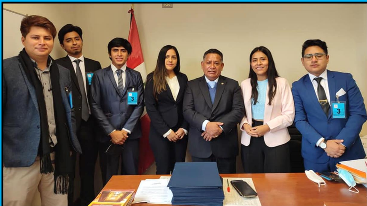
Reunión con estudiantes de las diferentes facultades de la Universidad Nacional Mayor de San Marcos el día 1 de julio de 2022