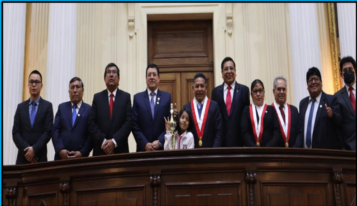
Reconocimiento a los deportistas calificados, a los ciudadanos y a las autoridades con buenas prácticas en la gestión pública realizado en el Hemiciclo Raúl Porras Barrenechea del Congreso de la República el día 28 de junio de 2022