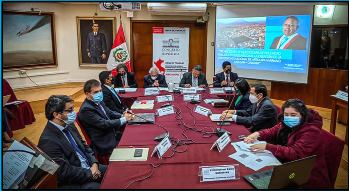
Mesa de Trabajo sobre el Proyecto de Ley 2140/2021-CR que declara de necesidad pública e interés nacional la creación de la Universidad Nacional Mariano Melgar de Arequipa