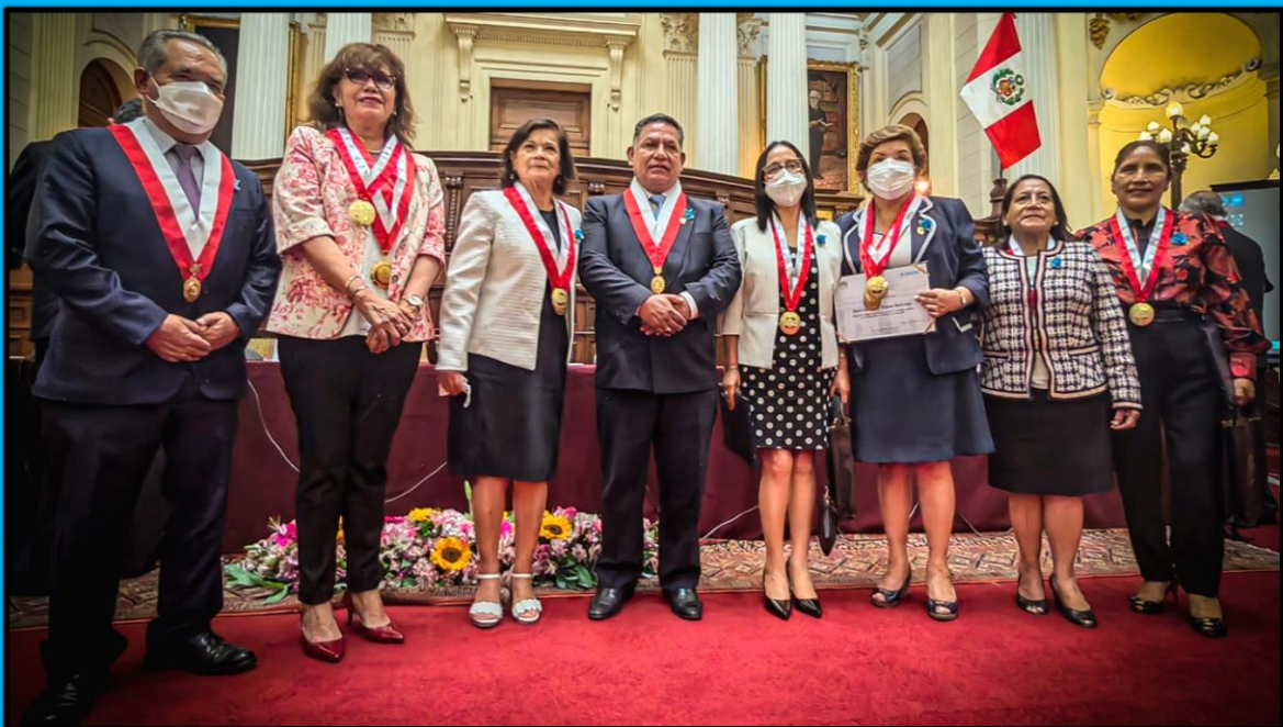
Reconocimiento por el “Día de la Mujer” a las rectoras del país en el evento: “Mujeres destacadas por su trabajo, amor y lealtad con la patria y la familia”, efectuado el día 4 de marzo de 2022