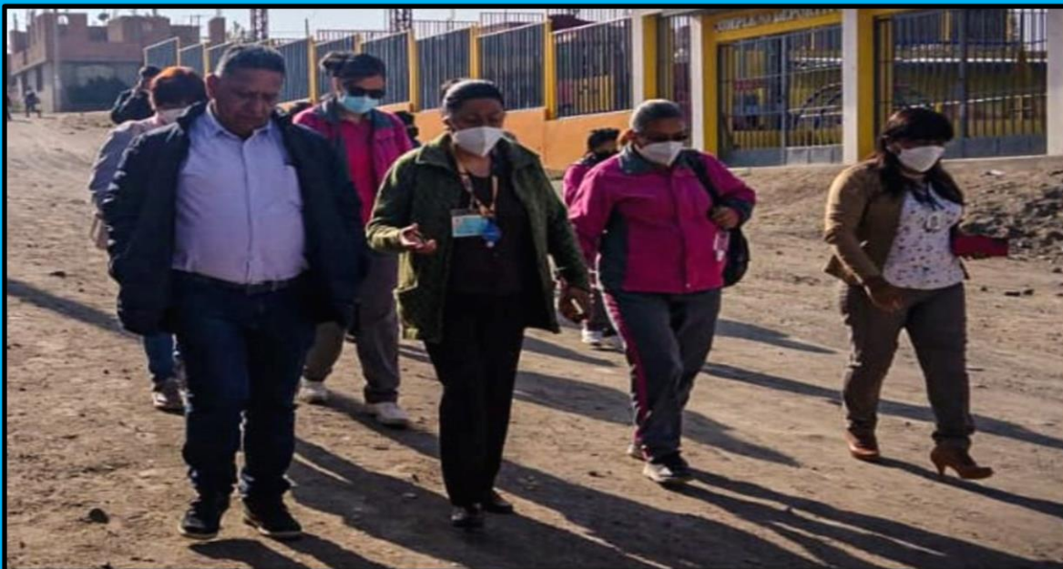
Visita al colegio María Arguedas, ubicado en el distrito de Cerro Colorado en la provincia de Arequipa, efectuada el día 18 de marzo de 2022