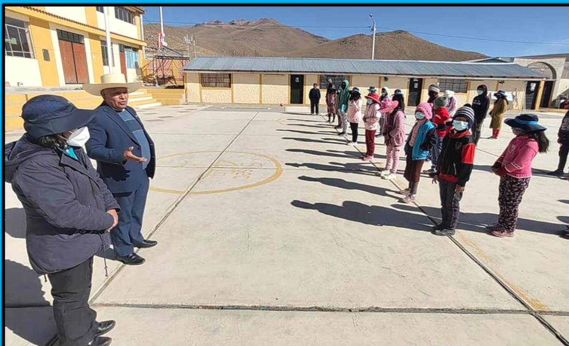
Visita al Colegio Técnico Agropecuario Artesanal San Juan de Tarucani I. E. 40196, en el distrito de San Juan de Tarucani, región Arequipa, el día 22 de junio de 2022