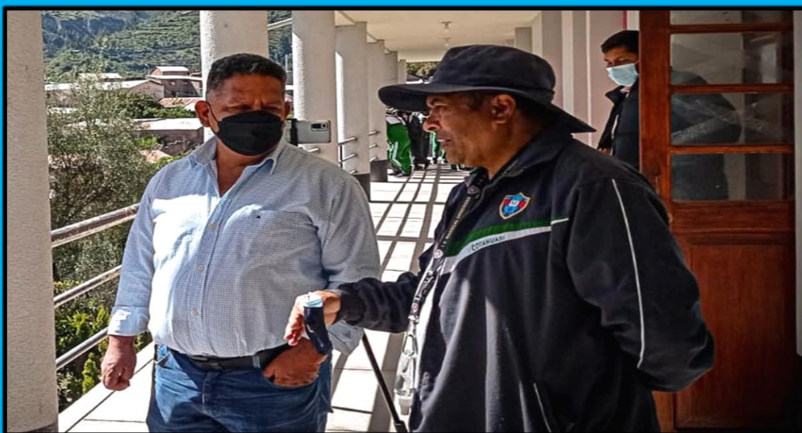
Visita a la Institución Educativa de Ciencia y Tecnología Mariscal Orbegoso, ubicado en el distrito de Cotahuasi, provincia de La Unión, región Arequipa, realizada el día 18 de abril de 2022