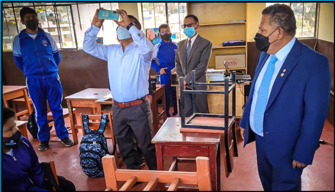
Visita a la Institución Educativa "El Nazareno", ubicada en el distrito de Cerro Colorado, Región Arequipa, efectuada el día 24 de marzo de 2022