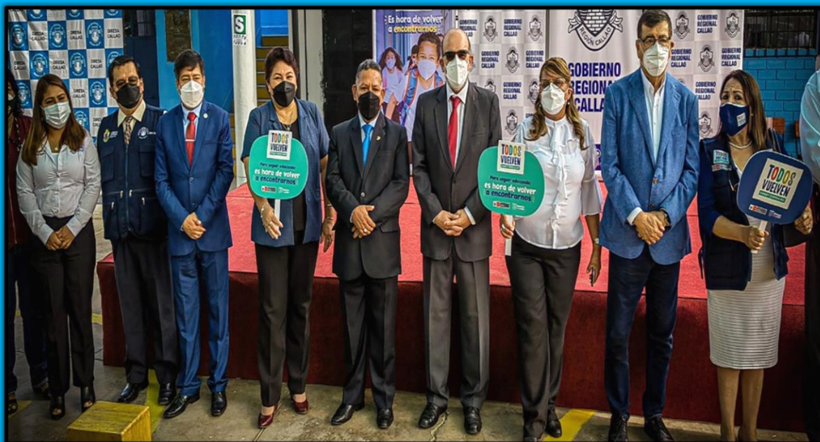
Participación en el retorno del inicio del año escolar "Todos Vuelven", acto realizado en la I.E. N.º5050 San Pedro, el día 14 de marzo de 2022