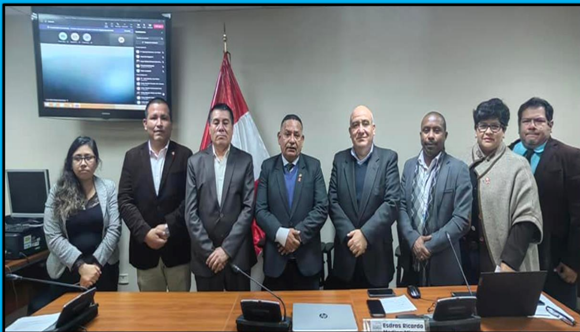
Mesa de Trabajo denominada “La convivencia sin violencia en las instituciones educativas del Perú” realizada el 12 de julio de 2022