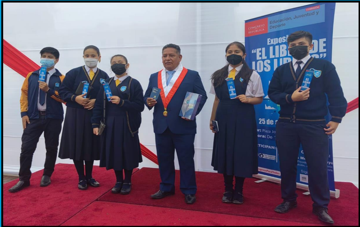
Evento "El libro de los libros – El compendio de todo", actividad en mérito al "Día Internacional del Libro" efectuada el día 25 de abril del 2022