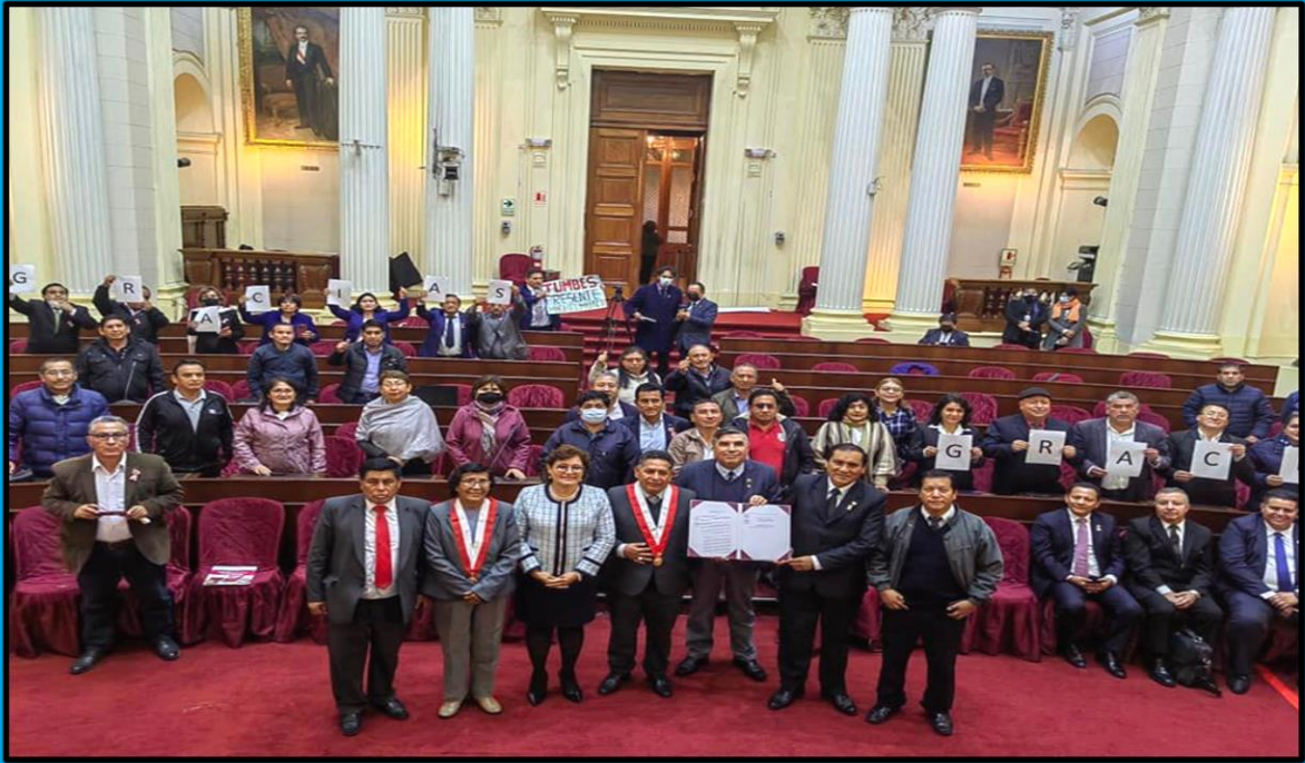
Firma de la Autógrafa de la Ley que modifica de la Ley N° 30512, Ley de Institutos y Escuelas de Educación Superior y de la Carrera Pública de sus Docentes, realizada el día 8 de julio de 2022