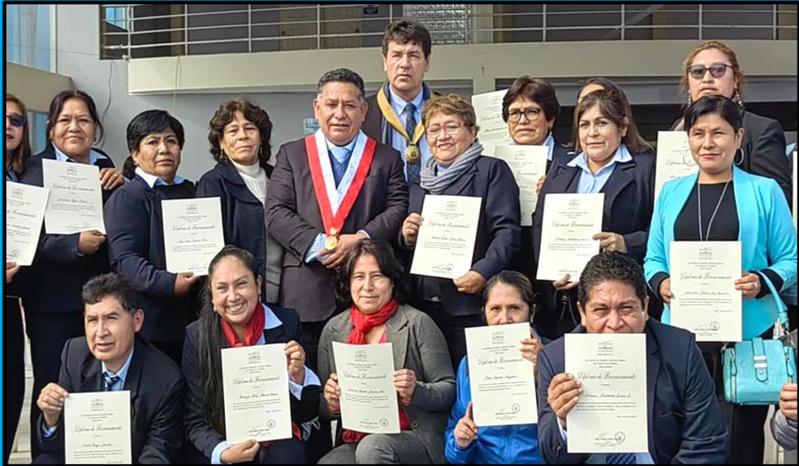
Reconocimiento a docentes con motivo del “Día del Maestro” realizado el día 30 de junio de 2022