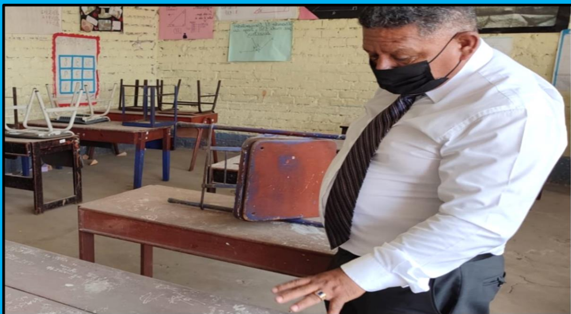
Visita a la Institución Educativa 7072 San Martín de Porres, ubicada en el distrito de Villa El Salvador, efectuada el día 17 de febrero de 2022