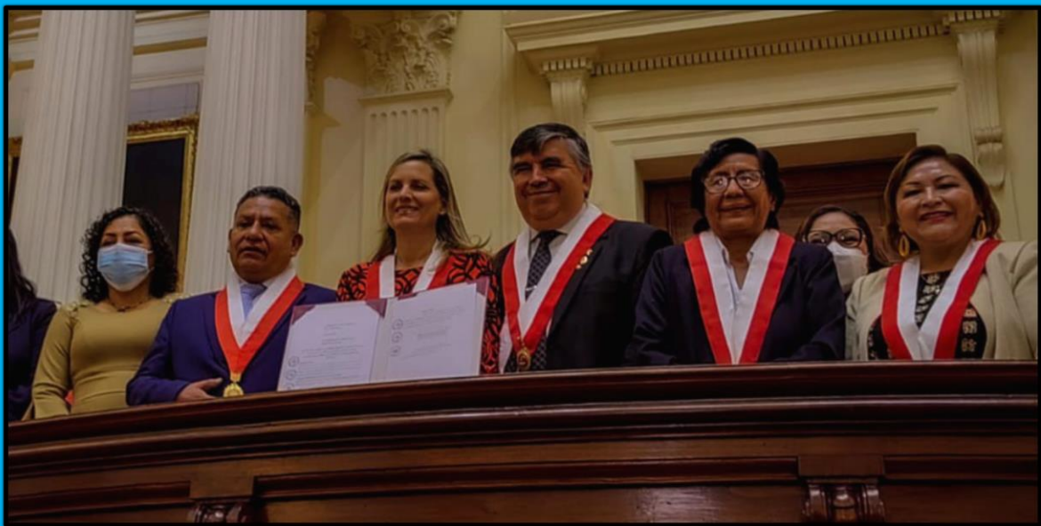
Firma de la Autógrafa de Ley que revaloriza la carrera docente, modificando los artículos 53 y 63 de la Ley 29944, Ley de Reforma Magisterial, sobre la Compensación de Tiempo de Servicios, realizada el día 11 de abril de 2022