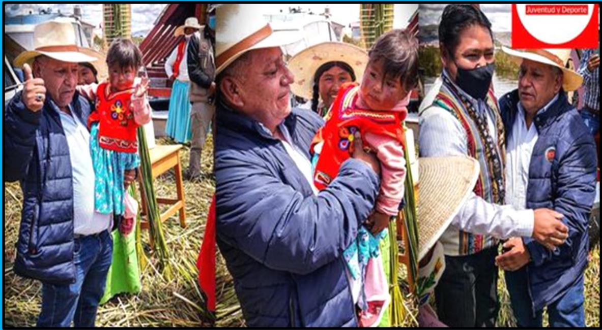
Visita al Colegio 70682 de Uros Torani Pata, ubicado en el departamento de Puno, realizada el día 22 de marzo de 2022