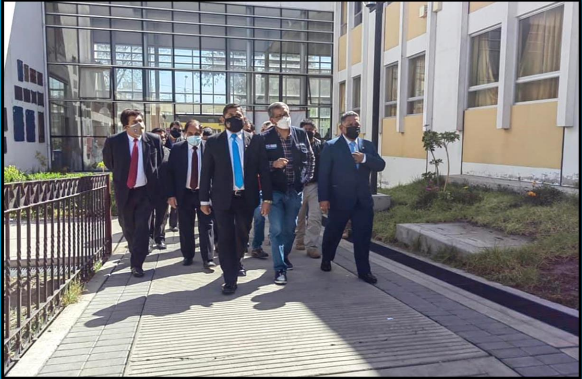
Visita al Colegio Independencia Americana, región Arequipa, el día 23 de junio de 2022