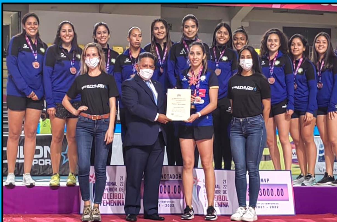
Participación en la final de la Liga Nacional Superior Vóleybol Femenina organizado por la Federación Peruana de Vóleybol, Polideportivo de Villa El Salvador, realizada el día 13 de abril del 2022