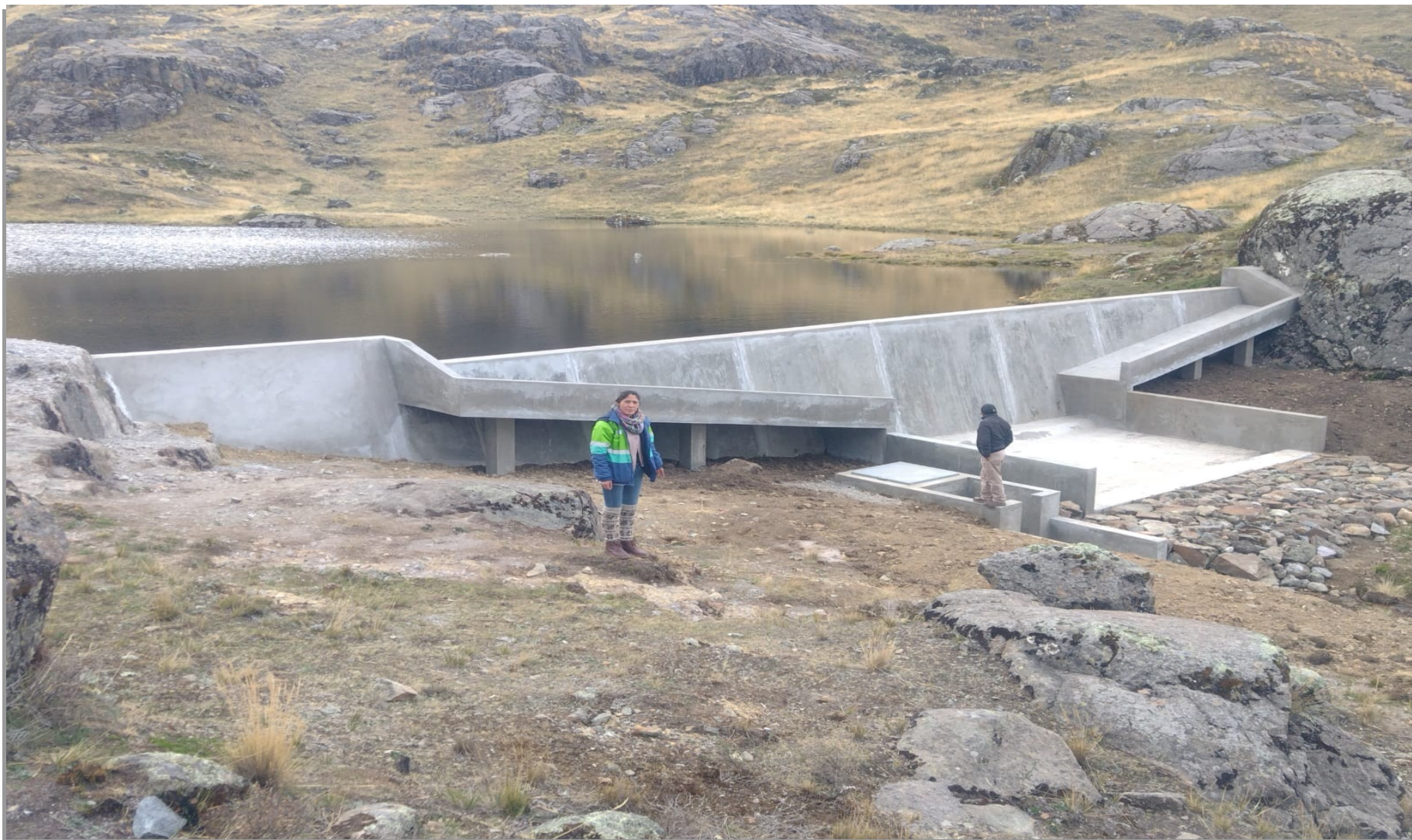
QOCHA CONCLUIDA, DISTRITO SECLLA, PROV. ANGARAES, HUANCVELICA. CON PUNCHE PERU – NÚCLEO EJECUTOR