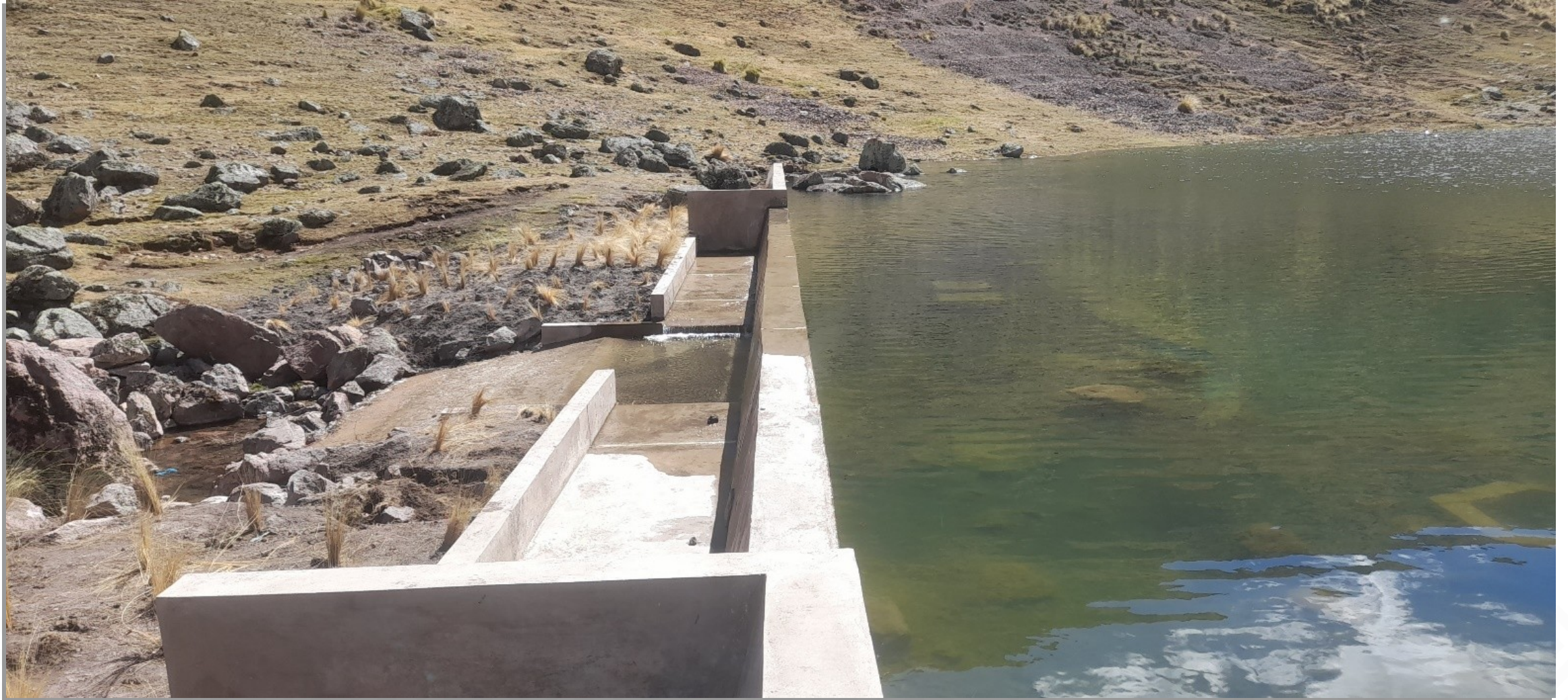
QOCHA CONCLUIDA, DISTRITO CHECACUPE, PROV. CANCHIS, CUSCO. CON PUNCHE PERU - NÚCLEO EJECUTOR