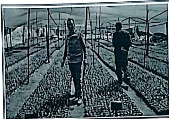
Foto N° 02: Verificación del estado de plantas en el vivero de Huertaca.