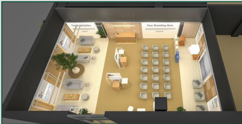
Ejemplo de pabellón