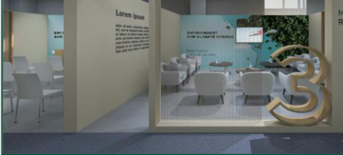
Ejemplo de sala de reuniones