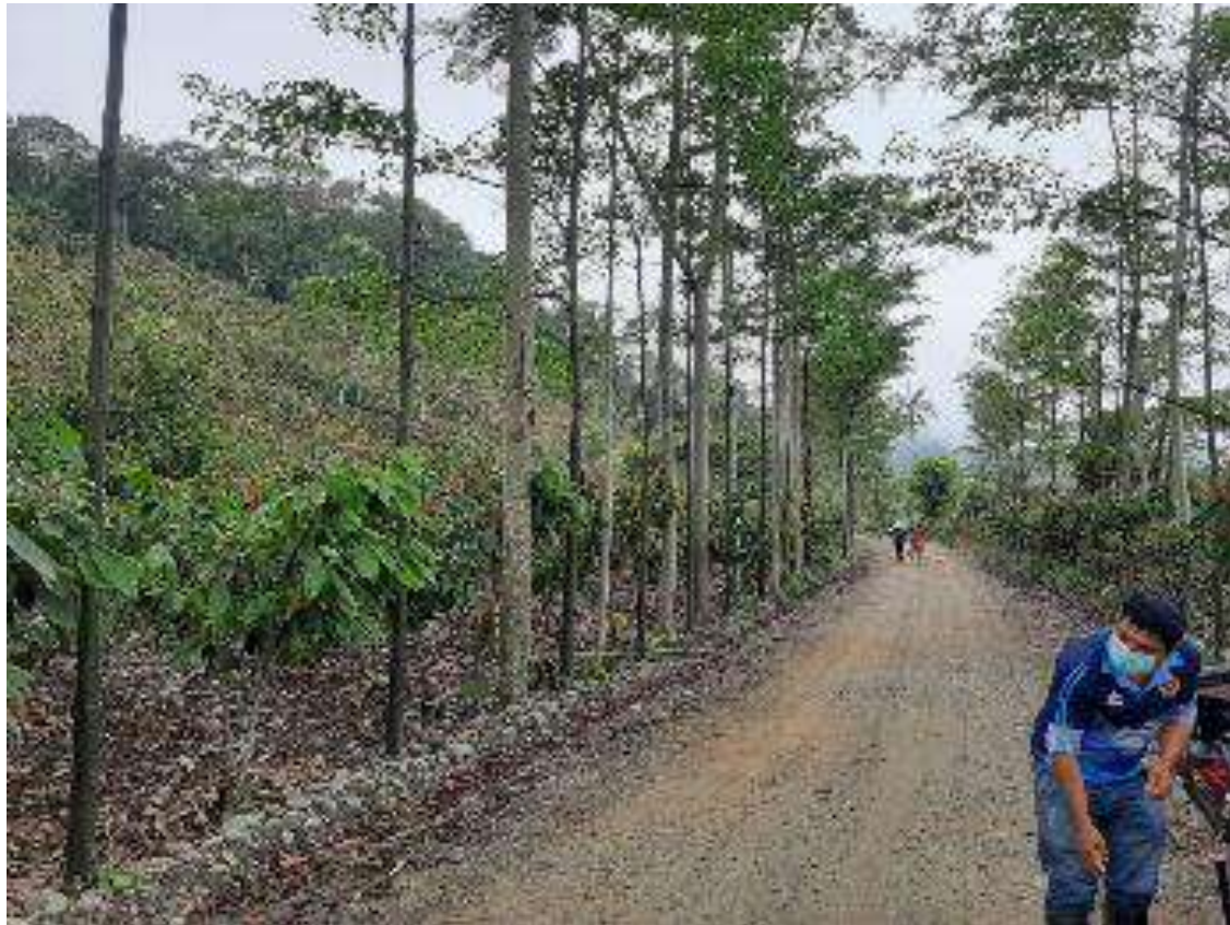
SAF: Caserío Camote