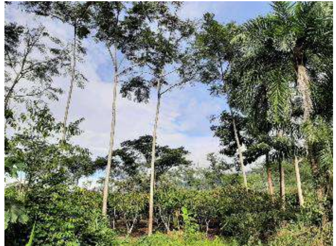
SAF: Caserío Manchuria