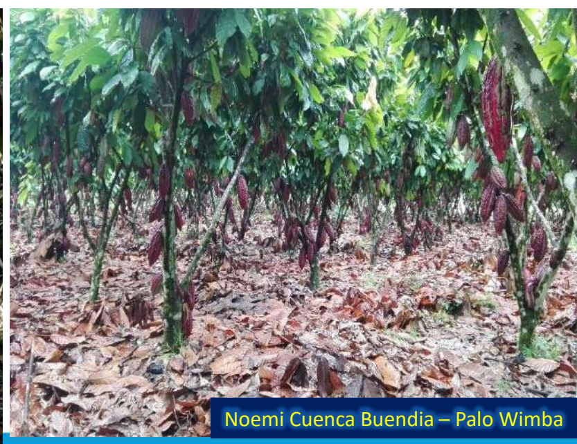
Noemi Cuenca Buendia – Palo Wimba