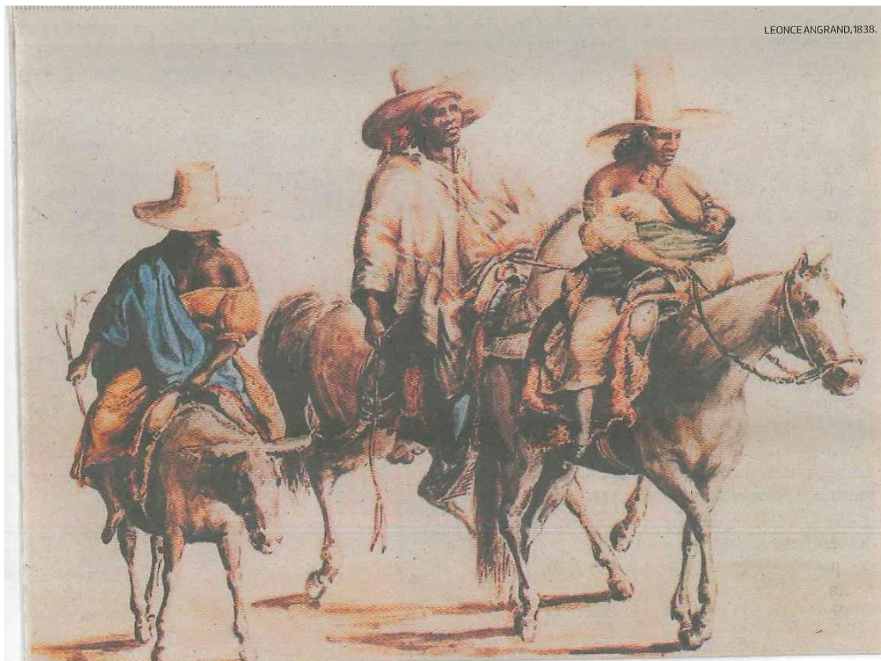
Pintura de Pancho Fierro