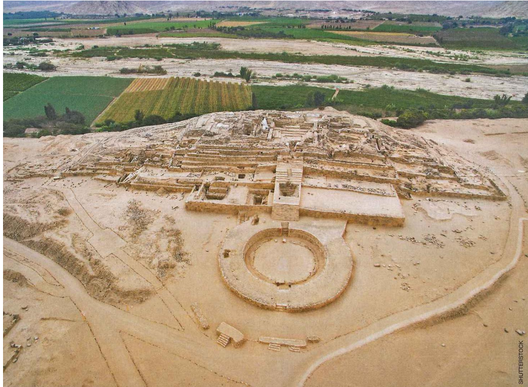
Cultura Caral, al Norte de Lima