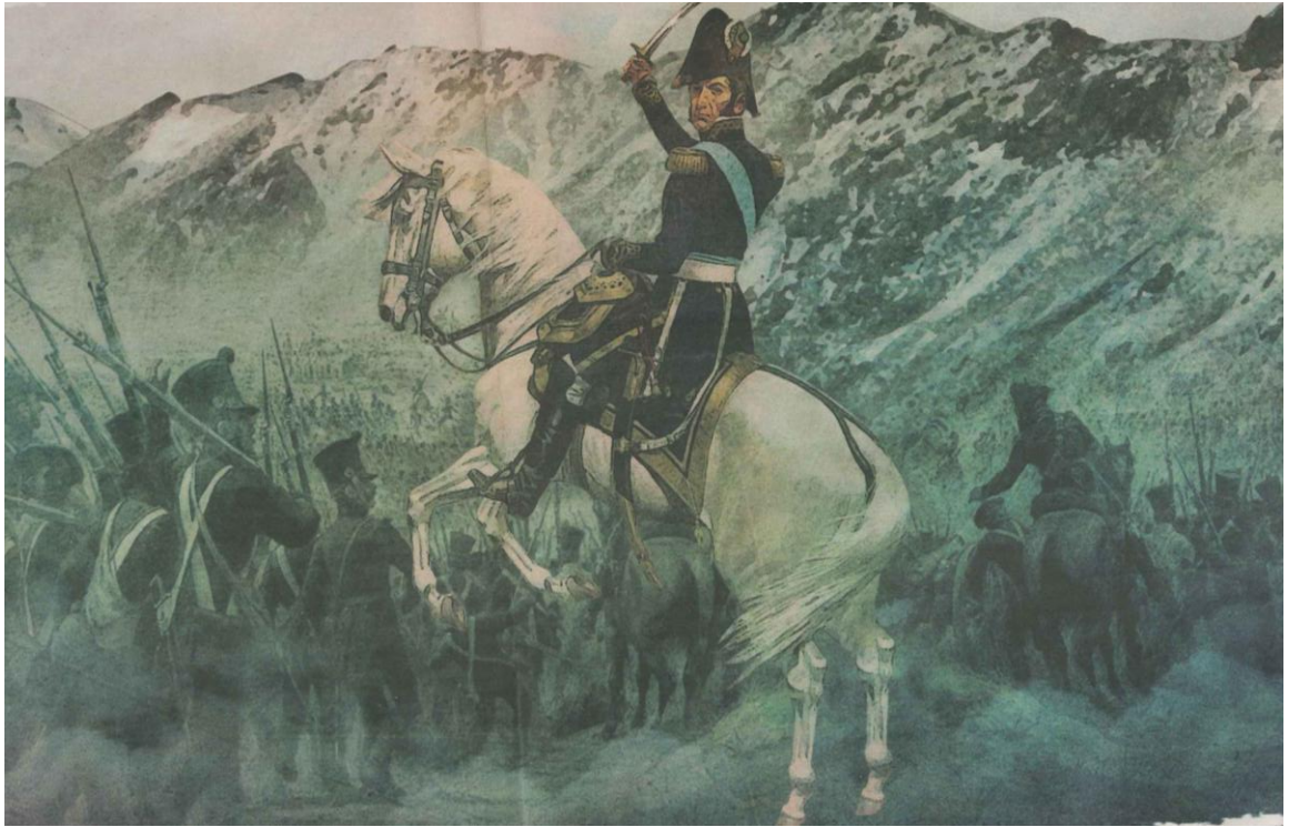
San Martín cruzando los Alpes, 1818

los hechos nos anteceden; el tema da para más esto es solo una parte de dicha conferencia, pueden ver la bibliografía.