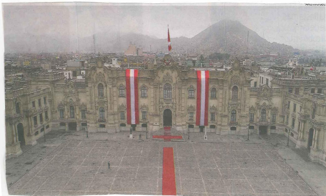
Palacio de Gobierno 2021