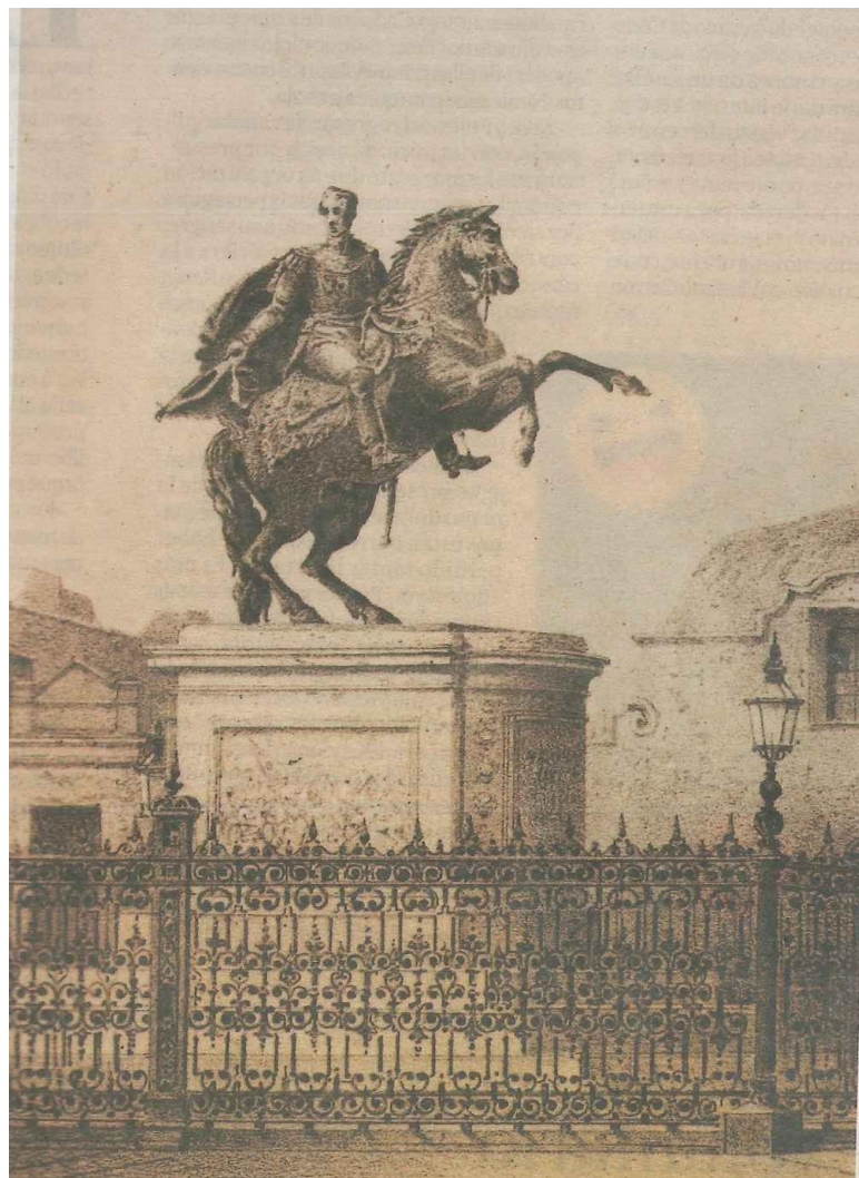
Monumento a Bolívar en la Hoy, Plaza Bolívar

arroba. Pensar en el, asomarse a su vida leerle una arenga, verlo deshecho y jadeante en una Carta de amores, es como sentirse orleado de oro el pensamiento. Su ardor fue el de nuestra redención, su lenguaje fue el de nuestra naturaleza, su cúspide fue la de nuestro continente; su caída, para el corazón. Dícese bolívar y ya se ve delante el monte a que, mas que la nieve, sirve el encapotado jinete de corona; ya el pantano en que se revuelven, con tres republicas en el morral, los libertadores que van a rematar la redención de un mundo”.