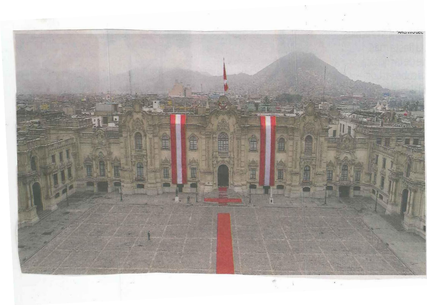
Palacio de Gobierno 2021