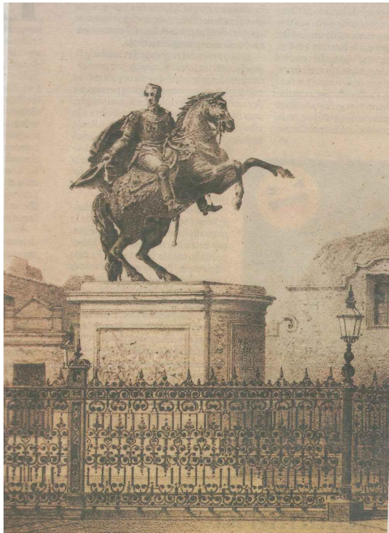
Monumento a Bolívar en la Hoy, Plaza Bolívar.

arroba. Pensar en el, asomarse a su vida leerle una arenga, verlo deshecho y jadeante en una Carta de amores, es como sentirse orleado de oro el pensamiento. Su ardor fue el de nuestra redención, su lenguaje fue el de nuestra naturaleza, su cúspide fue la de nuestro continente; su caída, para el corazón. Dícese bolívar y ya se ve delante el monte a que, mas que la nieve, sirve el encapotado jinete de corona; ya el pantano en que se revuelven, con tres republicas en el morral, los libertadores que van a rematar la redención de un mundo”.