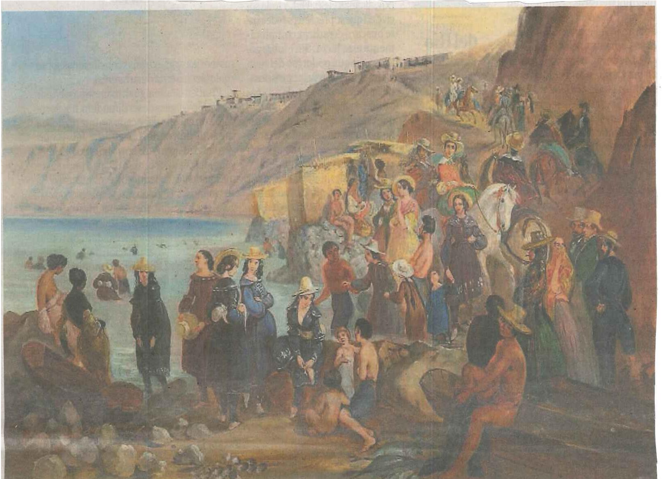
Bajada a la Playa de Chorrillos. Pintura de Johann Moritz Rugendas