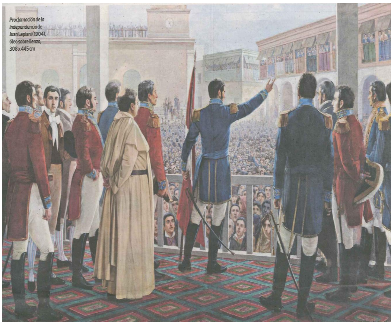
La Independencia del Perú en la Plaza Mayor de Lima, el 28 de Julio de 1821