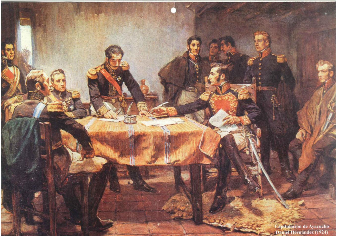
Capitulación de Ayacucho