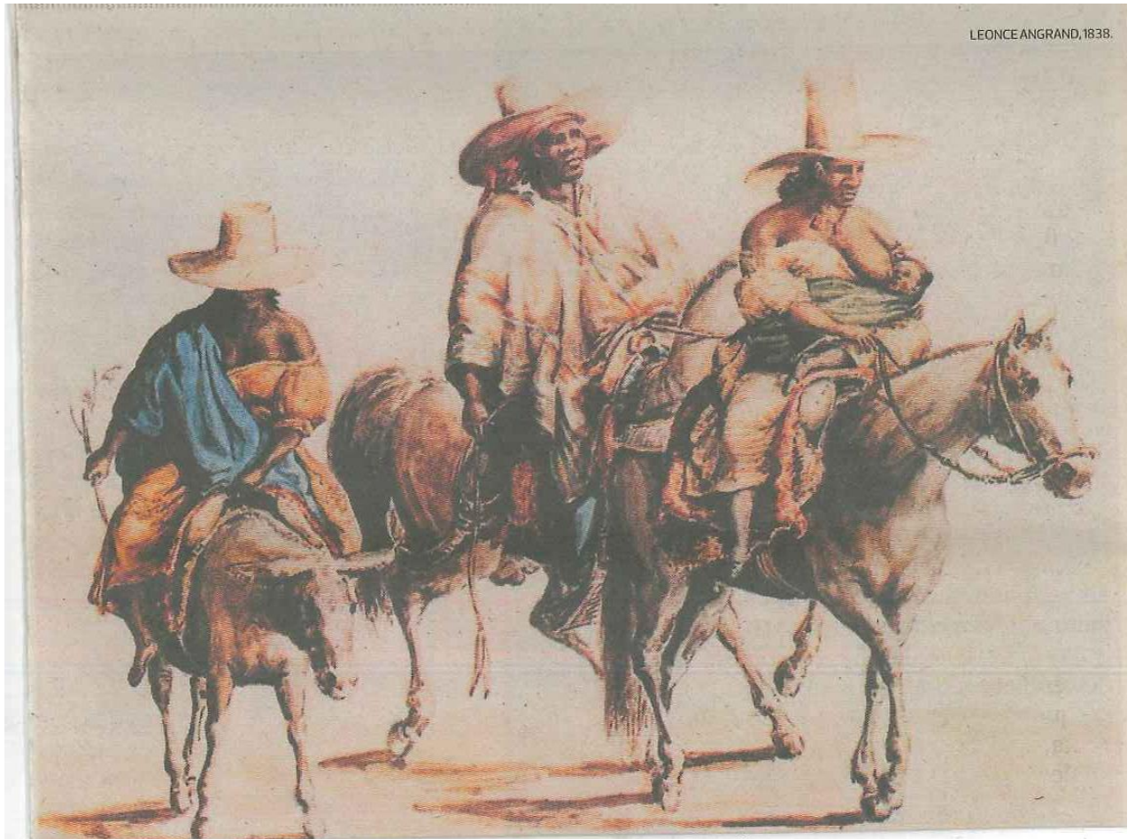
Pintura de Pancho Fierro