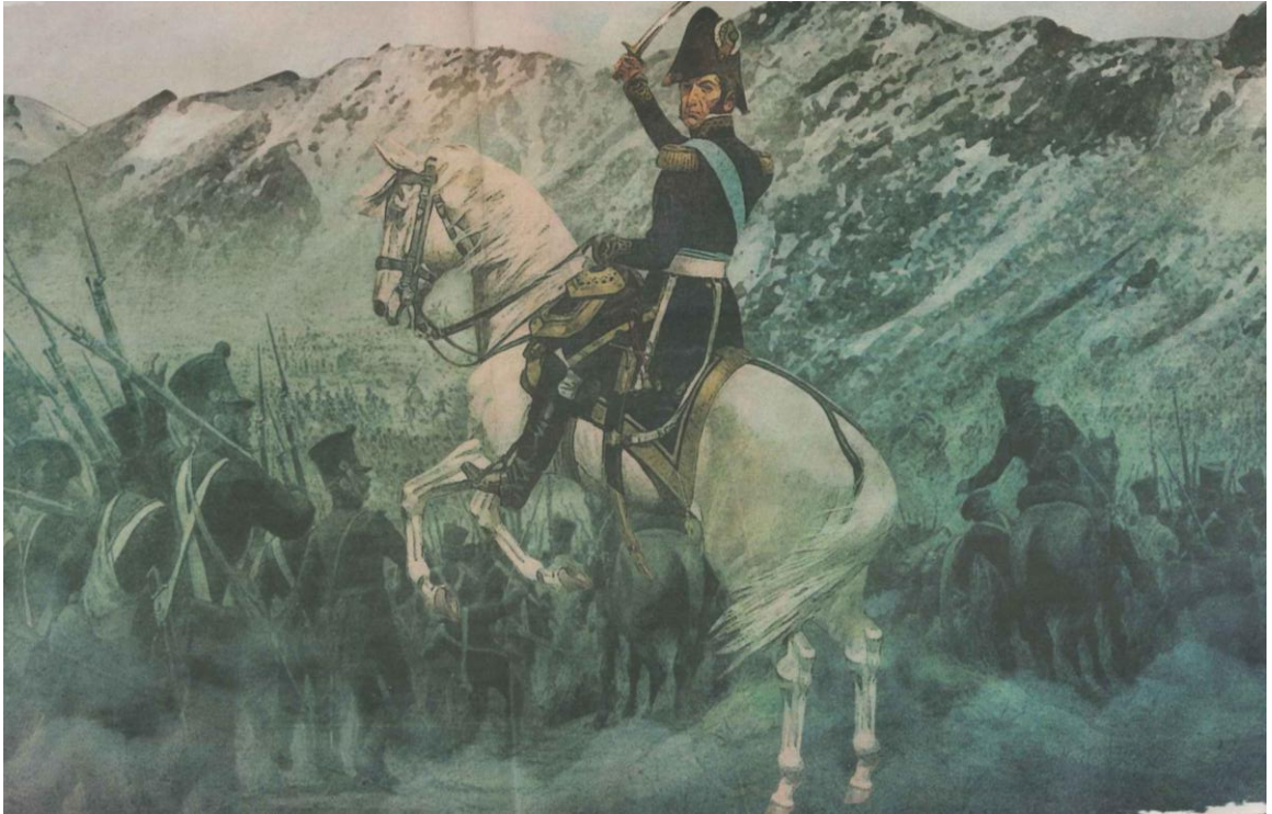
San Martín cruzando los Andes, 1818.

en el argot forense, fiel al análisis jurídico y forense, tal como los hechos nos antecedan; el tema da para más esto es solo una parte de dicha conferencia, pueden ver la bibliografía.