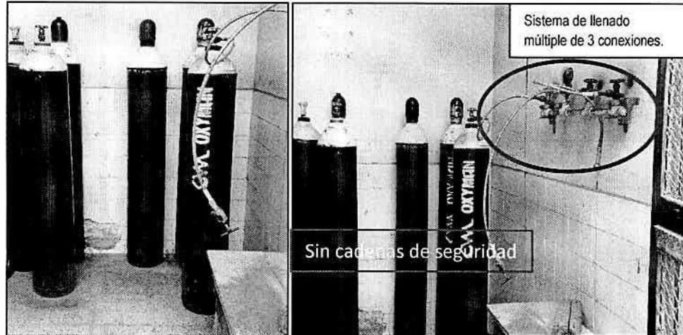
Imagen n.º 5 y 6 Balones de oxígeno no cumplen con medidas de seguridad