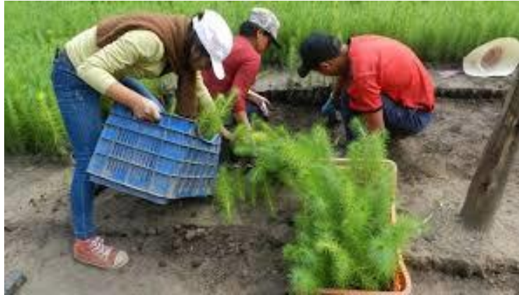
Reforestación 42 comunidades

La meta prevista en el plan estratégico institucional es de un 50% de la población protegida ante la ocurrencia de peligros naturales.