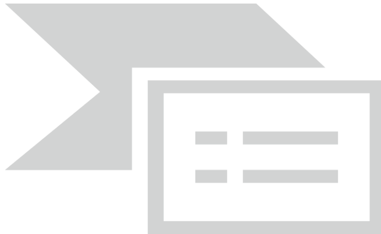
Mejorar la Calidad Educativa