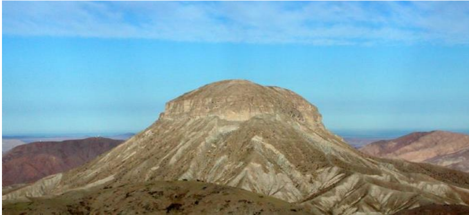
Tomado de Museo Contisuyo, Moquegua 4

El imperio Inka se extendió por más de 6,000 km. constituyendo la organización estatal más grande América. Sus antecedentes se remontan al período del Horizonte Medio, entre los 550 d.C. y 1000 d.C., cuando los estados Wari y Tiwanaku tenían poder, el primero gobernando la parte norte y el segundo, la parte sur. En el caso de los Wari, estado secular y militar, estos dominaron la mayor parte de la sierra y costa del Perú teniendo su capital en la sierra de Ayacucho. De otro lado, Tiwanaku, estado eclesiástico y mercantil, tenía hegemonía sobre Bolivia, el sur del Perú y el norte de Chile, desde su capital en el altiplano, cerca al Lago Titicaca.