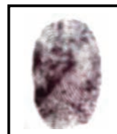
Huella digital Índice derecho