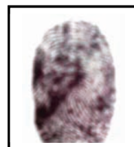
Huella digital Índice derecho