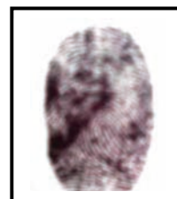
Huella digital Índice derecho