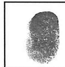
Huella digital Índice derecho