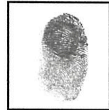
Huella digital Índice derecho