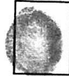
Huella digital Índice derecho