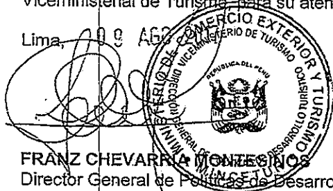
FRANZ CHEVARRA MONTECINOS Director General de Políticas de Desarrollo Turístico Ministerio de Comercio Exterior y Turismo