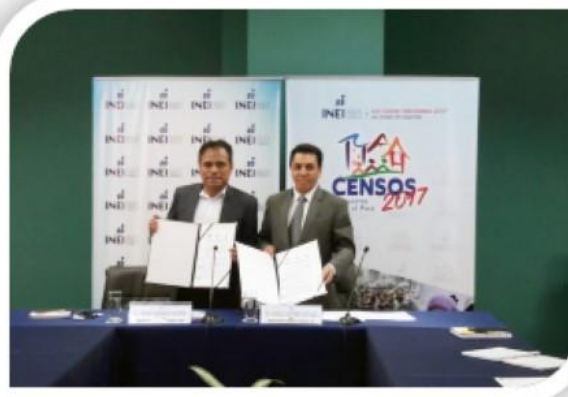
Confederación de Nacionalidades Amazónicas del Perú - CONAP