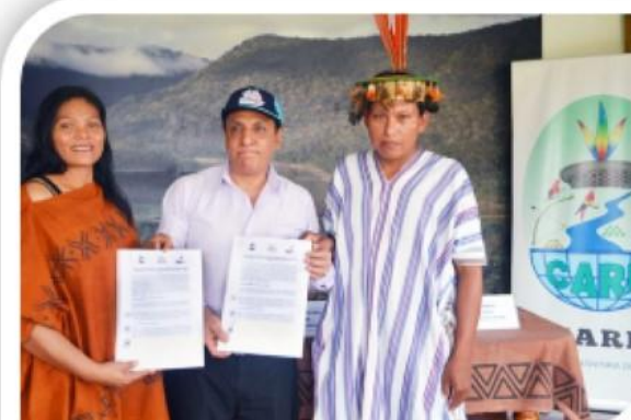
Central Ashaninka del Río ENE (CARE)