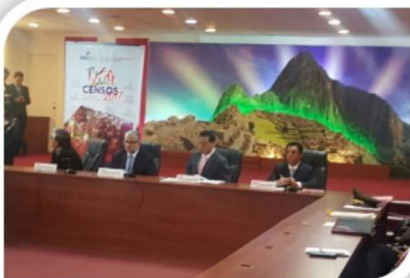
Gobierno Regional, municipalidades distritales del Cusco y la Confederación Nacional Agraria - CNA