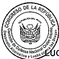
LUCIANA LEÓN ROMERO Presidenta Comisión de Defensa Nacional, Orden Interno, Desarrollo Alternativo y Lucha contra las Drogas

Hago propicia la oportunidad para expresarle los sentimientos de mi mayor consideración y estima.