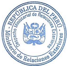
Cayetana Aljovín Gazzani Ministra de Relaciones Exteriores