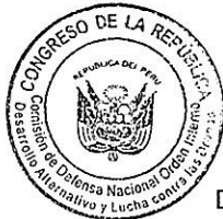
LUCIANA LEÓN ROMERO Presidenta Comisión de Defensa Nacional, Orden Interno, Desarrollo Alternativo y Lucha contra las Drogas

CONGRESO DE LA REPÚBLICA Cuarto Funcional TRANSPORTES Y MENSAJERÍA 2017 FEB 20 PM 3:35 MENSAJERÍA RECIBIDO