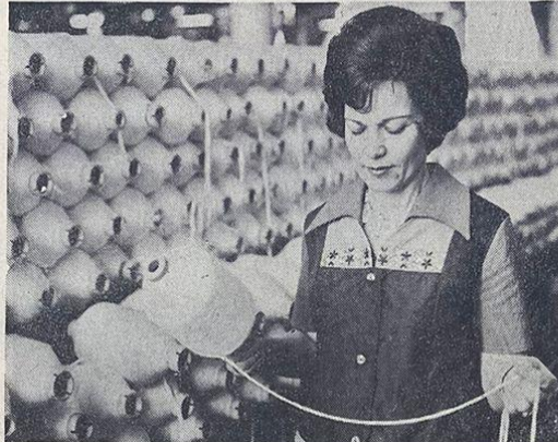
Trabajadora de la Fábrica Textil "Día Internacional de la Mujer".