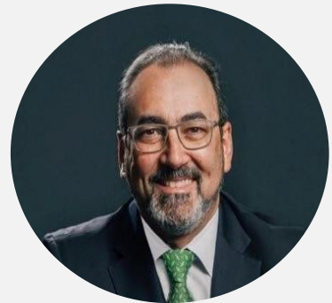
Sergio Díaz-Granados Presidente Ejecutivo, CAF

“Desde CAF buscamos contribuir al fortalecimiento institucional mediante la capacitación de líderes y lideresas de la región, en el desempeño eficaz de sus funciones, desde una perspectiva que procura asegurar un balance apropiado de variables políticas, económicas, sociales, climáticas y de género”.