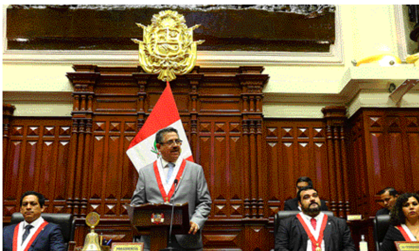
El señor congresista Manuel Arturo Merino de Lama pronuncia su discurso tras ser elegido Presidente del Congreso de la República.

suelo ni un seguro que la respalde, se gana el pan día a día. Para esta población, debemos proponer medidas de contingencia que la ayuden a soportar la dura situación creada por la necesaria medida de aislamiento social total y obligatorio. Eso pasa también porque el Ejecutivo se ocupe no solo de la emergencia, sino de atender los problemas estructurales de falta de servicios básicos en las regiones.