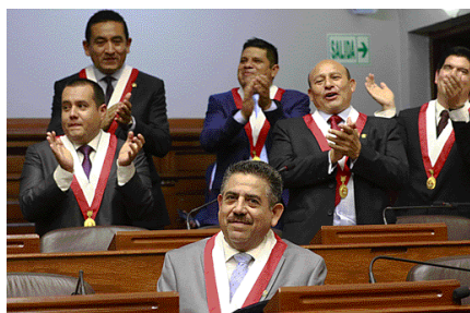
Al escuchar los resultados, los congresistas aplauden la elección del señor Manuel Arturo Merino de Lama como Presidente del Congreso de la República.