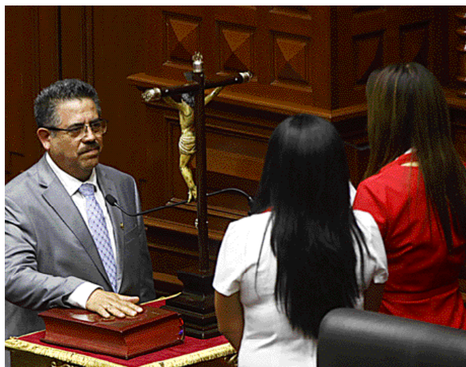
El señor congresista Manuel Arturo Merino de Lama jura como Presidente del Congreso de la República.