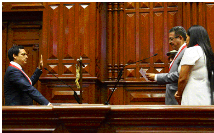
El señor congresista Luis Alberto Valdez Farías jura como Primer Vicepresidente del Congreso de la República.

El señor ALIAGA PAJARES. — Por la memoria de Alberto Andrade, bajo los lineamientos de mi partido, por el honor de mi familia y por todos los corazones somistas a lo largo de nuestro territorio, isí, juro!