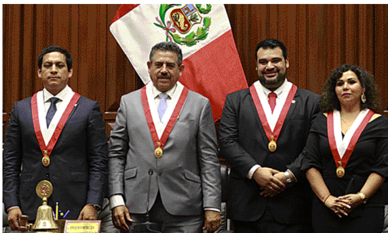
Nueva Mesa Directiva elegida para el período de sesiones 2020-2021.