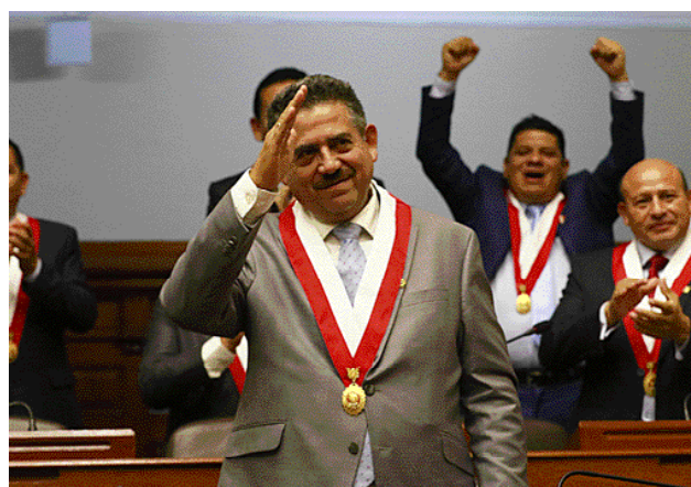
El señor congresista Manuel Arturo Merino de Lama se pone de pie para recibir el saludo de sus colegas.