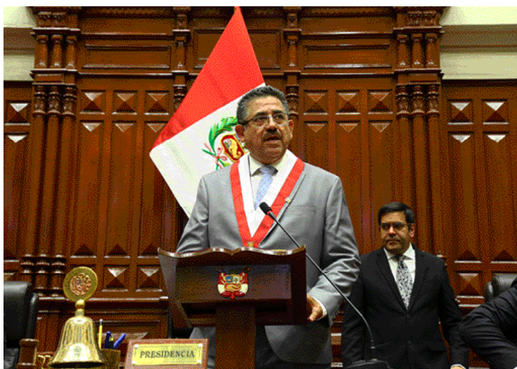
Presidente Merino de Lama: "Apoyamos la gobernabilidad en el marco de un respeto a la división de poderes".

A las 17 horas con 35 minutos, en el hemicycle de sesiones del Congreso, bajo la Presidencia de