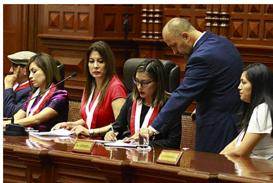
La señora presidenta realiza el conteo de los votos para elegir a los miembros de la Mesa Directiva del Congreso para completar el período de sesiones 2020-2021.

—El RELATOR llama a cada uno de los miembros de la Mesa Directiva de la Jun-